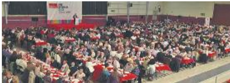
Una imatge d'una de les calçotades de la polèmica.

Des de l'Ajuntament han assegurat a Línia Tres que encara no han rebut cap notificació de l'oficina, però aquesta publicació ha tingut accés a la carta de resposta de la sindicatura a la queixa d'ERC on s'explicita que sí que s'ha posat en contacte amb el consis-