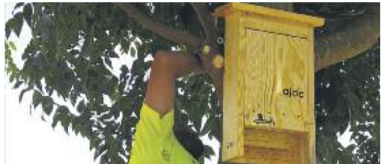
Un instant de la instal·lació de les caixes.

MEDI AMBIENT ▶ L'Ajuntament ha col·locat quatre caixes niu per a ratpenats al voltant dels horts municipals de Can Cardona.