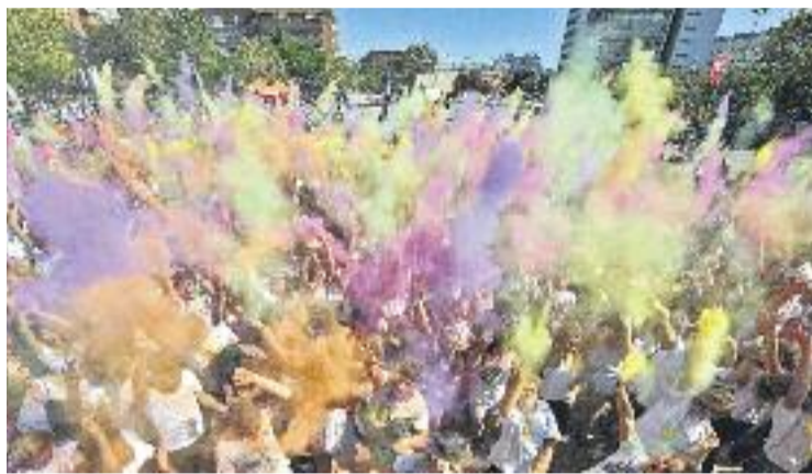
La Festa Holi es reeditarà diumenge dia 18.