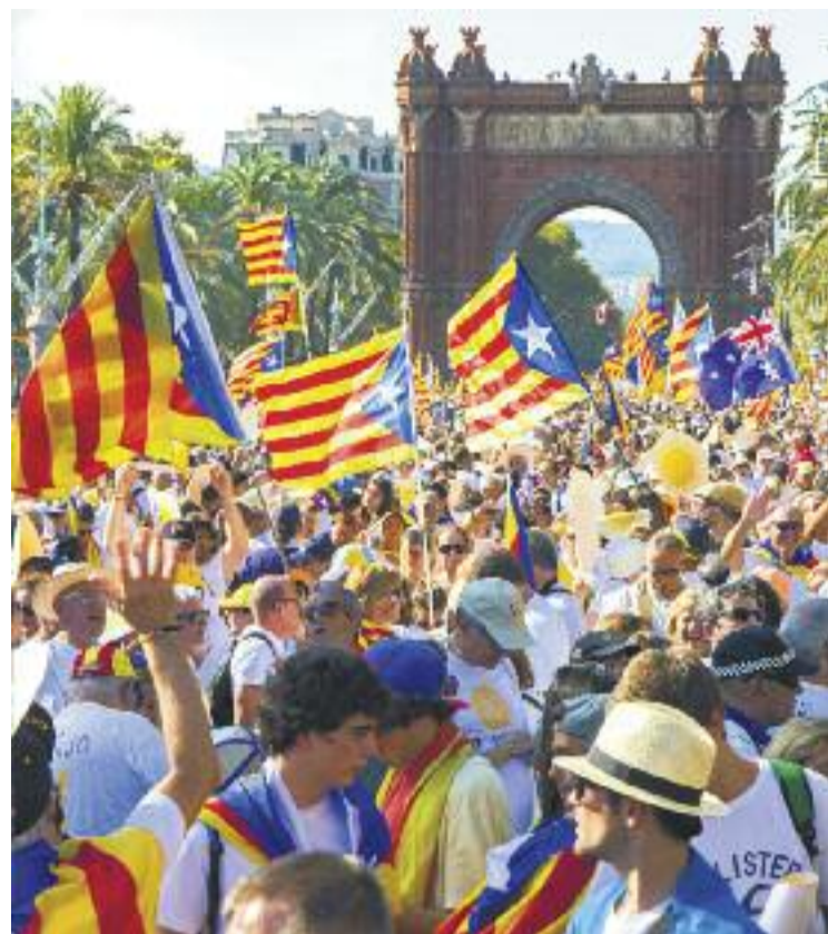
El passeig de Sant Joan de Barcelona es va omplir a vessar de manifestants a favor de la República Catalana.