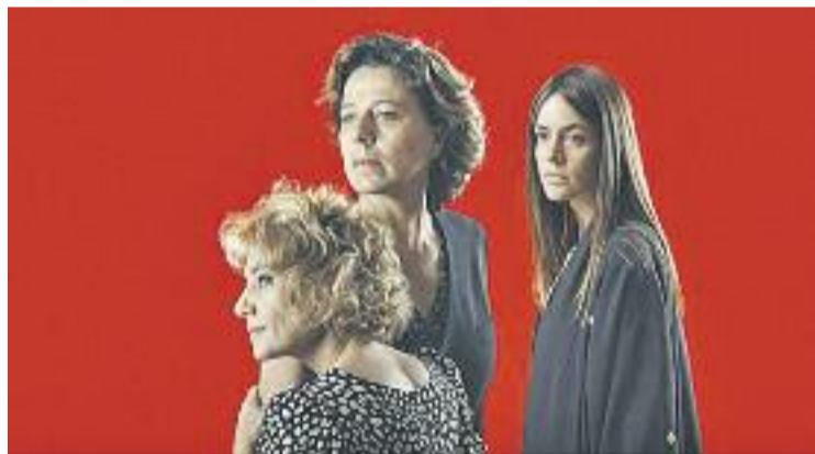
Només són dones, amb Picó, Iscla i Makovski.

TEATRE ▶ El record del patiment de milers de dones a les presons durant la guerra civil és el tema central de l'obra de teatre Només són dones , que s'estrenarà al Mercè Rodoreda el pròxim 7 d'octubre a les 10 de la nit.