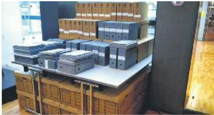
Caixes amb els documents retornats als seus propietaris.

Els dos documents corresponen a una liquidació d'ingressos i despeses d'un festival benèfic que es va celebrar al