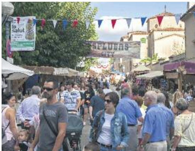
El mercat de temàtica 'western' torna amb Sant Mateu.

El parc dels Torrents repetirà també com a escenari de l'esdeveniment, que aplega parades i activitats diverses sota el paraigua de la temàtica western . És important remarcar-ho perquè fins fa dos anys l'ambientació del mercat era ben diferent: va passar d'un espai amb decoració medieval a un amb cowboys i indis. Segons va dir el regidor de Cultura d'aleshores, Eduard Sanz, aquesta decisió es va pren-