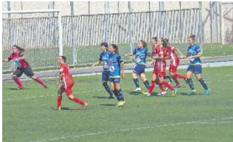
El Levante va perdre contra l'Igualada a les Planes.

El Levante va continuar proposant, però la recompensa va ser per a les visitants. Corria el minut 15 del segon temps quan Núria va fer l'única diana del matx gràcies a una falta directa que Schmidt no va poder aturar. El gol va ser un cop dur per al Levante, que veia com l'Igualada replegava línies i dificultava el seu joc, però conti-