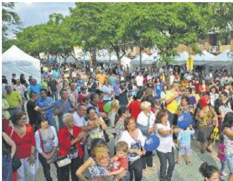
La fira sol aplegar milers d'espluguins cada any.

L'altre fet innovador és que en aquesta edició s'ha incorporat una moneda pròpia. Cada "fitxa" té un valor de dos euros i se n'han fet 10.000. Aquestes "fitxes" es podran utilitzar com a descompte en compres que es facin posteriorment als establiments comercials del teixit associatiu espluguís. Les monedes