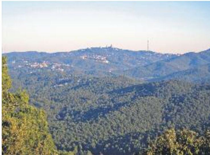
A Collserola es registren entre 3 i 3,5 visitants anuals.

Per tant, la taula de treball haurà d'arribar a acords per abordar accions sobre l'ús públic de tots aquests espais. Fins ara, ja s'han proposat algunes mesures que tenen per objectiu "minimitzar l'impacte ambiental de les activitats esportives de gran format", segons expliquen des del consistori. Aquestes accions s'implementarien a partir