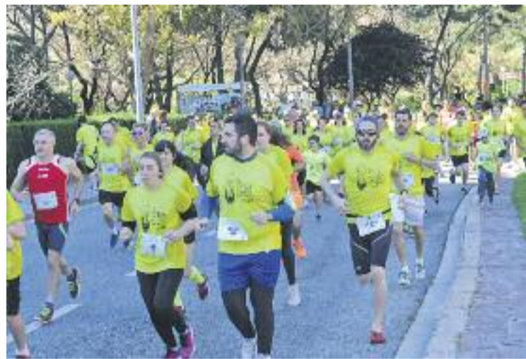
La Cursa Solidària va arribar a la seva sisena edició.