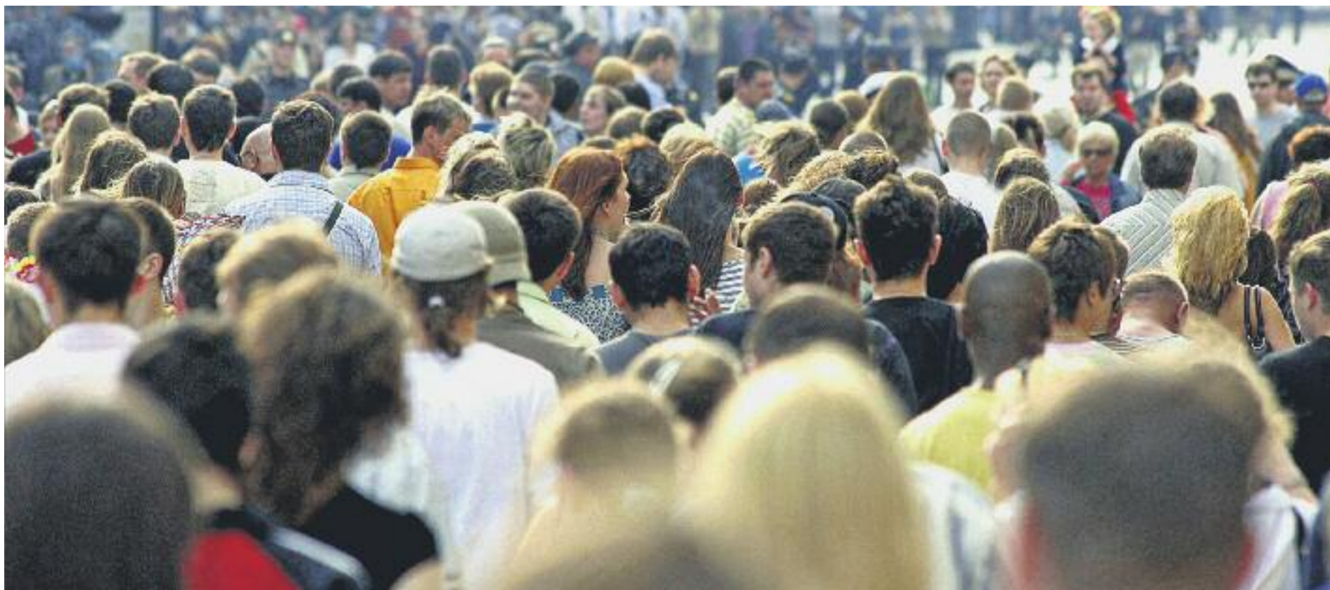
La població actual del Baix Llobregat, segons l'Informe Socioeconòmic del Consell Comarcal, és de 806.000 habitants.