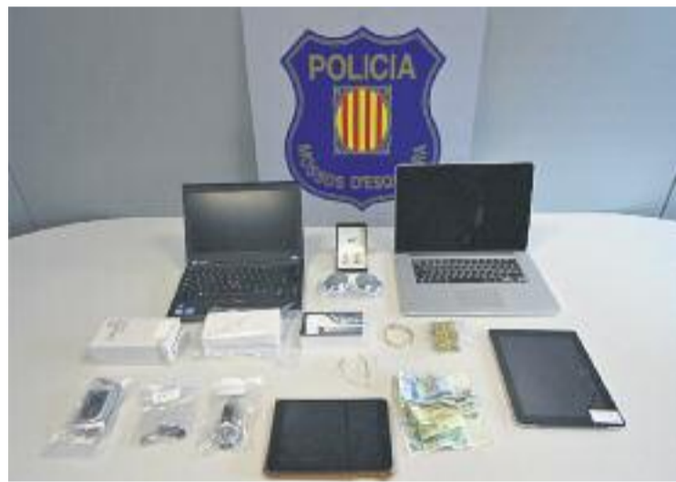
Una imatge dels objectes recuperats per la policia.

El modus operandi dels presumptes infractors era entra als domicilis de les víctimes mentres aquestes dormien. De fet, l'endemà del robatori del mes de febrer els propietaris van comprovar que els havien robat diversos objectes de valor sense que se n'haguessin adonat.