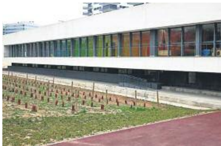
Molts actes se celebraran al Centre d'Empreses Fontsanta.

tres. A Sant Joan Despí el pròxim dijous 26 de maig tindrà lloc una formació amb el títol La cooperativa, empresa amb valors . El 25 de maig es presentarà al municipi la Xarxa d'Innovació Social del Baix Llobregat. El 31 de maig s'oferirà el curs L'empresa social: una eina innovadora per a resoldre necessitats socials ; i el 2 de juny s'oferirà una xerrada sobre el consum responsable.