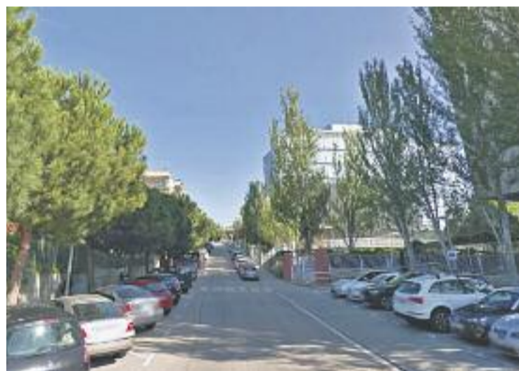
Un dels carrers afectats és el de Melcior Llavínés.

La petició de canvi de noms la va fer l'Associació de la Memòria Històrica i Democràtica del Baix Llobregat i es va acordar durant el Ple del passat novembre de l'any passat. Ara s'ha constituït una comissió que s'encarregarà d'impulsar la mesura.