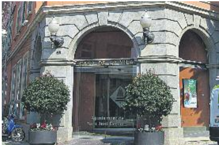
El Ple també va liquidar els pressupostos municipals.

Durant el mateix Ple el consistori va aprovar la liquidació del pressupost municipal. Segons l'A-