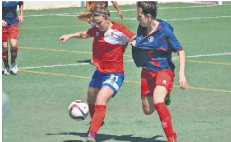
Les planenques van derrotar el cuer.

Per altra banda, el passat dia 17 es va fer el sorteig de la Copa Catalunya femenina. L'equip de-