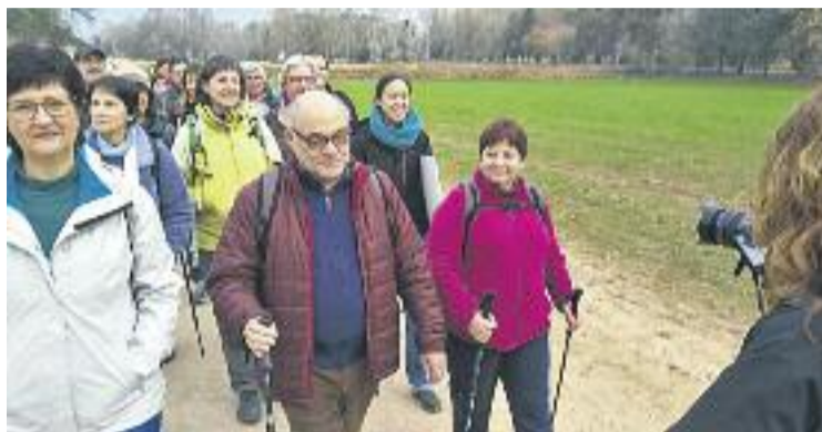
Rodatge del vídeo promocional de la Marxa.

Al Baix Llobregat se celebraran diverses etapes. La primera serà el 24 de juliol i recorre 7,3 quilòmetres des d'Esplugues fins a Sant Feliu. L'endemà es recorre de Sant Feliu a Molins de Rei -14,3 quilòmetres-. El 26 de juliol la ruta sortirà de Molins de Rei, passarà pel