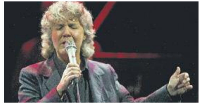
Mayte Martín va actuar divendres 20 de maig a la ciutat.

CULTURA ▶ Divendres 20 de maig, la cantant Mayte Martín va actuar al Teatre Mercè Rodoreda. Ho va fer amb l'espectacle Boleros y otras canciones de amor a les deu de la nit. L'espectacle va tenir una durada d'uns noranta minuts.