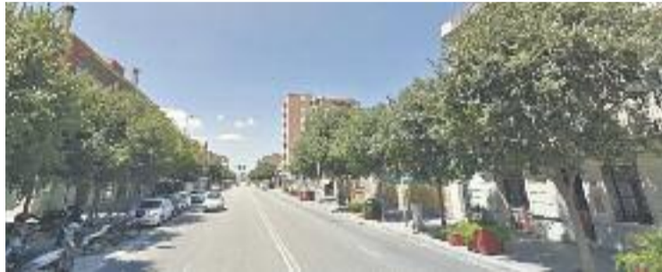
Tram de la Carretera Reial on es reclama el tramvia.

"No volem que es tregui el servei que actualment fa la T3 per