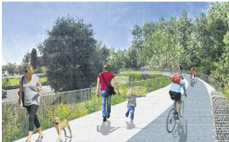
Imatge digital de l'aspecte que tindrà el carril bici en un dels trams.

La connexió d'Esplugues per l'avinguda dels Països Catalans fins a la Diagonal és una actuació reivindicada per la ciutat des de fa anys. L'alcaldeessa Pilar Díaz ha celebrat la notícia i ha dit que amb aquest nou carril per a bicicletes s'aposta "per una política de protecció i millora del medi ambient, així com per un dia a dia més saludable". Díaz