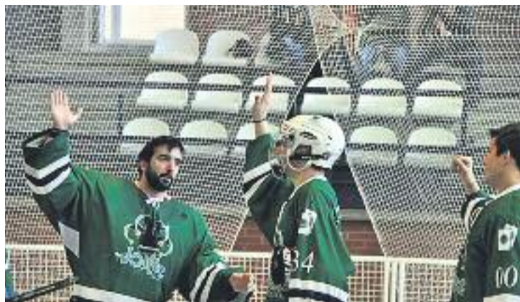
El sènior masculí jugarà contra els millors equips de l'estat.

D'aquesta manera, la temporada que ve els santjoanencs