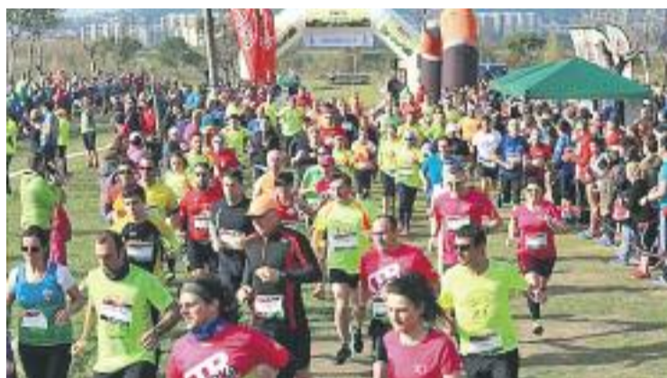
Un moment de la maratón per equips.