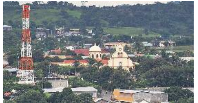
Una imatge de la ciutat de Camoapa.

L'ONG local Sant Just Solidari és l'encarregada de vehicular les accions de solidaritat i cooperació amb el municipi nicaragüenc amb la subvenció de l'Ajuntament. Sant Just Solidari destaca que "a través de l'agermanament es treballa perquè la mateixa població de Camoapa avanci cap al desenvolupament".