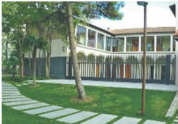
La celebració va tenir lloc a Les Escoles.

El gruix de l'esdeveniment va consistir en la celebració d'una taula rodona amb la qual es va