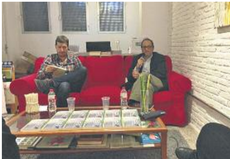
Quim Torra durant la presentació del llibre.