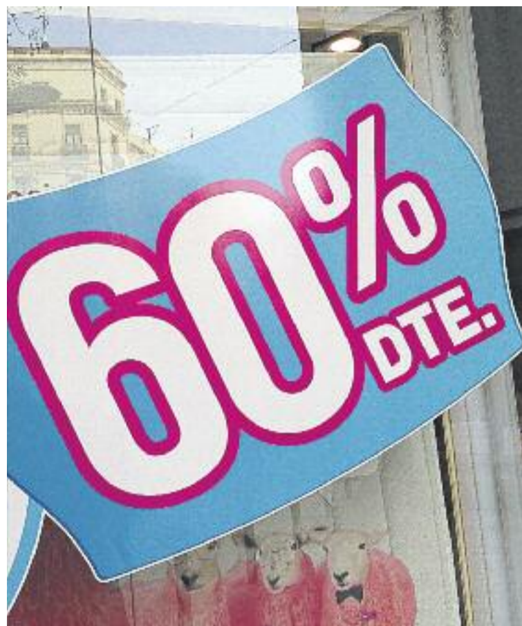
Els descomptes oscil·laran al voltant del 40%, tot i que alguns comerços en faran de més grans.