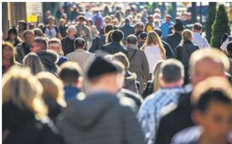
La comarca té 806.651 habitants, un 0,05% més que el 2014.

Per municipis, la població d'Esplugues ha disminuït un 1,10%, amb 507 espluguins menys. En total, el municipi té ara 45.626 habitants. En canvi, a Sant Joan Despí i Sant Just Des-