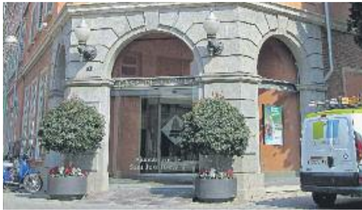
Els comptes ascendeixen enguany als 23 milions d'euros.

Es van aprovar amb els vots favorables de l'equip de govern -PSC, ERC i Movem Sant Just-. El Partit Popular i Ciutadans es van abstenir. Els populars sostenen que la seva decisió té l'objectiu de "donar un vot de confiança al nou equip de govern". Ciutadans, en canvi, es va