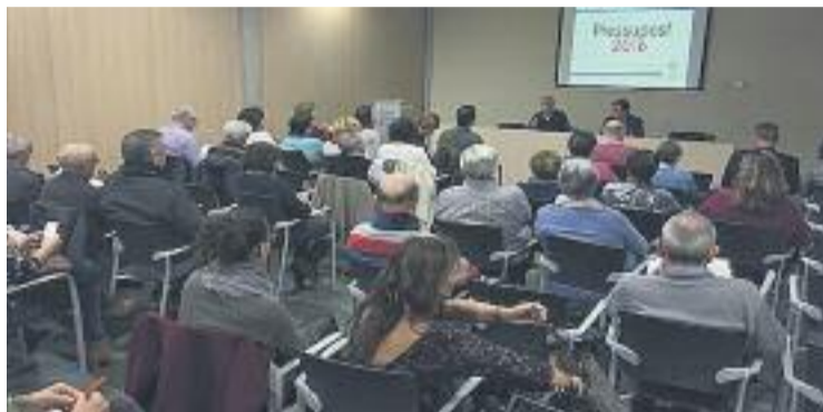
Els comptes es van presentar el 21 de desembre.

La majoria d'aquestes actuacions consistiran a remodelar diversos carrers de la ciutat. De moment, l'Ajuntament ja anunciat que dues d'aquestes vies a millorar són els carrers de Bon Viatge i carrer Major.