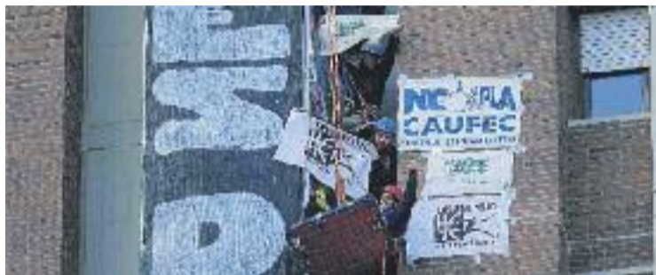
Una de les protestes contra el Pla Caufec.

La Fiscalia acusa els vuit veïns d'Esplugues de delictes d'atemptat contra l'autoritat i desordres i de faltes de lesions i contra l'ordre públic. "Tres com-