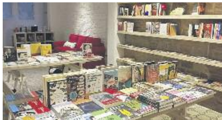
La llibreria va obrir el 9 de gener.

Cònsul i Vogt tenen la voluntat de donar representació a editorials joves que estan editant llibres de qualitat. A més de novetats editorials, la nova llibreria compta amb obres d'autors de renom com Agota Kristof, Agustí Hipona i Ramon Muntaner.