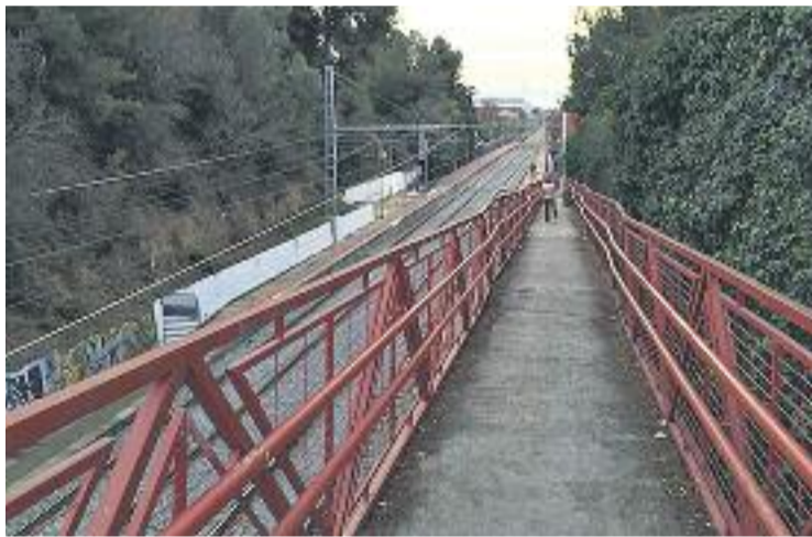
La rampa d'accés estarà tancada fins a l'estiu.

A més, es col·locaran càmeres de seguretat i es tornarà a pintar l'edifici.