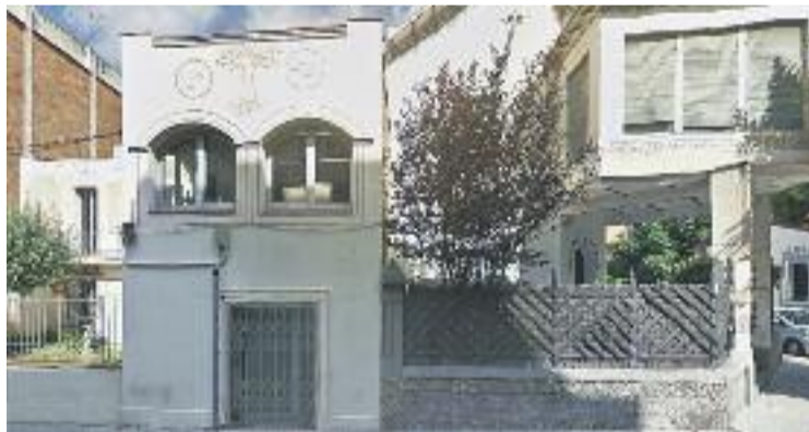
Centre d'Empreses Jujol, obert el 2011.