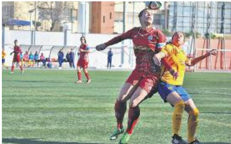
El Levante va jugar un gran partit contra el líder.