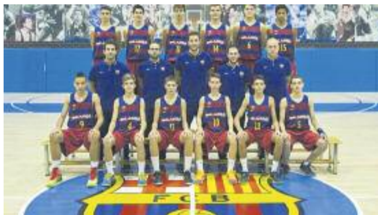
Els blaugrana van superar el Madrid a la final.

ESPLUGUES ▶ Un any més, i ja en van 17, el CB Nou Esplugues va organitzar el Torneig Internacional cadet Ciutat d'Esplugues. El FC Barcelona es va imposar en aquesta competició, que també comptava amb el Joventut, el Madrid, el Basket, el CB Manresa, la Unió Manresana, el KK Petrograd serbi i la Juve Pontedera Pallacanestro italià.