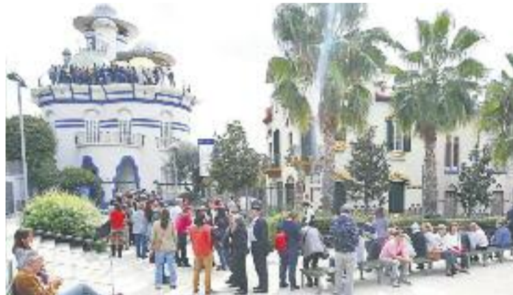
Visitants a la Torre de la Creu, l'indret més visitat.

L'objectiu de les jornades és donar a conèixer el patrimoni modernista del municipi i altres espais d'interès arquitectònic. Els indrets més sol·licitats van ser la Torre de la Creu i Can Negre, els quals van aglutinar 1.148 i 931 visitants, respectivament. La casa modernista de Can Po Cardona va registrar un total de