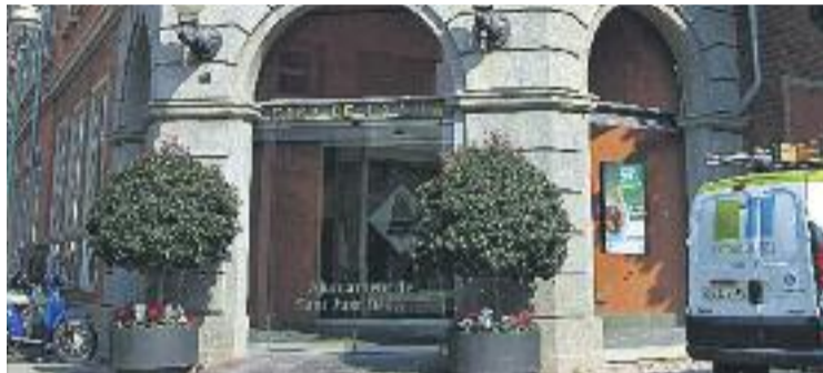
El Ple es va celebrar el passat 29 d'octubre.

Les noves ordenances fiscals contemplen un increment de l'1,5% per als principals impostos, la mateixa previsió, s'afirma des del consistori, de l'Índex de Preus al Consum (IPC) per al pròxim any. De tota manera, les taxes de vehicles i d'equipaments municipals s'han