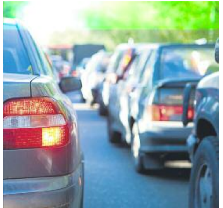
Les diverses línies de transport i l'alt nivell de trànsit, les principals fonts de soroll a Esplugues, Sant Joan i Sant Just.