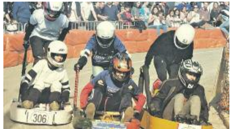
Una imatge de la cursa de diumenge.

SANT JUST ▶ Un cop més, i ja en van 39, Sant Just va sortir al carrer per gaudir de la Cursa Karts de Coixinets, una popular competició amb dècades de tradició i que cada any se celebra al circuit urbà comprès entre el carrer Creu del Pedró i el carrer Freixes.