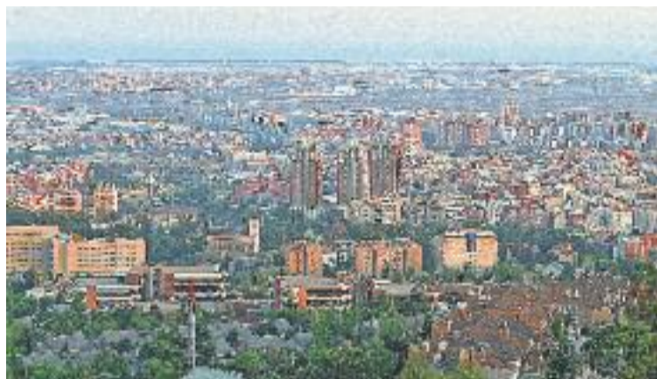
El consistori elobararà el PAM per al 2016-2019.

Concretament, la ciutadania té a la seva disposició un formulari per opinar sobre les actuacions previstes per a la legislatura. La butlleta de participació, tanmateix, només contempla tot un seguit de pre-