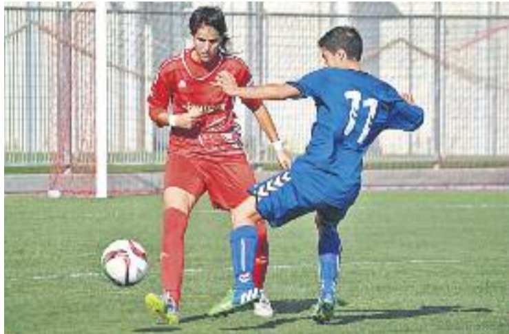
El Levante és quart amb 15 punts.

Les blaves van tornar a la gespa amb força després de la pau-