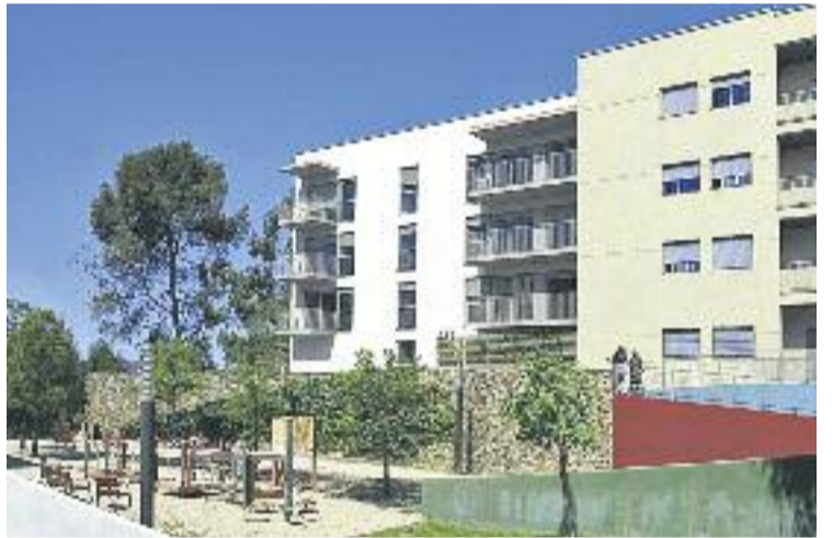
El restaurant va obrir a principis de mes.

Els menús d' El Brot estan elaborats amb productes de proximitat i segueixen una dieta principalment vegetariana. Segons explica Martín, "també hi haurà carn i peix, però fugim dels típics menús on majoritàriament aquests productes tenen molta presència". La seva filosofia és de cuina sostenible i ecològica.