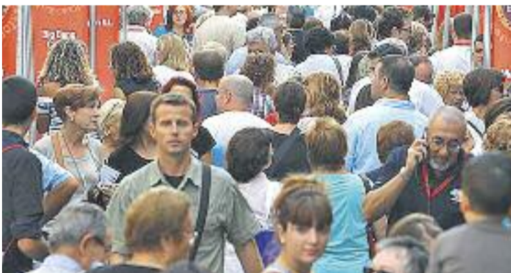
Els carrers es van omplir de gom a gom per la fira.

En el marc de la fira també es van celebrar diverses activitats paral·leles que van atraure una gran afluència de visitants. Es va