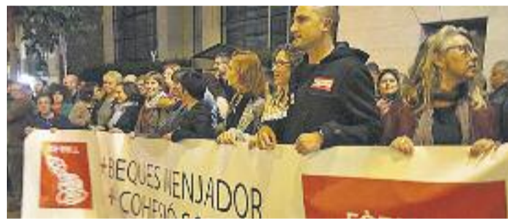
La pancarta de la concentració del dia 5.