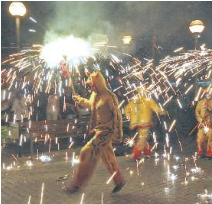
La cultura popular estarà representada en el correfoc.