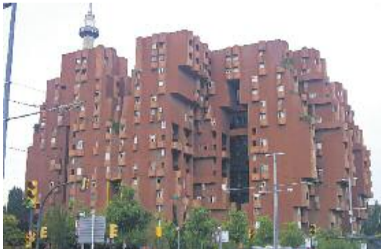
El Walden 7 és una creació del Taller d'Arquitectura.

Al llarg de l'any també s'han fet millores a la façana de l'edifici i s'han renovat els baixants,