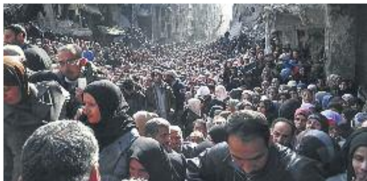
Quatre milions de persones han fugit de Síria per la guerra.

A Esplugues, per exemple, s'ha aprovat un pla d'accions dotat amb 20.000 euros i que es podrà aplicar segons les necessitats i que inclou, entre altres, la creació d'un registre de famílies que s'ofereixen a acollir els desplaçats sirians.