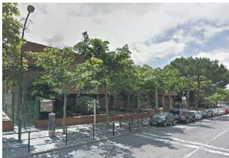
Una imatge de l'escola Folch i Torres.