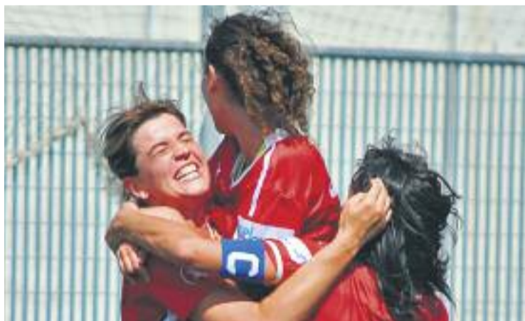
L'equip celebra un gol contra l'Estartit.

SANT JOAN ▶ Després de la gran temporada passada, el sènior femení del Levante Las Planas també ha arrencat amb força enguany. Les santjoanenques han superat amb nota l'inici del campionat, i van gaudir d'una jornada de descans el passat cap de setmana.