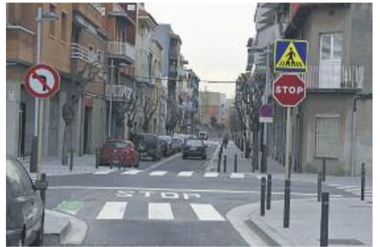
Un dels carrers on s'ha treballat.

El tractament consisteix a aplicar esquers a l'interior dels pous, on es llença un producte biocida en forma de gel que elimina la plaga.