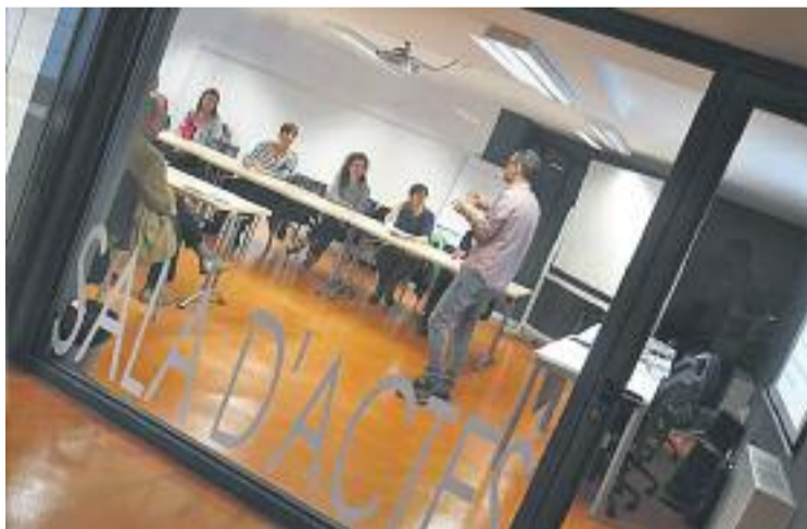
Els emprenedors guanyaran temps amb el nou servei.

En concret, el nou servei ajudarà a simplificar els tràmits per posar en marxa un negoci i, a més, a escurçar el termini per arrencar l'empresa, gràcies al fet que la majoria de gestions es poden fer telemàticament.