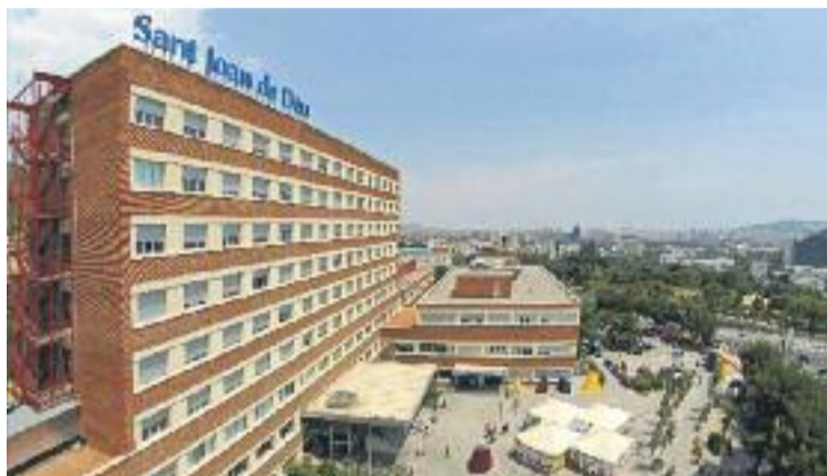
Façana de l'Hospital Sant Joan de Déu.

L'objectiu de l'acord és que els nens i nenes que pateixen càncer rebin cures pal·liatives de