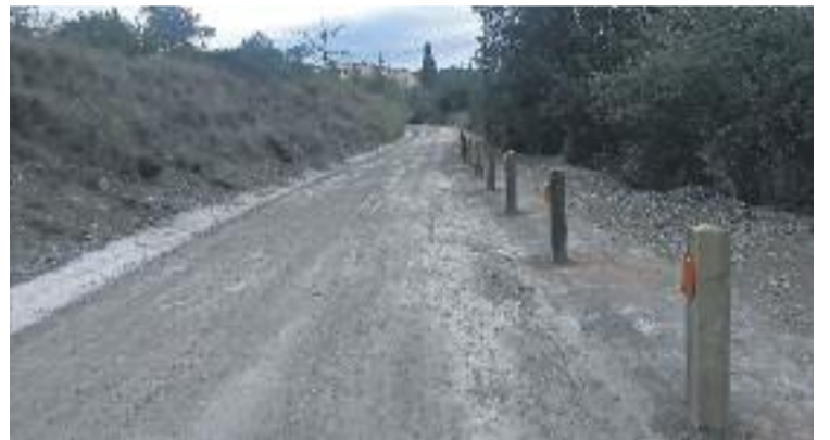
Nou aspecte del Camí de Muntanya.

A més, també s'ha començat a remodelar la masia de Can Freixas, situada al centre del municipi. S'ha iniciat la primera fase, assegurant la coberta de l'edifici, que data del segle XVIII. Finalment, s'han fet diversos treballs de manteniment de la via pública en alguns barris de la ciutat a través de la Unitat d'Intervenció Ràpida (UR).