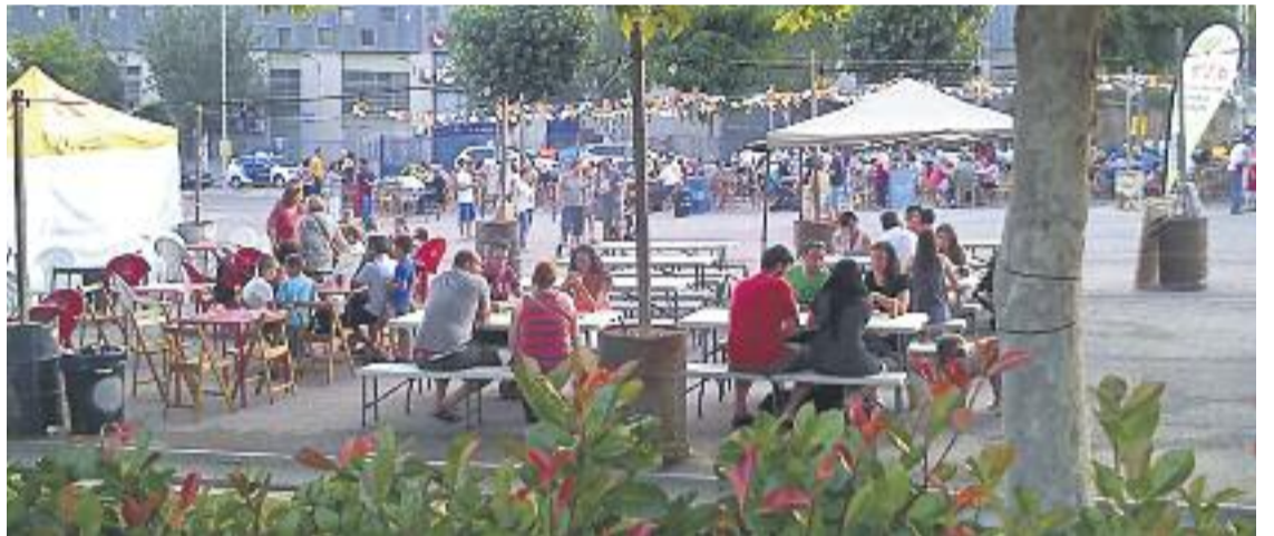
La festa oferirà activitats per a tots els públics.