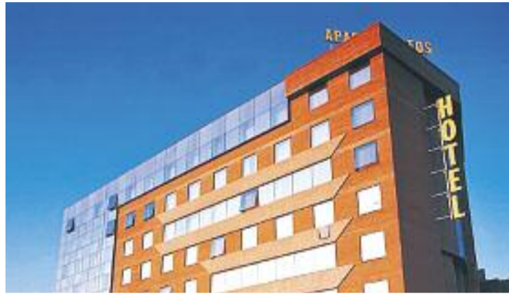
Un hotel de Sant Joan Despi.

Segons dades de l'Observatori, durant el primer trimestre d'aquest any s'ha registrat l'ocupació hotelera més elevada