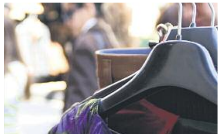
El Ple va aprovar la modificació fa uns dies.

Ara, arran de la modificació del document, es facilitarà l'activitat econòmica, això sí, "respectant les determinacions arquitectòniques de protecció del Pla", segons ha informat el consistori.