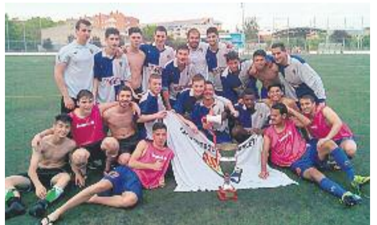
La plantilla celebra la consecució de l'ascens.