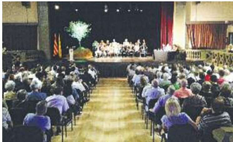
Acte d'investidura de Perpinyà.