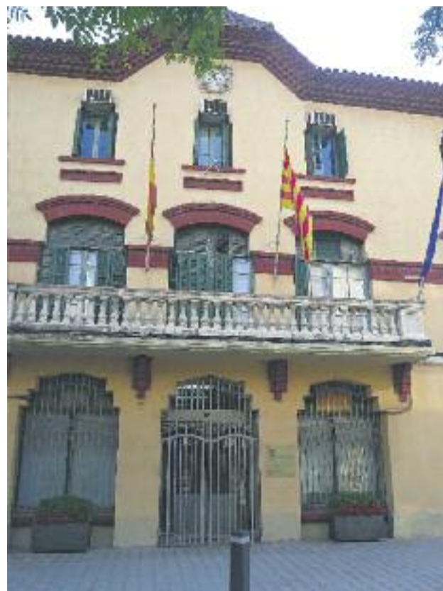
Els ajuntaments de Sant Just, Esplugues i Sant Joan, tres feus tradicionals del PSC.