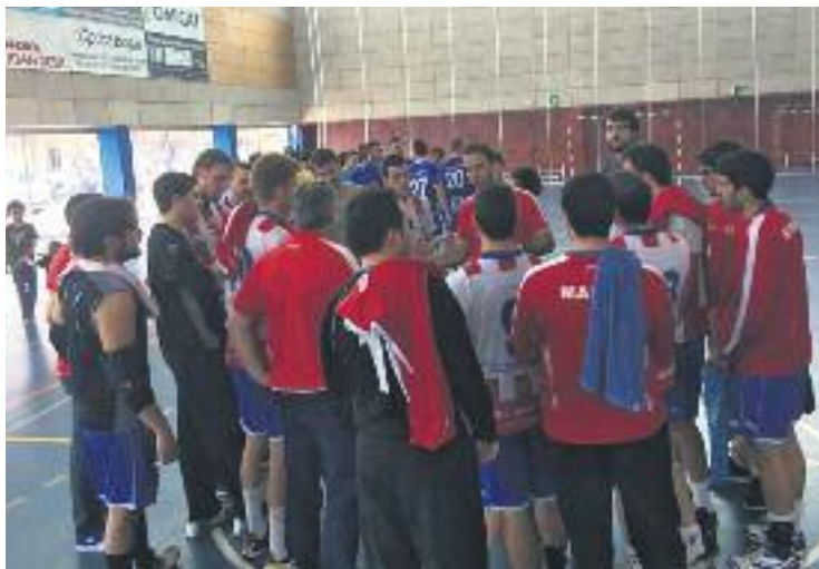
L'Handbol Sant Joan Despí seguirà a Primera estatal.