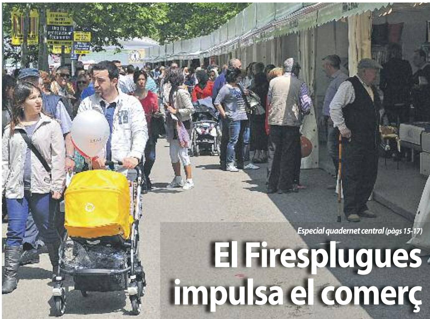
Especial quadernet central (pàgs 15-17)

La ciutat acull demà la cloenda de la tradicional festa amb una cercavila de més de 100 carros i 400 cavalls pàg 24