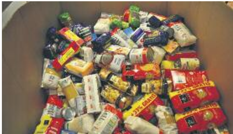
L'oli i la farina són dels aliments més escassos.

Es tracta d'un recapte de caràcter extraordinari que s'ha ce-