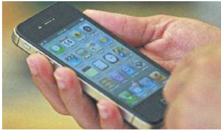
L'aplicació porta el nom de NeuroMeck.

Una altra característica d'aquesta aplicació és que cada usuari podrà adaptar els continguts als seus interessos i necessitats, de manera que podrà decidir la informació que vol a cada moment.