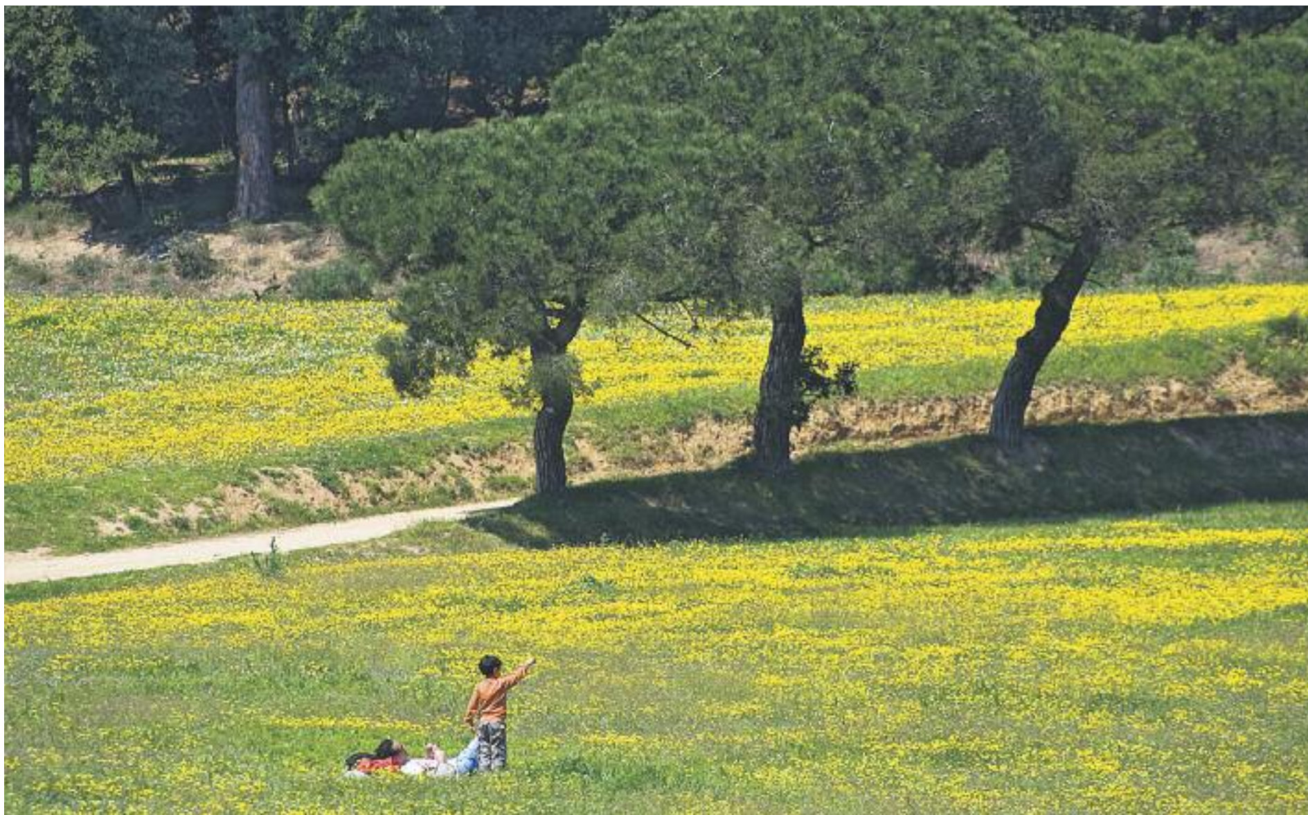
La natura es converteix en l'escenari idíl·lic per fugir de la rutina.

» Al voltant de Barcelona es pot gaudir de la natura en família en més de 150 cases de pagès i allotjaments rurals d'arquitectura tradicional ubicats en petits municipis o en plena natura