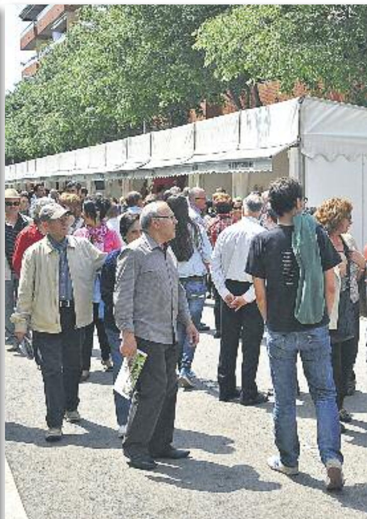
Durant la fira hi haurà espectacles i tallers per a totes les edats i públics.