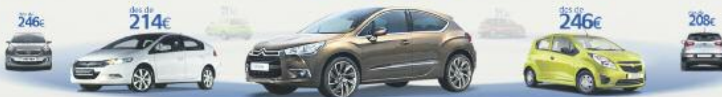
Citroën DS4-1.6 VTI 120 Design SP 120CV. Preu anual orientatiu amb bonificació.

TERCERS AMB ASSISTÈNCIA EN VIATGE des de 114€