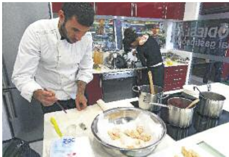
Un curs a la nova aula gastronòmica.

Segons han informat els organitzadors, des d'ara fins al pròxim mes de juny s'oferiran una quinzena de tallers de diverses temàtiques. N'hi haurà un dedicat als arrossos, un altre a plats elaborats amb bacallà, un sobre l'elaboració de la cervesa i un altre taller de vermut i aperitius, entre altres.