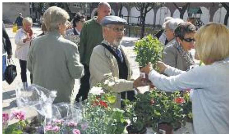
Els comerços van lliurar plantes als seus clients.

L'entrega de les plantes es va fer a la plaça d'Antonio Machado, a la plaça de l'Ermita, a la plaça de Maria Aurèlia Capmany i a la plaça de l'Estatut.