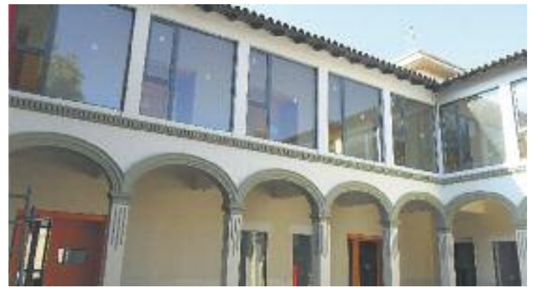
Les sessions es van fer a Les Escoles.

Abans de les jornades participatives, l'Ajuntament ja va encarregar a la Diputació l'elaboració del PAC, que ha servit com a punt de partida per a començar el procés.