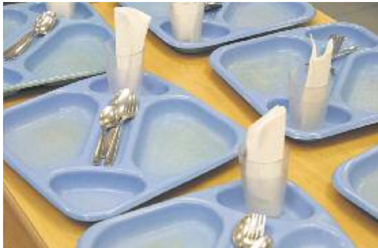
L'Ajuntament vol que a la llarga hi participin més escoles.

El projecte està coordinat des dels serveis municipals de