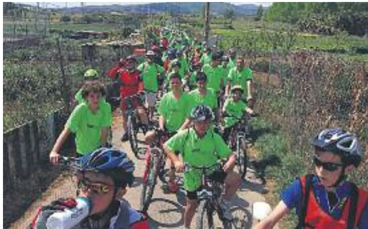
Alguns participants de la primera de les sortides en bici.

Tot i que uns 300 alumnes de diferents escoles ja havien participat en activitats similars com Els dijous, anem a l'escola en bici –una iniciativa que impulsa l'ús de patinets i bicicletes–, l'edició d'enguany va arrencar el passat 19 d'abril amb una gran festa que incloïa un circuit d'habilitats per als més petits i un recorregut per la ciutat.