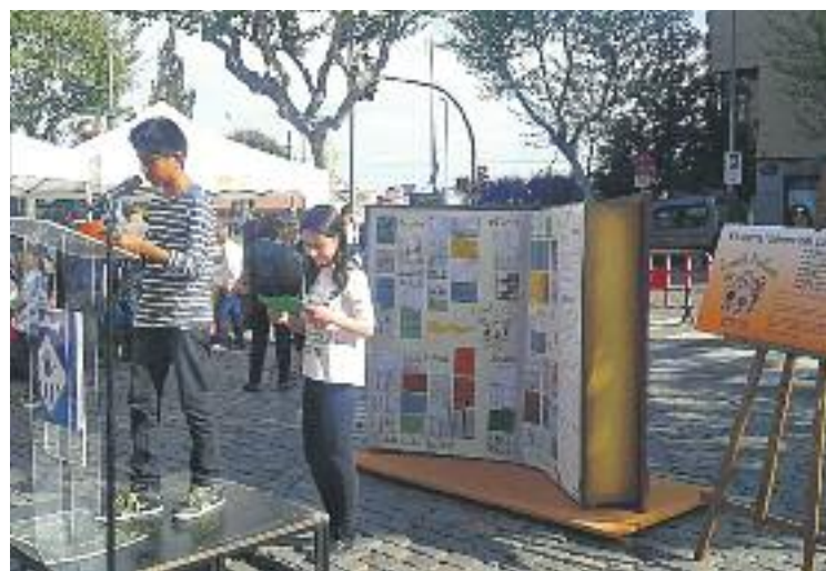
Presentació dels acords del Consell d'Infants.