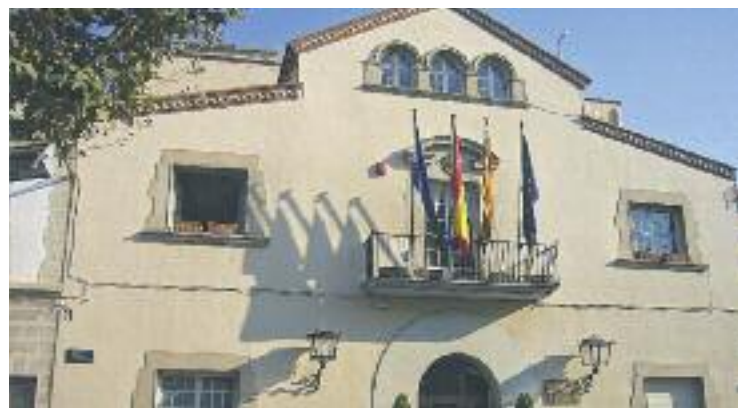
El Ple va votar a favor, excepte l'abstenció d'un regidor no adscrit.

Per al PP, aquest "és un acord molt positiu", mentre que ICV-EUiA creu que la tasca mediatra del consistori "hauria d'haver estat des de l'inici de l'Oficina d'Habitatge". CiU també hi està conforme i ERC, a més, demana la renovació del Pla d'Habitatge d'Esplugues, "que va caducar el 2012".