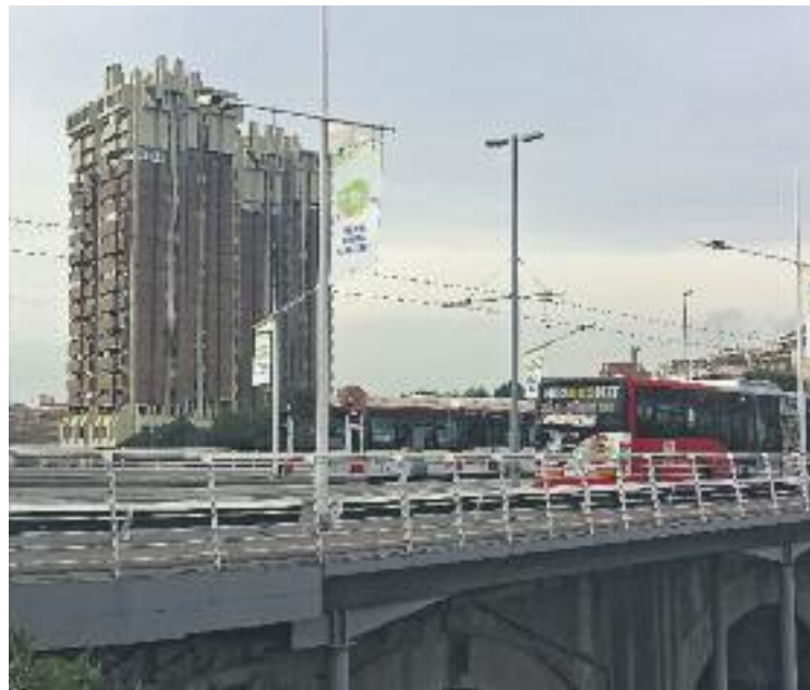
Un dels punts afectats pel canvi de llums.

Segons han explicat fonts municipals, les noves llums LED són "més eficients", ja que tenen una durada estimada de deu anys, fet que representa unes