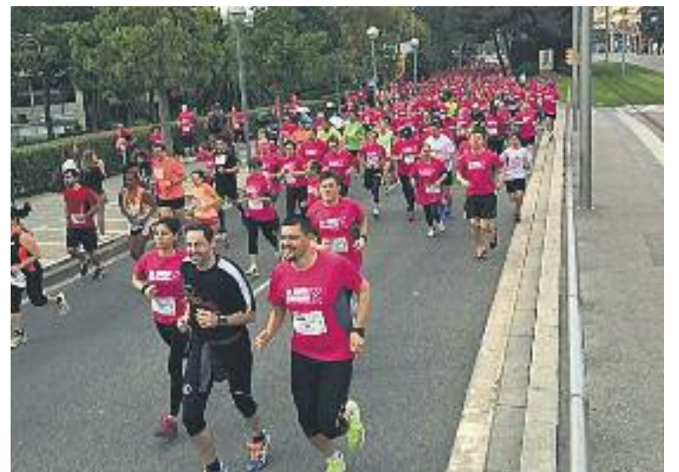
Gairebé 1.400 persones van participar a la cursa.

La cursa d'enguany va tenir un caràcter solidari i inclusiu, treballant accions de suport al programa Hospital Amic de l'Hospital Sant Joan de Déu. Després de la cursa es va retre un homenatge a tots aquells participants amb discapacitats físiques, psíquiques o sensorials. A més, els guanyadors de les diferents categories van rebre, juntament amb el seu trofeu, una polsera "candela" feta a mà pels nens i nenes ingressats a l'hospital.