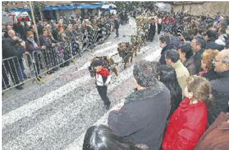
Els carrers de la ciutat acolliran la cercavila de cavalls.

Durant tres dies, doncs, se celebrarà un conjunt d'activitats entorn dels Tres Tombs. Els dies 8, 9 i 10 de maig s'instal·larà un