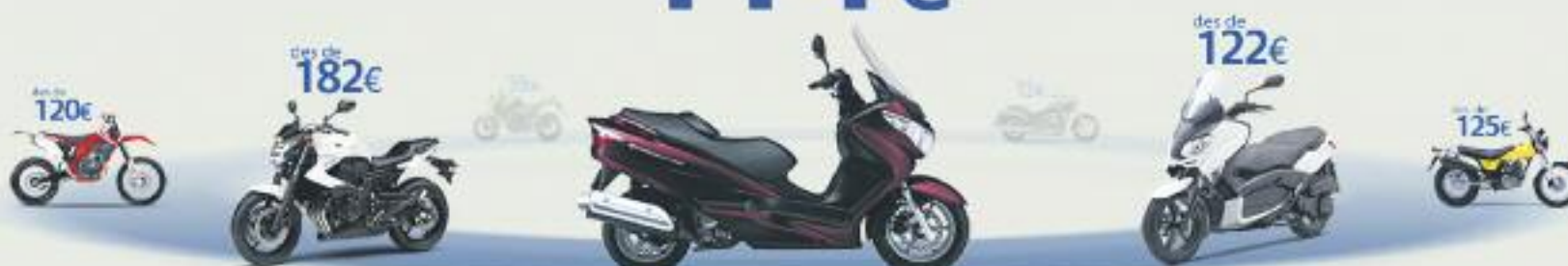
Suzuki Burgman 200. Preu anual orientatiu amb bonificació.

TERCERS AMB ASSISTÈNCIA EN VIATGE des de 114€