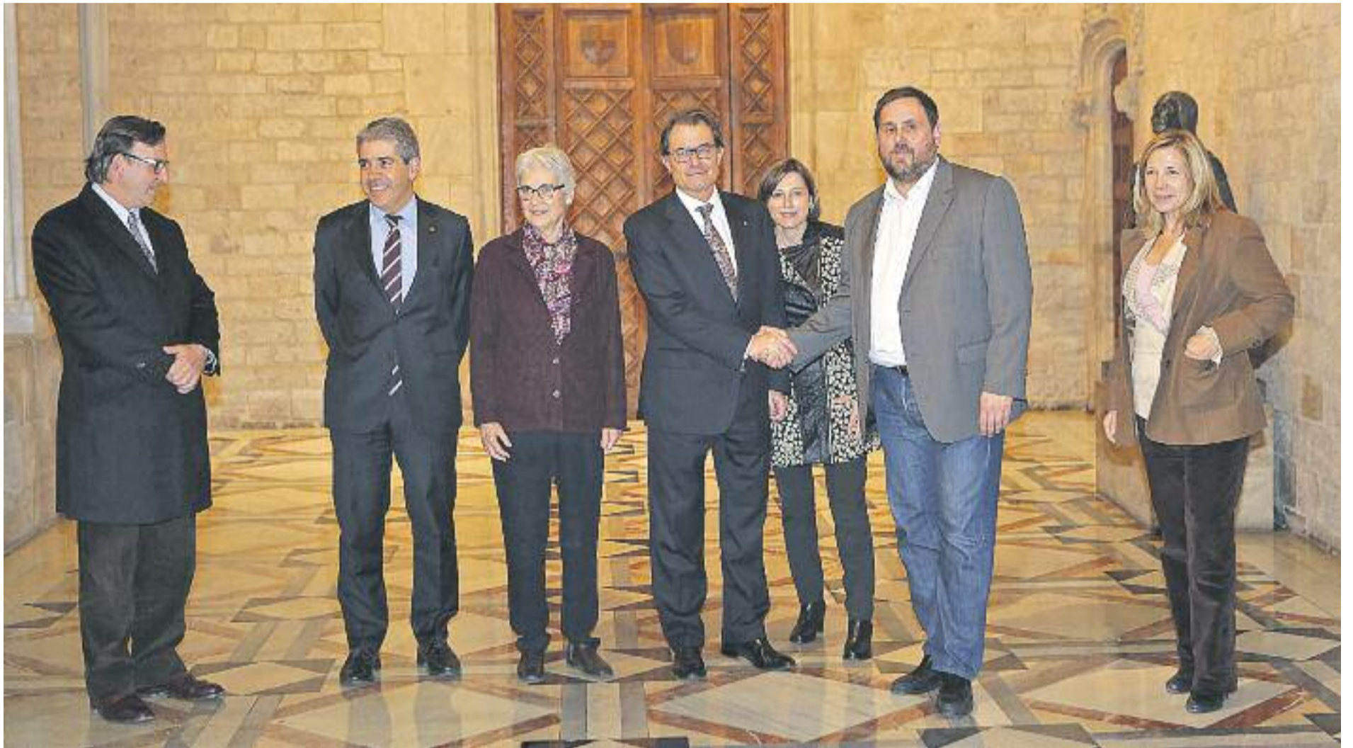
Mas i Junqueras van tornar a protagonitzar una imatge d’entesa el passat dimecres 14 de gener.

» Mas i Junqueras refan la unitat “per portar el procés de transició nacional fins a la victòria” » L’acord prioritza la creació d’estructures d’Estat des d’ara fins a les eleccions del 27 de setembre