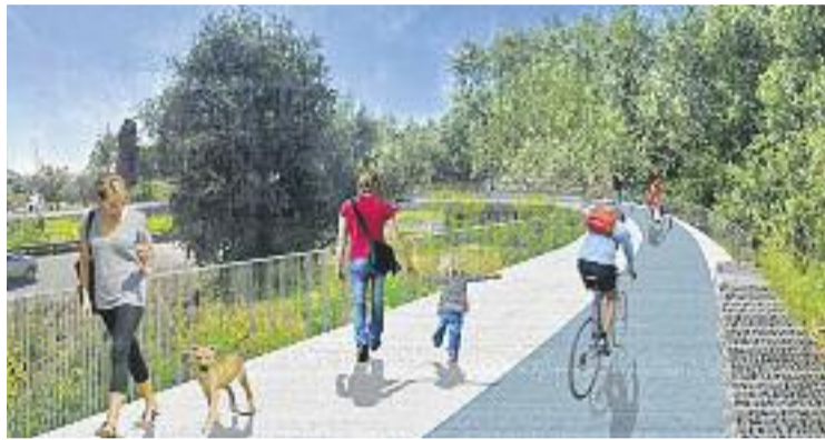
La prolongació de la Diagonal comença a fer les primeres passes.

Segons va assegurar Poveda fa unes setmanes, el conseller i la ministra han demostrat "pre-disposició" per reunir-se i hi ha