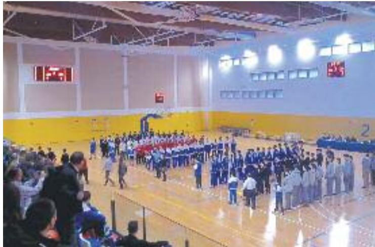
La presentació dels equips abans de la final.

Els espluguins es van imposar a l'UCAM Múrcia a la fase de grups, però no van poder superar l'Hapooel Tel Aviv israelià en