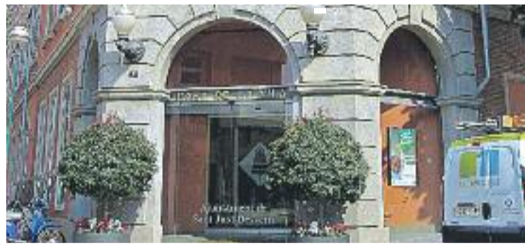
Els comptes municipals ascendeixen als 24,8 milions d'euros.

A més d'això, l'Ajuntament es reserva dos milions d'euros per recuperar les inversions locals.