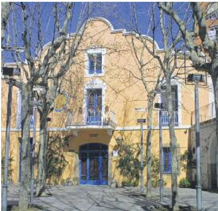
Edifici del Casal de Cultura Robert Brillas.