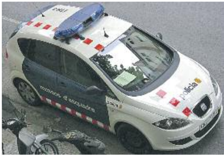
El presumpte homicida va ser detingut pels Mossos al lloc dels fets.