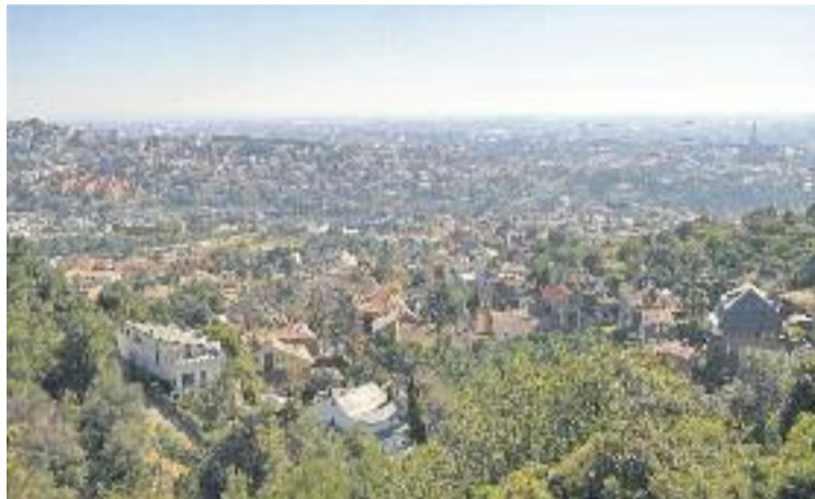
Sant Just és el quart municipi on l'esforç és més gran.

Segons l'informe, Sant Just és un dels municipis de tot l'Estat on la proporció entre la renda dels residents i els preus de l'habitatge és més elevada. També és l'única de les quinze primeres poblacions de l'Estat en aquest rànquing que no es troba en un lloc costaner d'interès turístic, on els preus dels habitat-