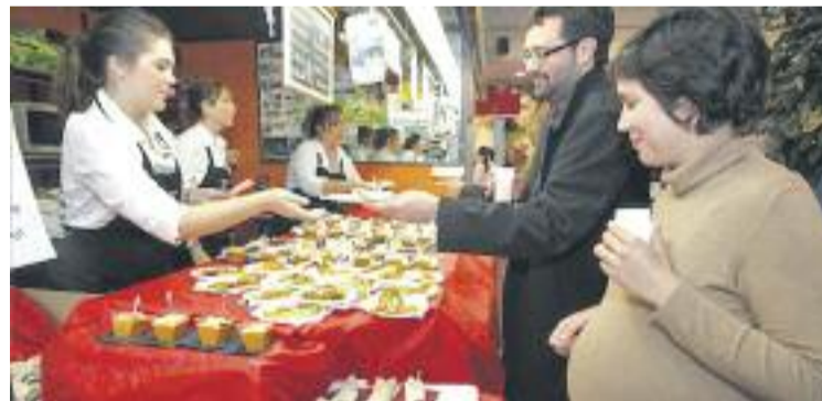
Nit de Degustació al mercat del Centre de Sant Joan.

A Sant Just Desvern, per exemple, gairebé una norantena de comerciants van sortir al carrer durant el cap de setmana del 20 i 21 de desembre per mostrar els seus productes durant la celebració de la Fira de Nadal a la localitat. Paral·lelament, es van programar diverses activitats, com un Tió de Nadal per als més petits i un trenet que reco-