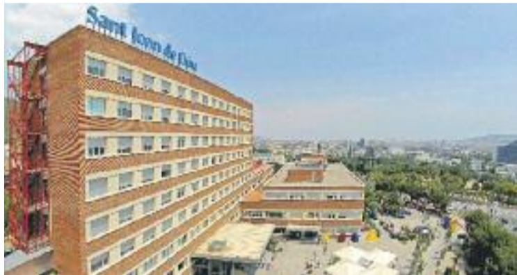
La plantilla seguirà organitzant protestes cada setmana.

A l'hospital, que és de caràcter privat però té finançament públic –està integrat en la Xarxa Pública d'Hospitals Catalans (XHUP)– hi treballen dues mil persones i s'hi fan unes 22.000 intervencions mèdiques cada