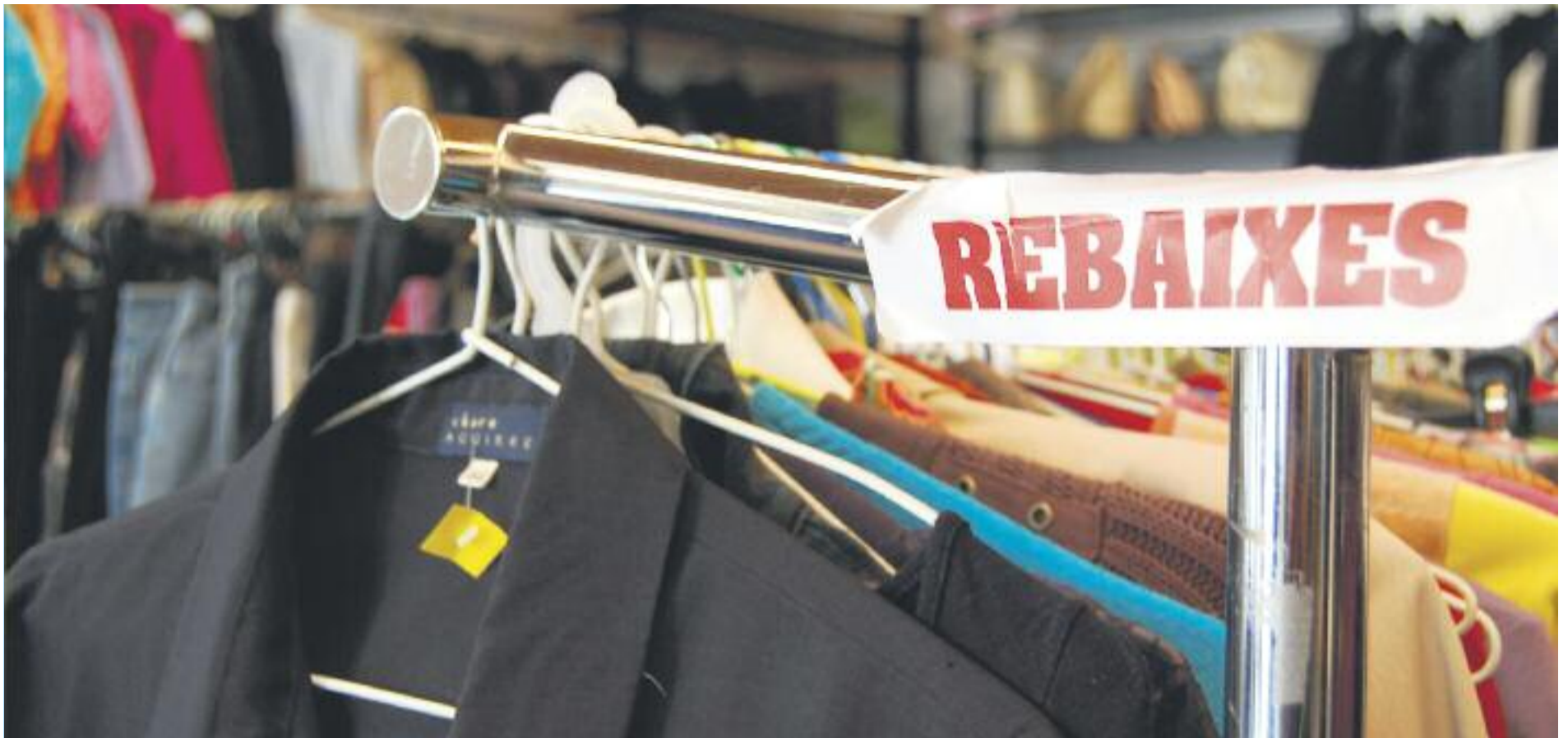
El comerç preveu una facturació de 825 milions d'euros durant les rebaixes d'hivern.