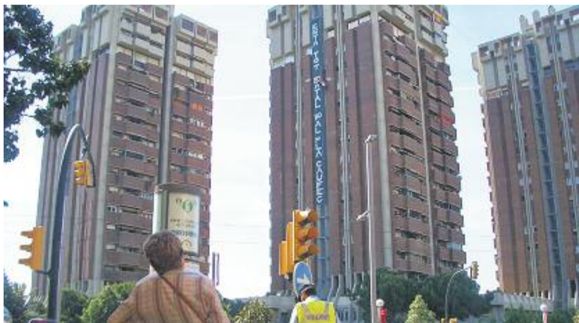
Una protesta contra el Pla Caufec en un edifici.

» La sentència diu que "les agressions a agents, els actes vandàlics, altercats i desobediències" no es poden acreditar