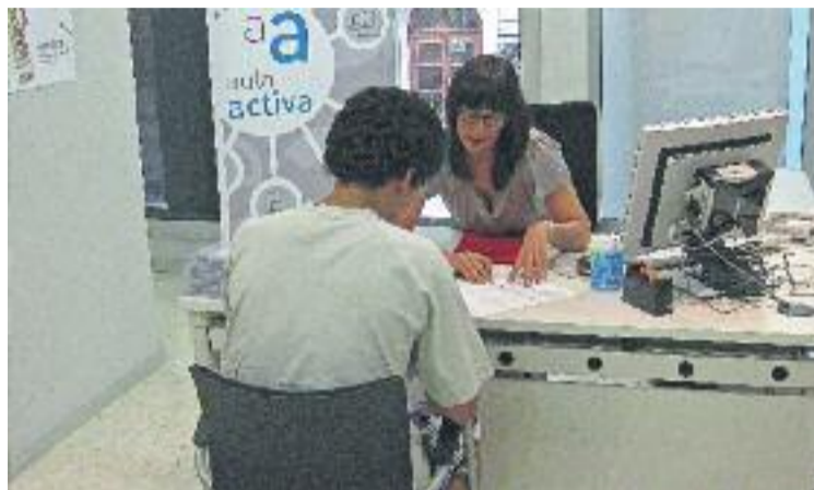
Una oficina de treball on s'ofereix orientació laboral.

Tot i augmentar el nombre d'assalariats, la contractació de