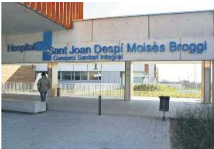
La formació ha estat impartida per personal del Moisès Broggi.