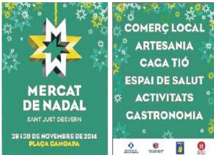
Cartell del mercat de Nadal de Sant Just.

Durant les dues jornades també s'han organitzat activitats familiars adreçades als més pe-