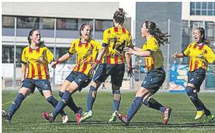
La sots 16 va proclamar-se campiona estatal la temporada passada.

Les noies de Natàlia Arroyo i Lluís Cortés comparteixen grup amb les seleccions de Castella i Lleó i d'Extremadura. Primer serà el torn de la selecció sots 16, que jugarà el pròxim divendres 19 de desembre contra Castella i Lleó a les 10 del matí. Seguidament, a les 12, les sots 18 ju-