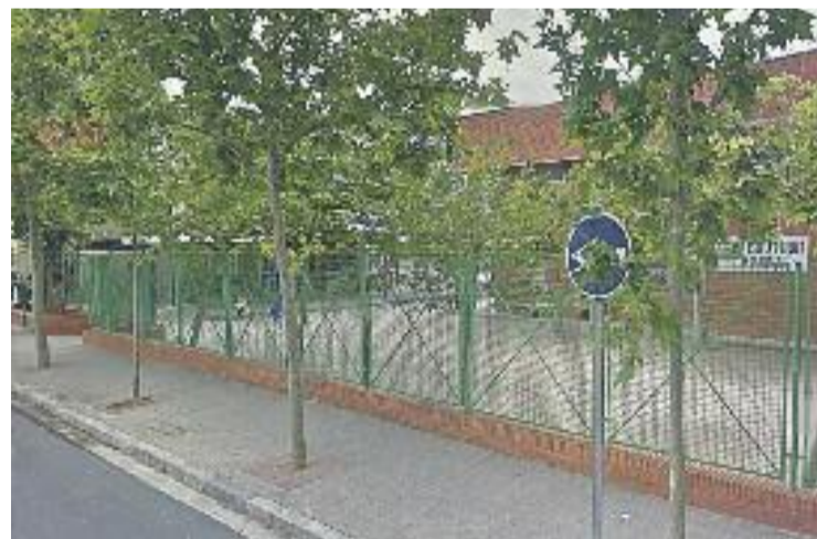
L'escola Folch i Torres ha participat en el projecte.

En el marc del mercat de Nadal, dissabte 29 de novembre es fa fer l'encesa de l'enllumenat nadalenc, acte que va anar acompanyat d'una obra de teatre de l'associació Amics del barri Sud.