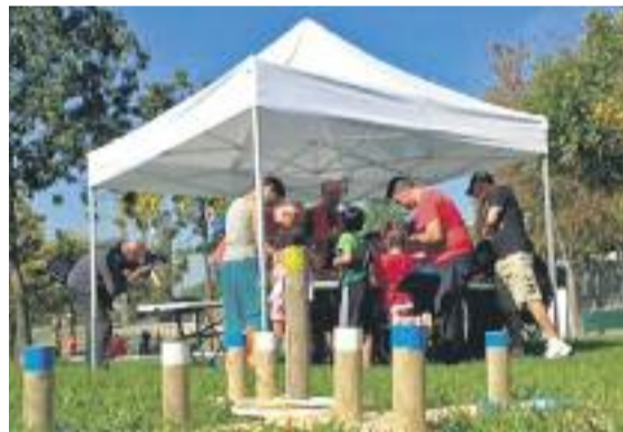
El parc acull activitats familiar els diumenges des de fa unes setmanes.