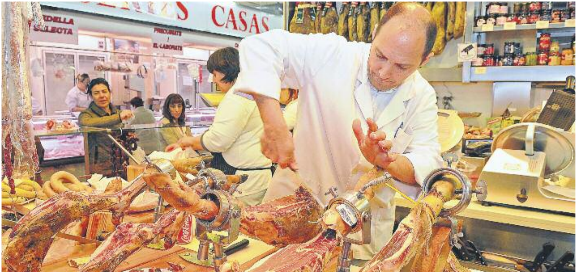
El sector comercial preveu un augment de la contractació d'entre el 2 i el 3%.