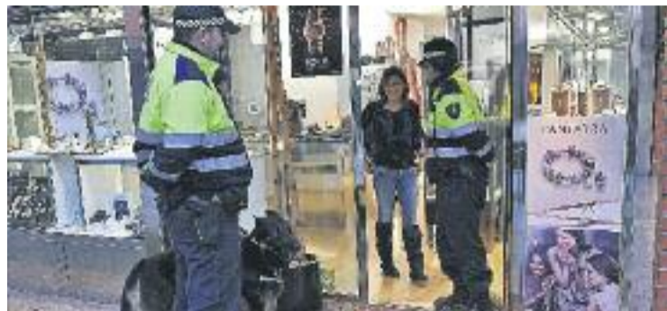
Agents locals patrollen amb una unitat canina.

TECNOLOGIA ▶ Esplugues s'ha adherit a la xarxa de seguretat ciutadana interterritorial que s'ha posat en marxa gràcies a una aplicació mòbil. Es tracta d'un sistema que es porta a terme per primera vegada a Europa i permet als usuaris comunicar qualsevol incidència en matèria de seguretat o via pública i ser atès per