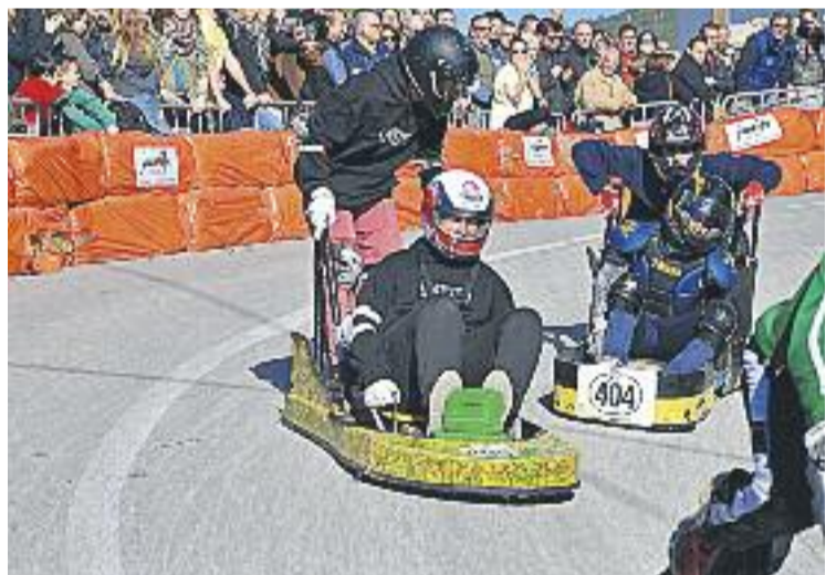
La Cursa de karts va comptar amb 120 participants.