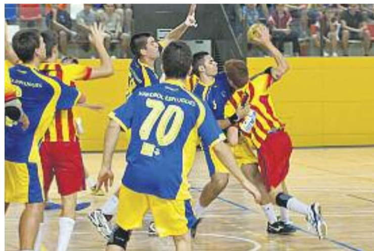
Una imatge del torneig de l'any passat.

La competició estarà dividida en quatre grups formats per tres equips cadascun. El primer grup estarà format pel FC Barcelona, la UE Sarrià i l'OAR Gràcia; el segon el formen el Sant Martí, l'AE Carles Vallbona i el combinat català cadet masculí; al grup tres jugarà l'Handbol Granollers, l'Handbol Bordils i l'Esplugues 'B'; mentre que en l'últim grup s'enquadren l'Esplugues 'A', el Gavà i l'Ahrensburg alemany.