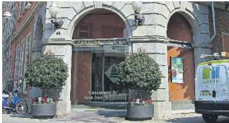
Entrada de l'edifici de l'Ajuntament de Sant Just.