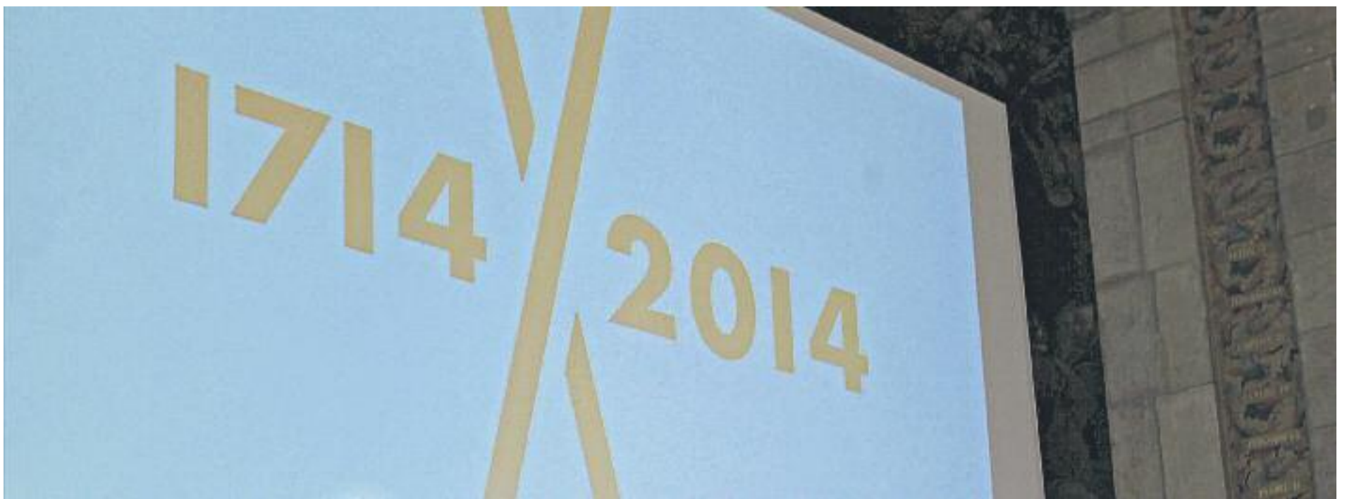
Un moment de la presentació del Tricentenari, durant el qual s'han programat actes commemoratius al llarg de tot aquest any.