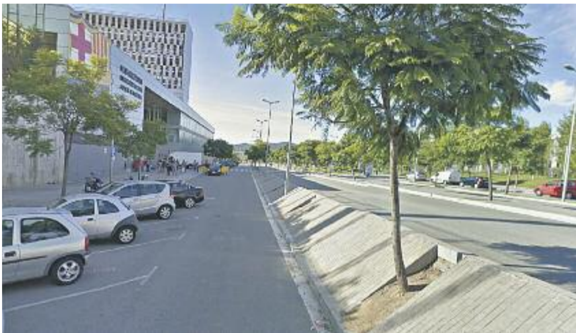
Aspecte de l'avinguda que ha estat batejada amb el nom d'Onze de Setembre.