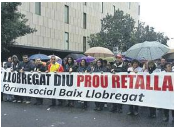
Una de les manifestacions del Fòrum Social del Baix Llobregat.

L'entitat comarcal denuncia llistes d'espera "interminables", el tancament de llits i quiròfans, situacions de col·lapse a les urgències hospitalàries, acomiada-