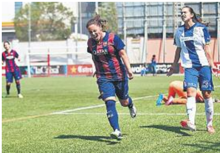
El Barça empata a copes amb l'Espanyol, amb un total de 5.