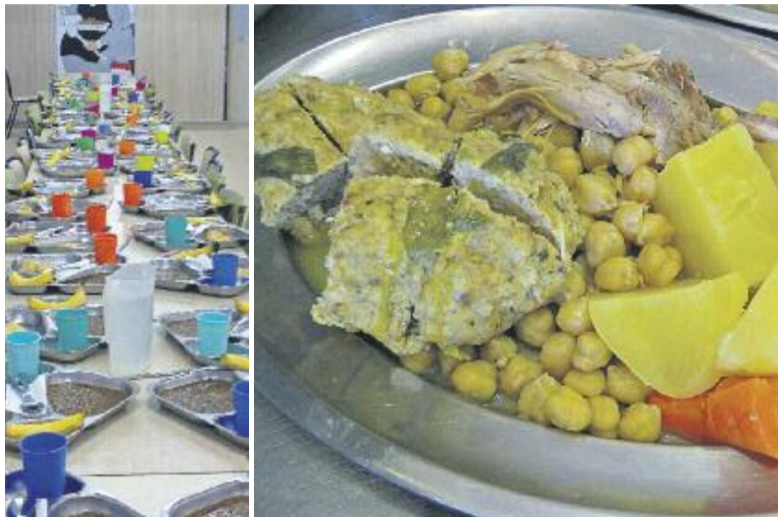
Els nens i nenes d'Esplugues han gaudit d'un àpat diari al casal infantil d'estiu.

» L'Ajuntament ha augmentat aquest any un 7% els recursos destinats a beques per als casals d'estiu, que inclouen menjador