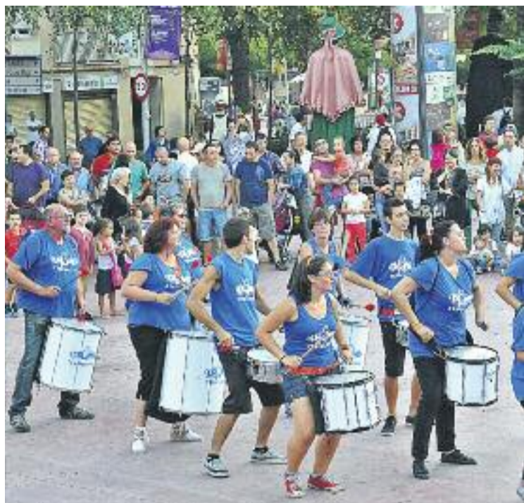
Un dels actes de la Festa Major d'Esplugues.