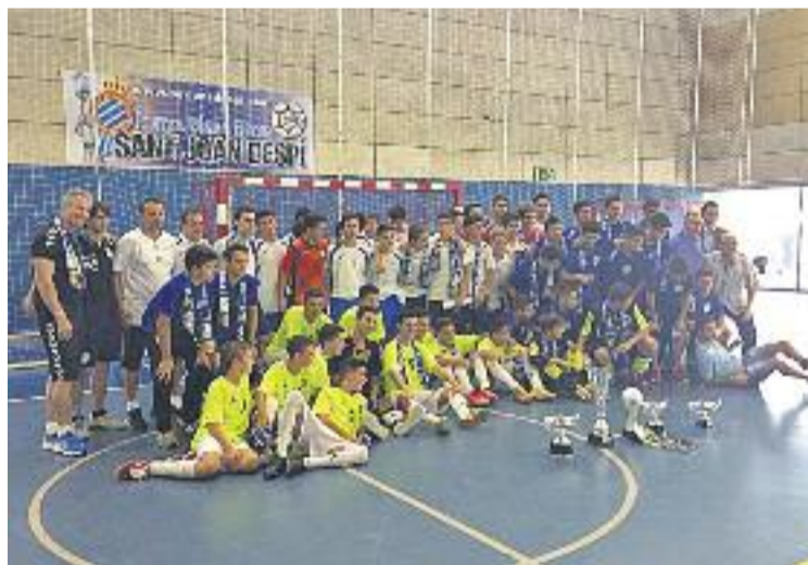
El Marfil Santa Coloma va endur-se el catorzè Joan Babot.