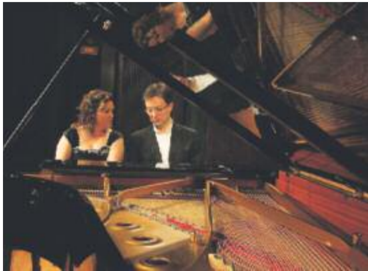
Els integrants de Nexus Piano Duo.

"Per exemple, han agafat les peces de caire religiós de J.S. Bach i les han convertides a l'estil gospel", ha destacat el president de l'entitat organitza-