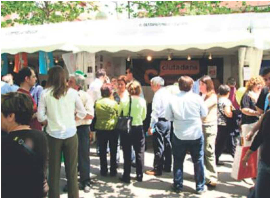
Visitants davant dels estands de Firesplugues.

» La mostra és una gran oportunitat per a dinamitzar econòmicament la ciutat i afavori la cohesió social