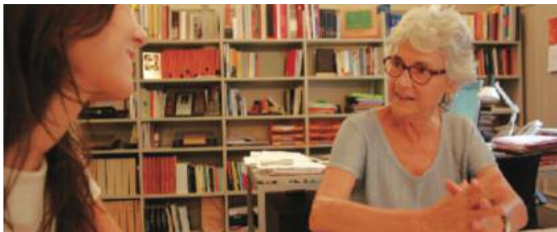
Muriel Casals, presidenta d'Òmnium Cultural.

» L'entitat organitza el cicle Dijous a l'Òmnium de Primavera » La iniciativa pretén difondre la Campanya pel sí a la comarca