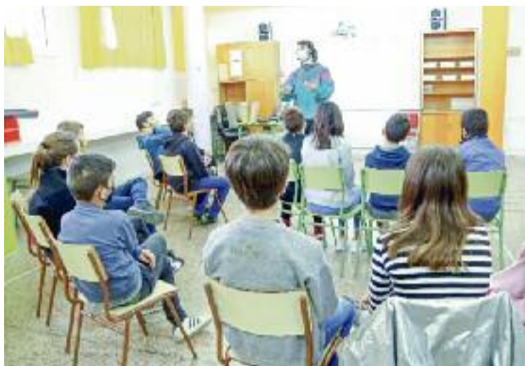
Les classes, en grups reduïts i amb mascareta.

Si els casos de coronavirus pujaven a la comunitat, als centres també. Per això, el moment amb més grups confinats va ser