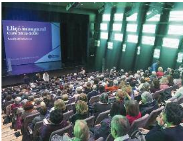
Lliçó inaugural del curs 2019-2020 de l'Escola de la Dona.