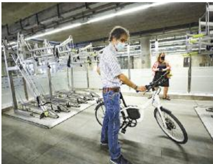
Un dels nous aparcaments de bicicletes ubicats al metro.