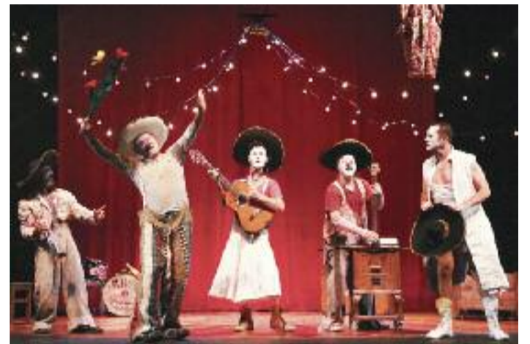
Actors de l'obra 'Gran reserva', al Teatre Borràs.

Però aquesta no és l'única iniciativa cultural. El Departament de Cultura i el Consell Nacional de la Cultura i de les Arts, creadors del Cens d'Artistes, també estan treballant en la creació del cens de tècnics i gestors culturals i en el de les entitats, institucions i empreses de la cultura. Per donar-los a conèixer tots tres, pròximament es faran actes culturals arreu de Catalunya.