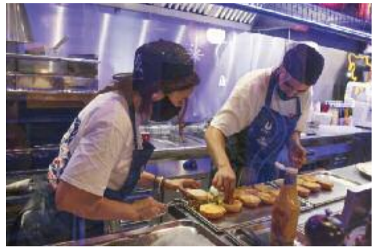
Dos treballadors d'un restaurant amb mascareta.

versió d'empreses catalanes en àmbits com la sostenibilitat, el medi ambient, la innovació o la digitalització de l'economia. En aquest sentit, la Generalitat també ha apostat per millorar les condicions del recurs, allargant el termini de tornada dels crèdits de cinc a deu anys i ampliant la carència fins a un màxim de dos anys. Aquestes modificacions també estaran disponibles per a totes aquelles companyies i autònoms que ja siguin beneficiaris d'un préstec ICF Crèdit Covid 19, de manera que es podrà pactar un refinançament d'operacions vigents per adaptar-les als nous canvis.