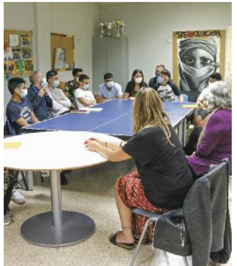
S'abordarà específicament la salut mental.

Per a la consellera de Drets Socials, Violant Cervera, l'increment de famílies en situació de pobresa i risc d'exclusió social provoca que infants, adolescents i joves passin a ser els grups de població "més afectats per les conseqüències" de la crisi desencadenada per la pandèmia.