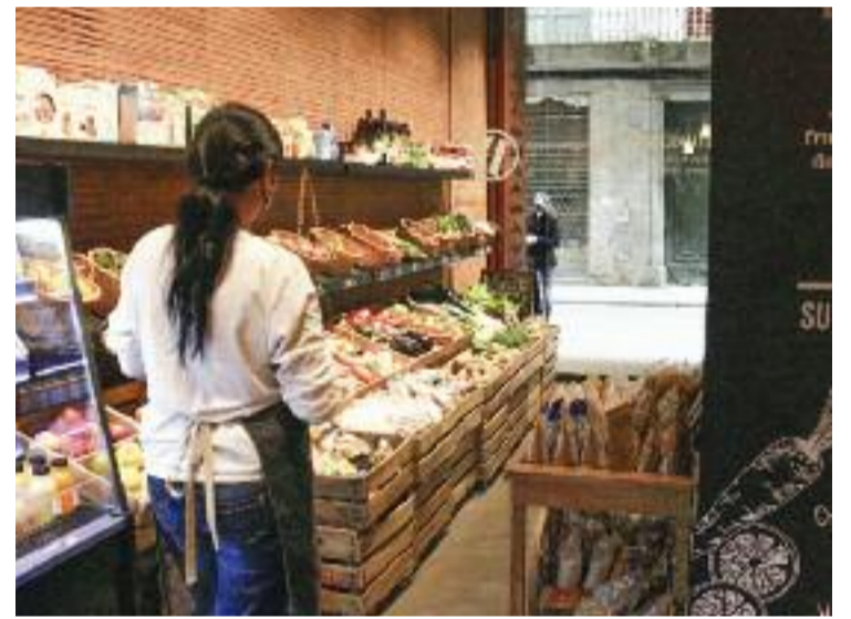
La dependenta d'una botiga en una imatge d'arxiu.

ministeri d'Indústria, Comerç i Turisme del govern espanyol des d'on es pot fer la tramitació per constituir les formes jurídiques més habituals de manera telemàtica i gratuïta. Repartits per la demarcació de Barcelona hi ha 45 d'aquests punts d'atenció, on els interessats poden gestionar d'un sol cop fins a 22 tràmits i crear l'empresa en només 48 hores. Segons les dades facilitades per la Diputació, durant la primera meitat del 2021, la de Castelldefels ha estat la seu on s'han registrat més altes de l'àrea metropolitana.