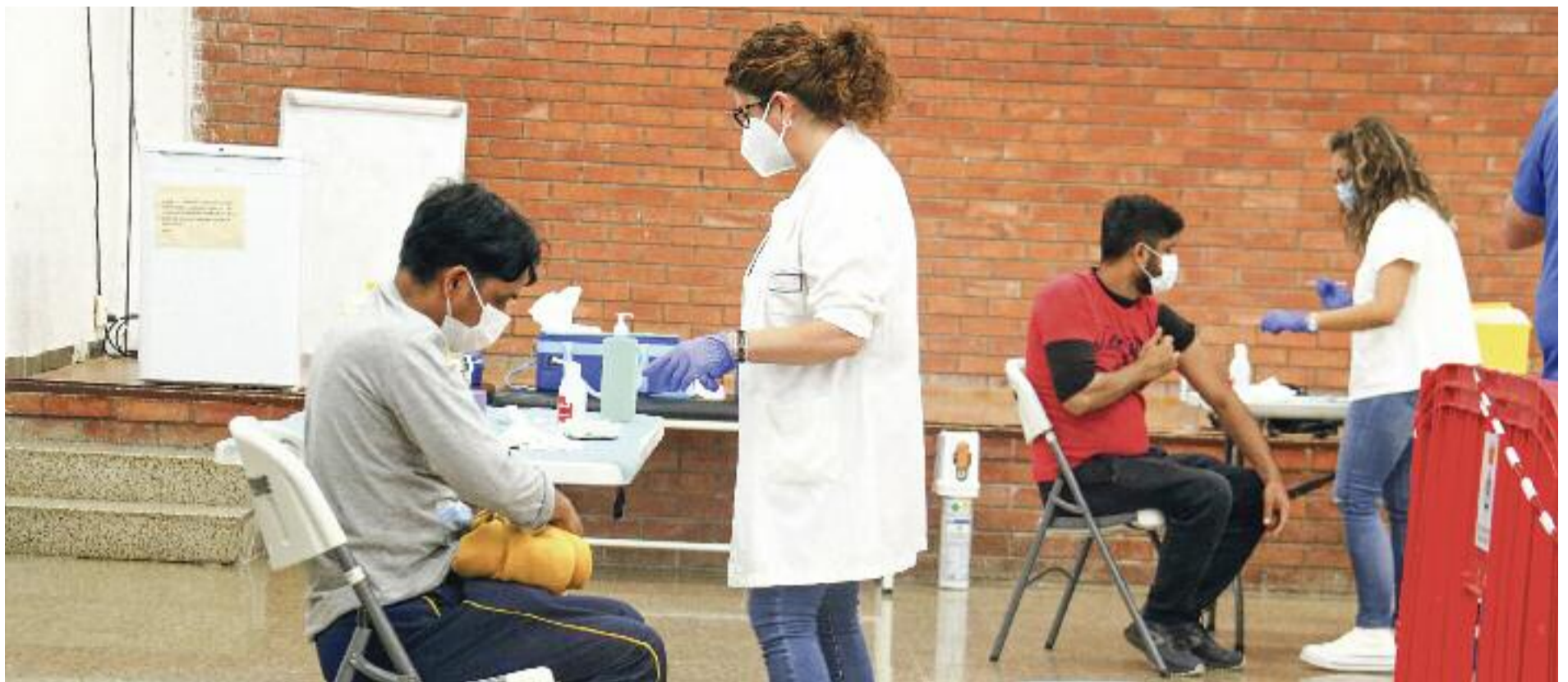
Ja s'han injectat més del 90% de dosis rebudes des de l'inici del procés de vacunació.