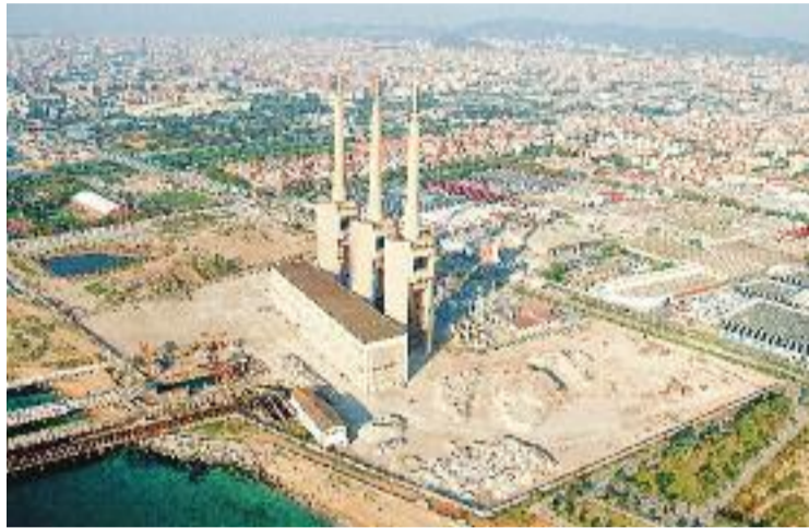
El 'hub' a les Tres Xemeneies és un dels projectes que opta als fons.