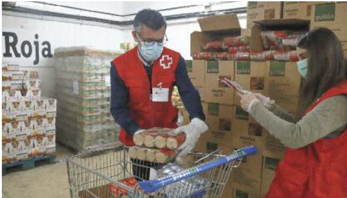
El departament de Drets Socials considera la pobresa "un problema multifactorial".

» El Govern aposta per aplicar "accions coordinades" amb les entitats » L'objectiu és millorar la qualitat de vida dels més vulnerables