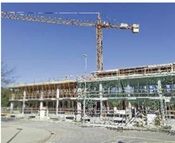
Es vol quintuplicar el pressupost de l'Agència de l'Habitatge.