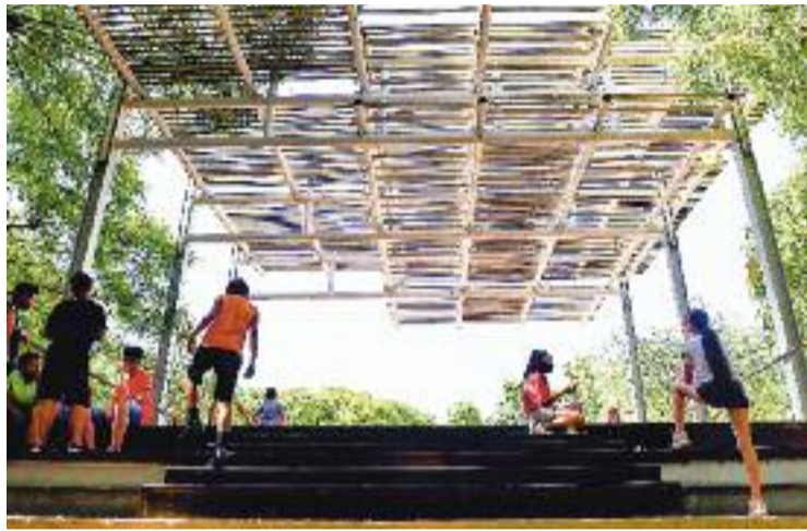
No tots els parcs poden ser considerats refugis.

De moment n'hi ha una vintena als set municipis que formen el grup motor de la xarxa, que són l'Hospitalet, Cornellà, Castelldefels, Viladecans, Sant Boi, Montcada i Reixac i Badia del Vallès. Però des de l'AMB esperen que