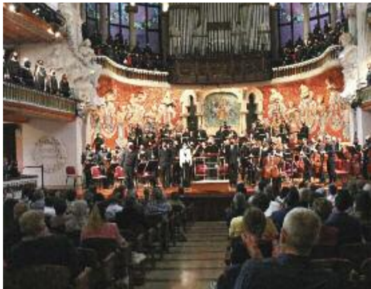
El Palau de la Música durant un concert.

Mentrestant, aquells qui vulguin demanar diners per recuperar-se dels efectes de la Covid-19, hauran d'acollir-se a les con-