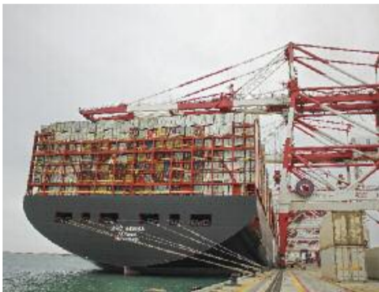
Un vaixell amb contenidors atracat al port barceloní.