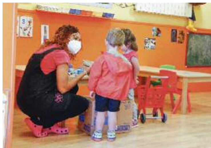
Professora i dos infants a una escola bressol.

Mentrestant, la trobada de les escoles de música va girar, sobretot, al voltant de la importància de fer les classes presencials. Precisament per això, perquè la pandèmia ho ha impedit, la nota va quedar un pèl més baixa, en un 8,1. Un notable alt que remarca la feina d’ambdós tipus de centres, tot i les dificultats que els ha posat la situació epidemiològica.