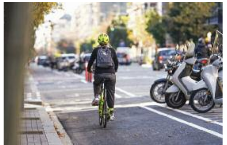
Una dona circula per un dels carrils bici de Barcelona.

Tots tres congressos inclouran espais d'exposició, trobades entre professionals, visites tècniques i activitats a l'espai públic, amb l'objectiu de reivindicar el protagonisme de la bicicleta i refermar el compromís de les institucions i la ciutadania per fomentar-ne l'ús. La iniciativa neix de la suma d'esforços entre la Generalitat, l'AMB, l'Ajuntament de Barcelona i la Diputació.