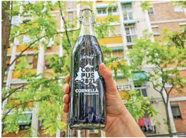
El vermut del Corpus de Cornellà Actitud.

També ho pensen al Celler de la Consol, que s'han sumat a la campanya del Corpus d'aquest any distribuïnt les ampolles per omplir-les del vermut de la Fes-