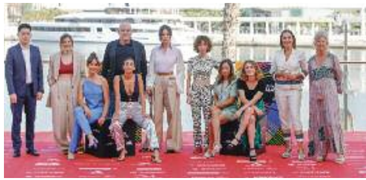
L'equip de 'Chavalas' al Festival de Màlaga.

Les dues germanes, que fins als 12 anys van viure al barri de la Gavarra, s'han hagut d'enfrontar als prejudicis de molta gent al saber que són d'una ciutat d'extraradi. De fet, alguns d'aquests barris, diu Rodríguez, "han quedat estigmatitzats" per algunes pel·lícules del cinema quinquè dels 80 o pel cinema social. La directora no nega que "existeixin situacions dures" en aquestes zones, moltes d'elles heretades "per tal com es van construir" els barris, però