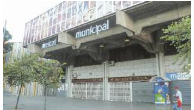
Les concessions s'acaben el 31 de desembre.

Com a mesura de pressió, s'ha iniciat una recollida de firmes que ja ha aconseguit més de 3.000 signatures a través d'internet. Des de l'Ajuntament expliquen que les negociacions continuen obertes i que han fet una nova proposta als paradistes.