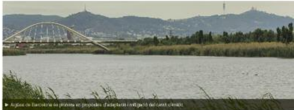
► Aiguës de Barcelona en pleïna en propostes d'adaptació i mitigació del canvi climàtic

La ràpida pèrdua de biodiversitat requereix respostes immediates. Per això, la celebració del Dia Mundial del Medi Ambient marcarà el llançament del Decenni de les Nacions Unides (ONU) per a la Restauració d'Ecosistemes 2021-2030. Es tracta d'un pla d'urgència per protegir i revertir els danys fets a la natura abans del 2030, data límit per evitar els pitjors impactes del canvi climàtic.