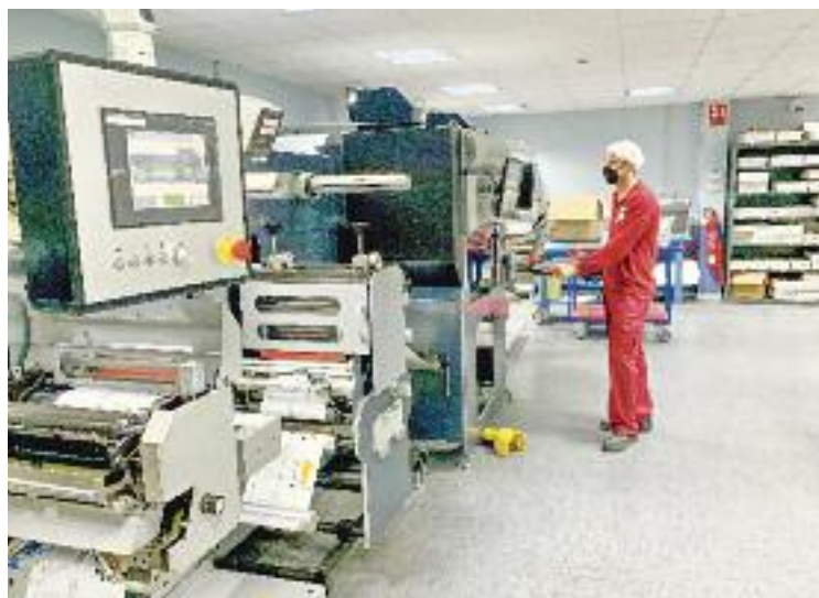
La companyia incorpora un nou sistema per reduir les emissions.

De fet, a diferència dels sistemes més tradicionals, la nova màquina incorporada per l'empresa cornellanenca només fa servir la quantitat precisa de metall que fa falta per crear la imatge metàl·lica. Això permet millorar la sostenibilitat de les etiquetes i reduir fins a cinc ve-