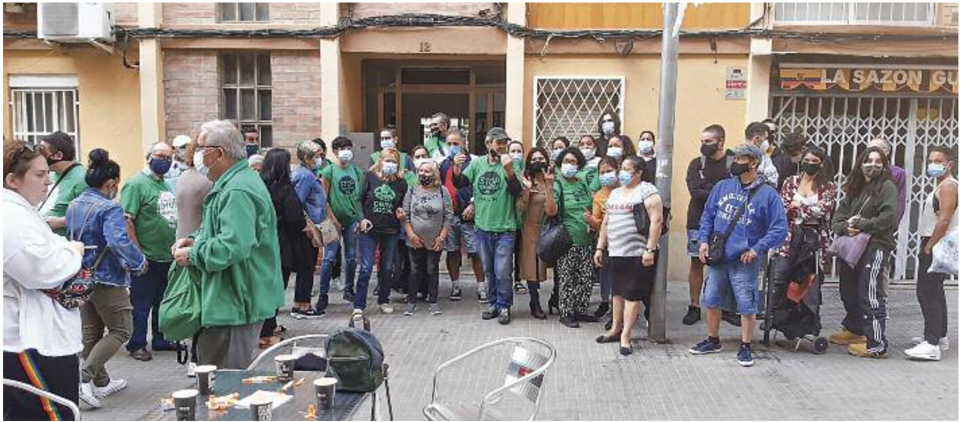
La pandèmia ha augmentat els casos de persones que tenen problemes per pagar el seu habitatge atesos per la PAH.