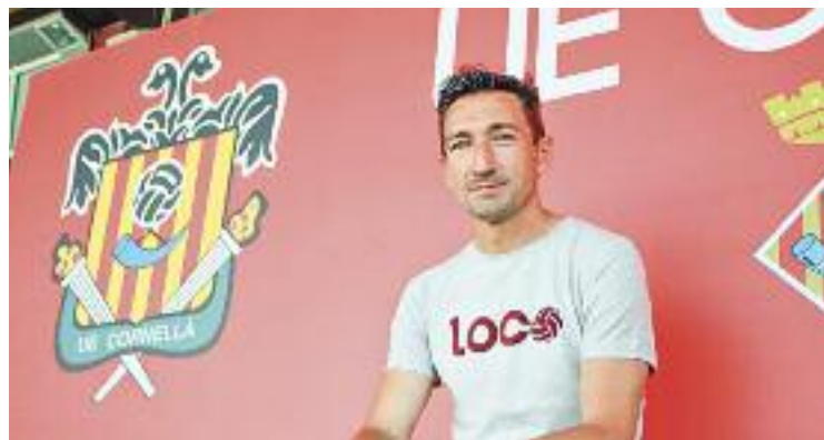
El tècnic ja coneix l'Estadi Municipal per dins.

Un dels trencaclosques que haurà de solucionar és el de la