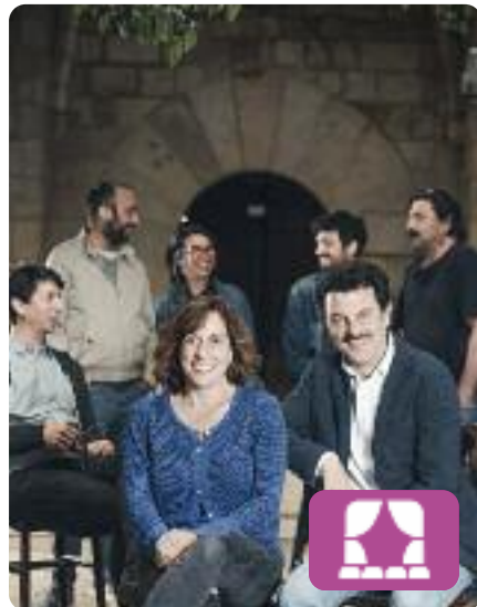
Filumena Marturano Eduardo de Filippo

Després de 25 anys de viure mantinguda per Domenico Soriano i múltiples negatives a casar-se amb ella, Filumena Marturano fingeix una greu malaltia per aconseguir que Domenico accepti contraure-hi matrimoni. Un cop casats, s'aixeca del llit fresca com una rosa. Oriol Broggi adapta el clàssic d'Eduardo de Filippo. Al Teatre Biblioteca de Catalunya.