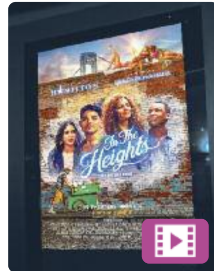
En un barrio de Nueva York Jon M. Chu

In the Heights (que s'ha estrenat als nostres cinemes amb el títol En un barrio de Nueva York ) està basada en el musical de Broadway homònim, que se centra en un grup de veïns del barri novaiorquès Washington Heights. Els protagonistes són el propietari d'un celler, la seva àvia, la noia de qui està enamorat i una vella amiga seva que torna després de molt de temps.