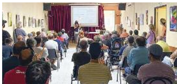
La presentació va omplir el Patronat.

ENTITATS ▶ La plataforma Ribera-Salines va omplir el Patronat en l'acte de presentació que va celebrar el 12 de juny. De fet, l'assistència va superar les expectatives dels organitzadors i va deixar molts assistents a fora de la sala, limitada per les mesures sanitàries de la Covid. Per això, l'entitat ja es planteja fer més actes d'aquest tipus per explicar el seu projecte per defensar l'última zona natural i agrícola de la ciutat. De moment, el suport els anima a seguir treballant per explicar què suposaria per a