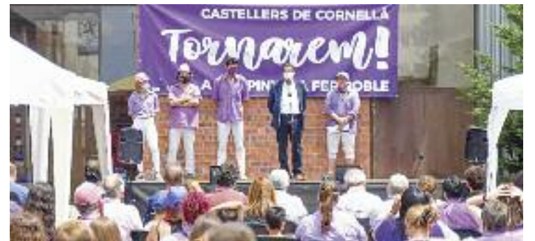
Moment de l'acte institucional pel 30è aniversari.

Reconeix que la pandèmia ha estat una "batzegada", però afegeix que "hi ha moltes ganes" de tornar a aixecar castells. Per això vol esperar a tornar als assajos per veure "la força de la colla". Així i tot es mostra tranquil i assegura que podran mantenir el "nivell mitjà-alt" que ha definit la colla durant trenta anys.