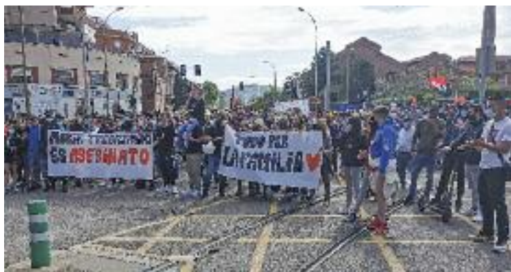
S'ha convocat una nova protesta a la ciutat.

Representants d'Empresa i Treball també van mantenir una reunió amb UGT FICA el 18 de juny. Des del sindicat expliquen que en la trobada van denunciar