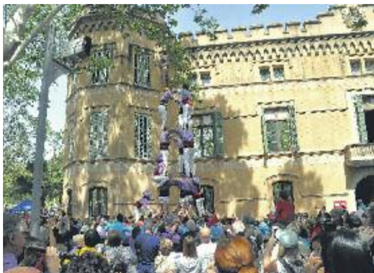
Els Castellers de Cornellà, presents a la festa.

El dia gran va ser el 22 d'abril, però les activitats de la Jordiada s'allargaran fins al 9 de juny, amb l'exposició i lliurament dels premis del Concurs de Fotografia i del '3Quem. Abans, el dia 26 d'abril en concret, hi haurà una conferència sobre Pau Claris a la biblioteca Marta Mata, a partir de les set de la tarda, mentre que el dia anterior hi