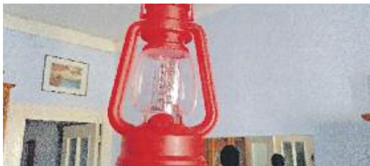
La família ha estat 40 dies sense electricitat.

Han estat 40 dies de travessia pel desert que havien generat un "desgast físic i psicològic" en la família, segons explica Pablo A. a aquesta publicació. El jutjat considera que la decisió d'Endesa de tallar la llum a aquesta família de Riera suposa "un acte de pressió" i que hi ha un termini "suficient" perquè l'empresa i el veí "solucionin la seva contro-