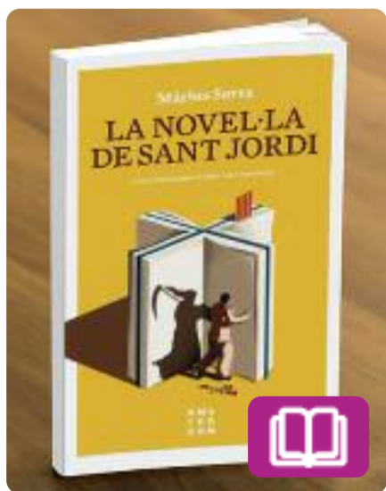
La novel·la de Sant Jordi Màrius Serra

Ambientada en el primer Sant Jordi d'una República Catalana, Serra ofereix un retrat satíric del món editorial on una sèrie de crims tenyeixen la diada en un bany de sang.