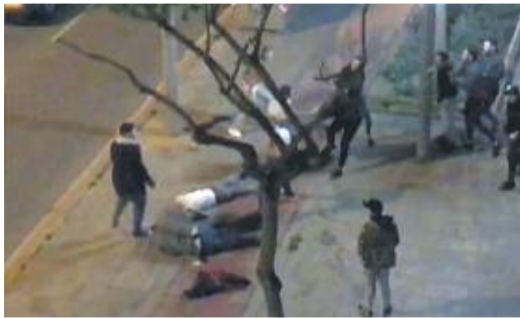
Una imatge de la baralla salvatge.

El grup d'agredits és natural del barri gavanenc de Ca n'Espinós i és d'ètnia gitana. Els agressors, per la seva banda, formarien part de l'entorn dels Casuals de Boixos Nois, els últims més radicals del FC Barcelona, segons publiquen diversos mitjans. Els Mossos estan in-