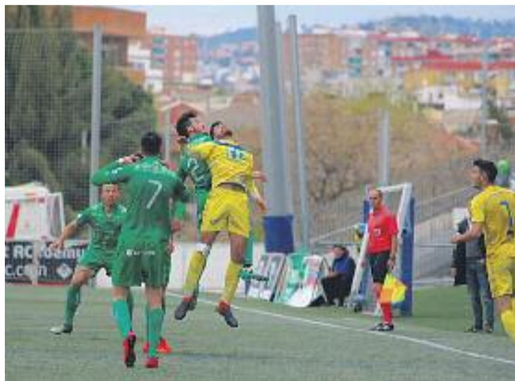
Un moment del partit contra el CF Badalona.

L'únic aspecte positiu que va tenir aquesta jornada va ser que l'únic perseguidor del Cornellà