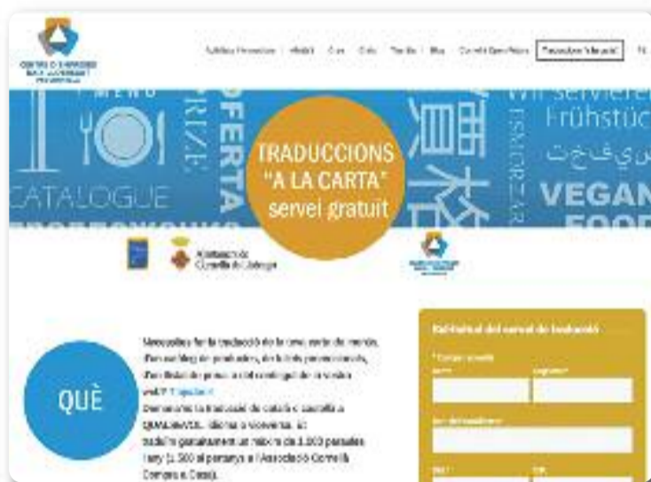
El web de traduccions a la carta.

D'aquesta manera, els negocis podran enviar qualsevol material que tingui a veure amb la seva activitat i rebre'n una còpia en qualsevol idioma. Aquesta iniciativa compta amb la col·laboració de Cornellà Compra a Casa i vol servir per promoure i dinamitzar el comerç de proximitat i el mitjà negoci, els principals motors de l'activitat diària a la ciutat.