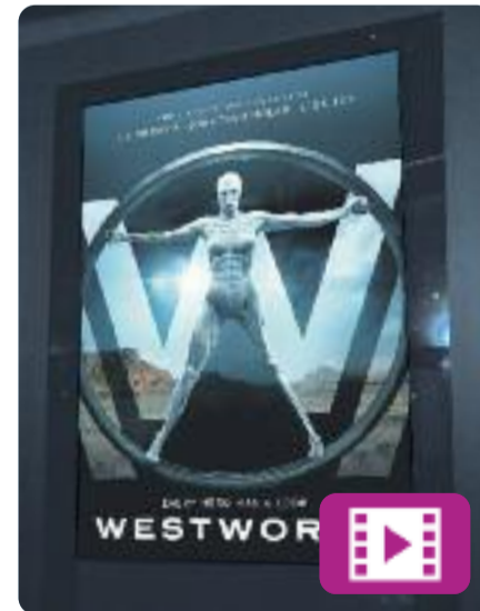
Westworld Jonathan Nolan i Lisa Joy

La segona temporada de Westworld , un dels darrers grans èxits d'HBO, ja s'ha començat a emetre.