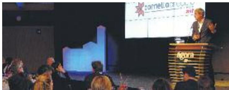
Un moment de la conferència a la ciutat.

POLÍTICA ► L'expolític basc i escriptor Kepa Aulestia va defensar el dia 16 al Cornellà Creació Fòrum un fre a l'espiral de tensió en la qual viu Catalunya. "És necessari trobar una sortida", va dir, ja que, "quan ni tan sols es busca aquesta sortida, el problema s'enquistia i es gangrena", va afegir.