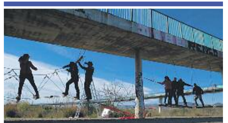
MEDI AMBIENT ▶ La llera del Llobregat va tornar a ser l'escenari de la tradicional Festa del Riu, que busca conscienciar els veïns i veïnes sobre el valor del riu i la necessitat de preservar-lo.

Aquesta iniciativa compta amb el suport de l'Ajuntament i de l'Àrea Metropolitana de Barcelona (AMB). De fet, aquest últim ens ha posat en marxa un pla de reindustrialització i activació econòmica de l'àrea metropolitana en el qual es destaca el Citilab com a exemple d'espai d'innovació.