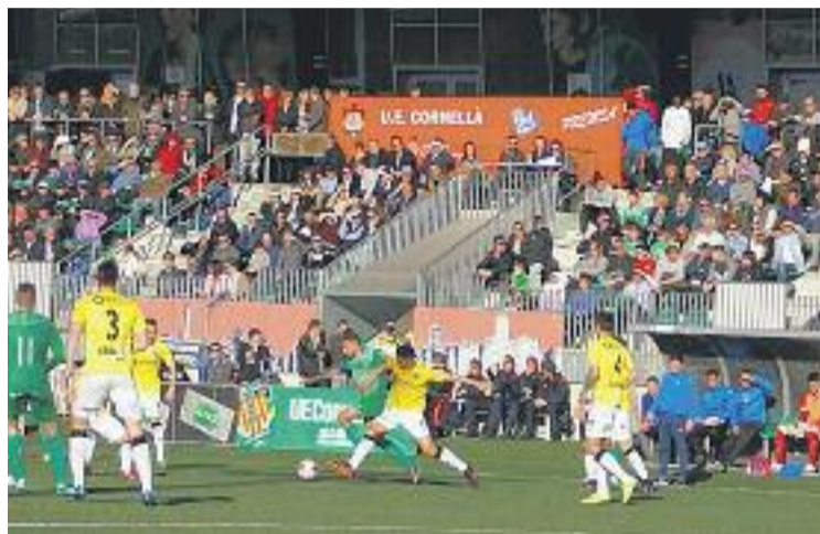
Un moment del partit, que va guanyar el Cornellà per la mínima.

El mateix dia, el Cornellà va emetre un comunicat expressant una "total disconformitat amb els fets esdevinguts al túnel de vestidors". El club també "lamenta i condemna la sèrie d'improperis, ofenses abocades i actes físics entre membres de les dues entitats" que va deixar en segon pla "la imatge d'esportivitat donada pels dos equips sobre la gespa i per les dues aficions".