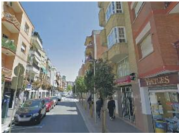
A Cornellà hi ha 1.178 botigues.

El cens d'enguany assenyala que la superfície de venda de la ciutat –el que sumen totes les botigues plegades– és de 191.532 metres quadrats. En concret, la