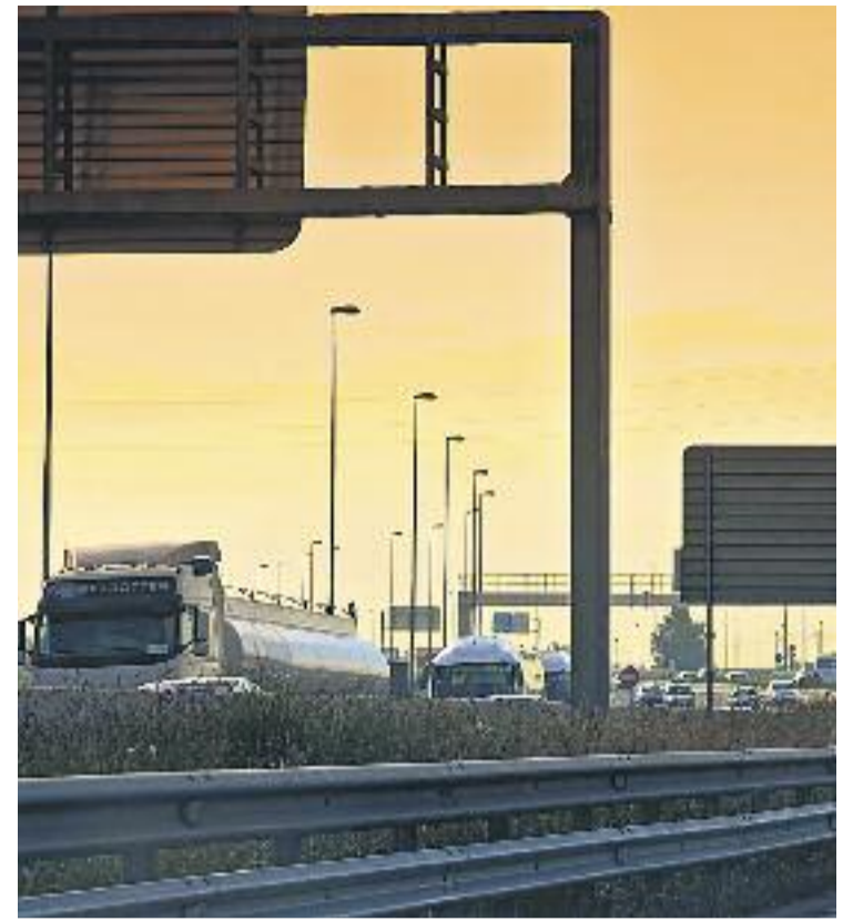
La contaminació de l'aire a l'àrea metropolitana és provocada principalment pel trànsit rodat.