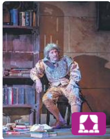
El fantasma de Canterville Oscar Wilde

Lord Canterville convida una família americana a passar el cap de setmana al seu antic castell d'Anglaterra. Ara bé, abans adverteix als nous habitants que el fantasma d'un avantpassat familiar vaga per la casa. Però els inquilins no fan cas de l'avertència, sinó que es burlen constantment d'ell.