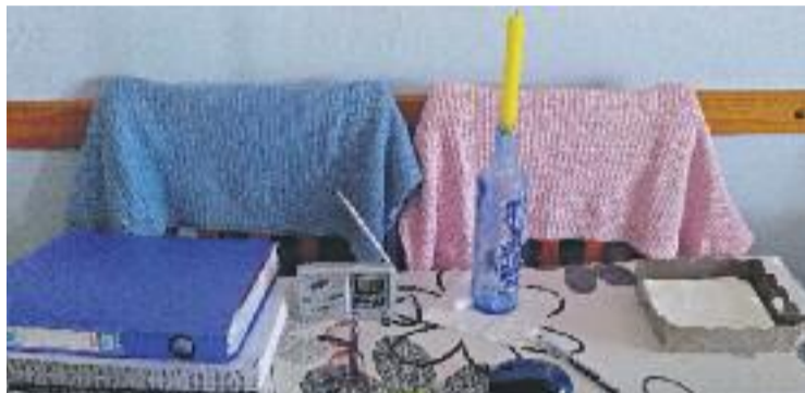
La família viu a les fosques des de principis de mes.

El que més lamenta aquest veí de Riera és l'actitud d'Endesa. "Es-