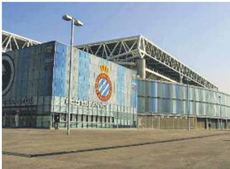
L'estadi de l'Espanyol és a cavall entre Cornellà i el Prat.

En aquest sentit, des de l'Ajuntament expliquen que després d'iniciar-se el procediment de recaptació establert per la llei, "en els darrers exercicis el RCD Es-