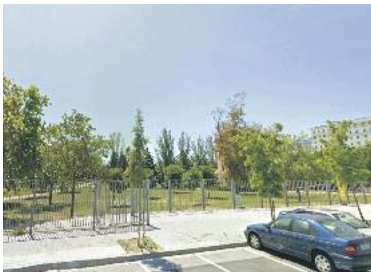
La biblioteca es construirà al parc del Canal de la Infanta.

L'edifici tindrà dues entrades: una a la planta superior que donarà a la carretera de Sant Joan Despí, i l'altra a la planta inferior que donarà al parc i comptarà amb grans vidrieres que ompliran l'espai de llum natural. A més de sales de lectura, comptarà amb un punt de préstec i aules on es podran organitzar formacions, tallers, conferències i reunions. També s'inclourà un gran espai obert exterior per poder realitzar activitats a l'aire lliure.