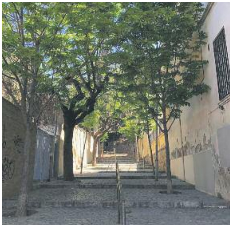
El carrer de Miquel Roncali i Destefanis, també dit de les Escaletes, és un racó característic de la ciutat.

En aquell Ple, el tinent d'alcalde Antonio Martínez va respondre que no tenien res a amagar i que només estaven començant a treballar en aquesta idea. Línia Cornellà s'ha posat en contacte amb