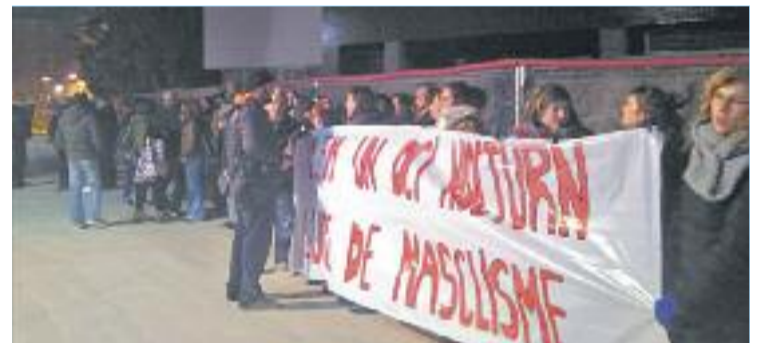
Manifestació de principis de febrer al davant de la discoteca.

POLÈMICA ▶ "Falten pocs dies per unir-te a la manada". Amb aquesta desafortunada frase, inserida en un anunci on apareixia una dona, la discoteca Phant anunciava la seva obertura i arrencava una polèmica que ha fet bullir les xarxes i que l'Ajuntament hagi decidit denunciar els propietaris aduint que la publicitat atempta contra la dignitat de les persones.