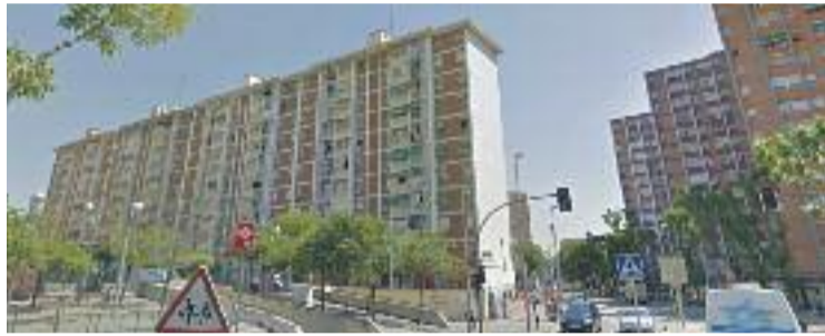
Accedir a un lloguer és cada dia més car.