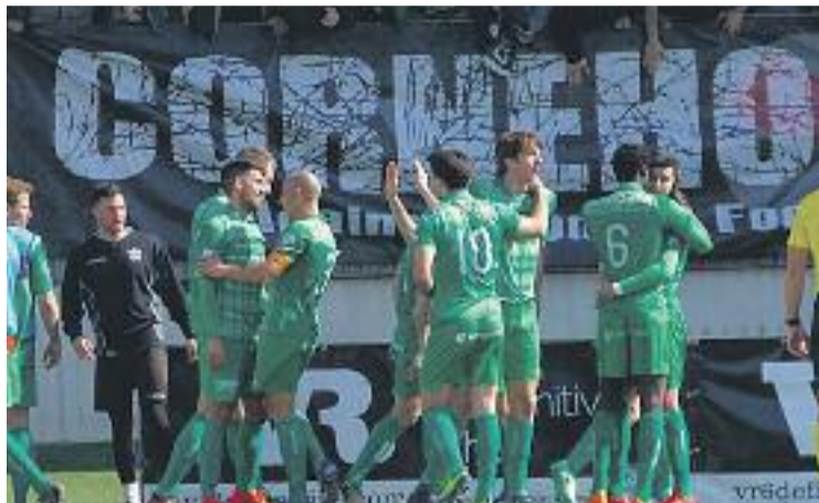
L'equip celebra un dels gols en el partit contra el Mallorca.

manes, el Cornellà ha derrotat els dos primers classificats, el Vila-real B (3-0) i el Mallorca (que fins ara només havia perdut un partit, per 3-1) al municipal, a banda d'empatar a Formentera.