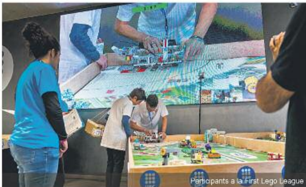
Participants a la First Lego League

Hi ha diferents premis i guardons per als concursants de les diferents fases. Aigües de Barcelona hi col·labora amb el guardó 1r premi al Projecte Científic com a agent coneixedor i impulsor de la gestió eficient del cicle integral de l'aigua. També