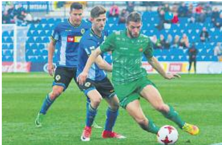
Els verds van sumar un punt al Rico Pérez d'Alacant.

Saguntí, que tampoc han aconseguit uns resultats excel·lents en els partits d'aquest mes.