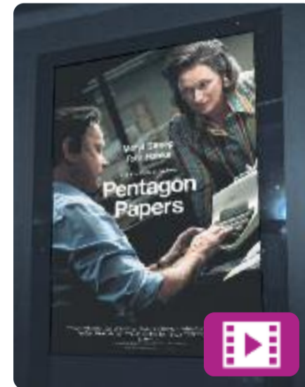
Els arxius del Pentàgon Steven Spielberg

Més d'un mes després de la seva estrena als Estats Units arriba a casa nostra l'últim títol de la factoria d'Steven Spielberg. La pel·lícula reviu el pols entre el diari nord-americà The Washington Post i l'administració Nixon pels informes classificats sobre la guerra del Vietnam. Periodisme de pel·lícula.