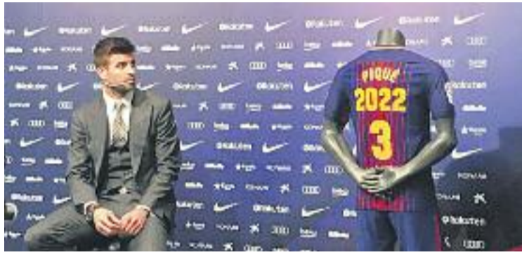
Piqué, durant la seva renovació, no se'n va desdir.

El consistori també ha repriminat l'actitud del barcelonista, afirmant que "a vegades, la supèrbia pot acabar sent grollera", la qual, considera, impedeix "valorar correctament les