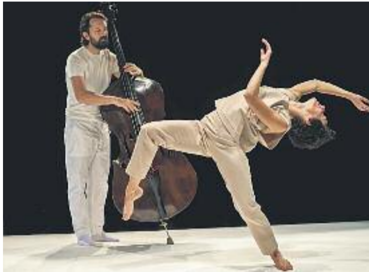
'Double Bach' arribarà a la ciutat el 10 de març.