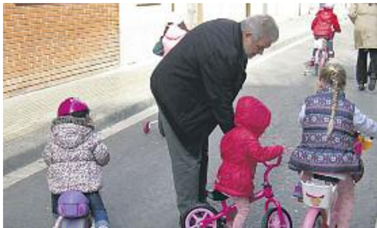
El consistori vol fomentar una mobilitat alternativa.

MOBILITAT ▶ Amb la voluntat de reduir la contaminació generada pels cotxes i per recuperar el carrer com un espai per con- viure, l'Ajuntament ha decidit que d'ara endavant cada diumenge de 9 del matí a dues de la tarda tancarà 16 carrers al trànsit. Es tracta del programa Diumenges, carrers sense cotxes , que vol potenciar l'ús dels carrers com a zones de lleure i oci per als cornellanencs i també posar un granet de sorra en la lluita contra la contaminació.