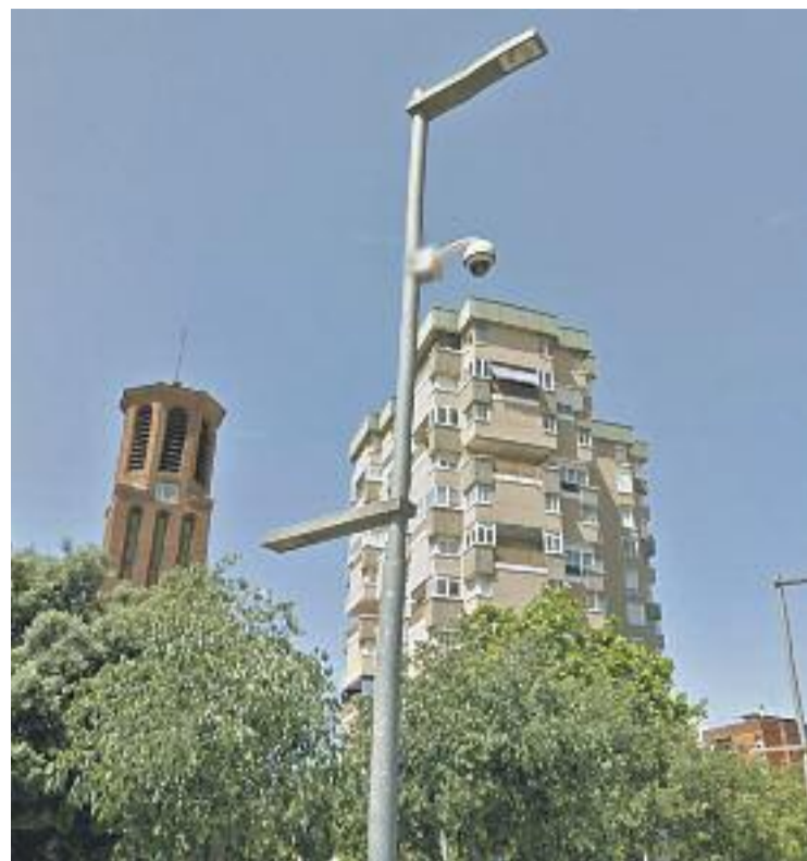
L'Ajuntament estudiarà instal·lar més càmeres de seguretat.