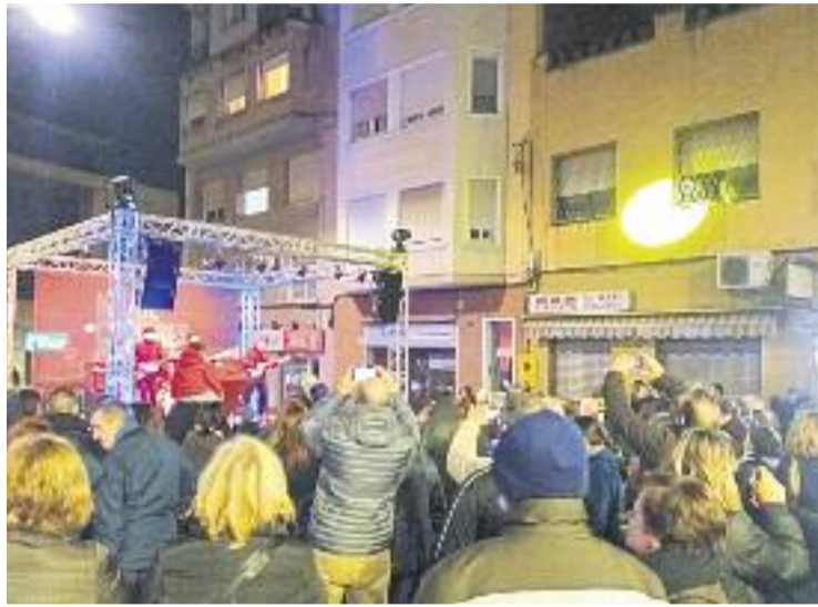
La Nit de Compres ja és una activitat consolidada.

Segons informa el consistori, hi participaran un total de 100 botigues de la ciutat, les quals