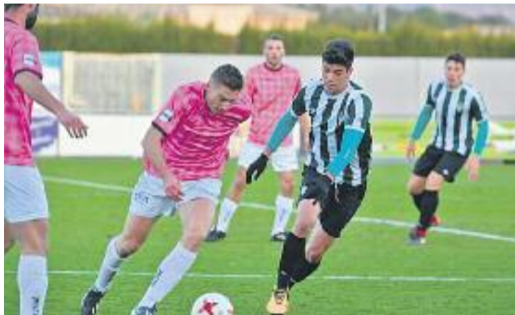
L'equip va guanyar al camp del Peralada.

La visita de la Peña Deportiva, el desplaçament a Son Malferit per jugar contra l'Atlètic