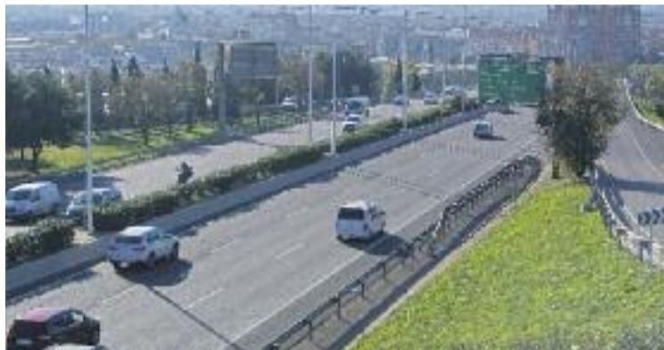
Cornellà és un dels municipis afectats per la mesura.

La ZBE es posarà en marxa l'1 de desembre i contempla que, durant els episodis de pol·lució ambiental –entre dos i tres cops l'any–, els turismes més contaminants no puguin circular per aquesta zona. Per vehicle contaminant s'entenen tots aquells que no disposin de l'etiqueta ambiental de la DGT, és a dir, els de benzina anteriors a l'any 2000 i els dièsel d'abans del 2006. Els vehicles d'emergències, de persones amb mobilitat reduïda i de serveis essencials, per la seva banda, podran circular sempre, tinguin o no l'etiqueta de la DGT.