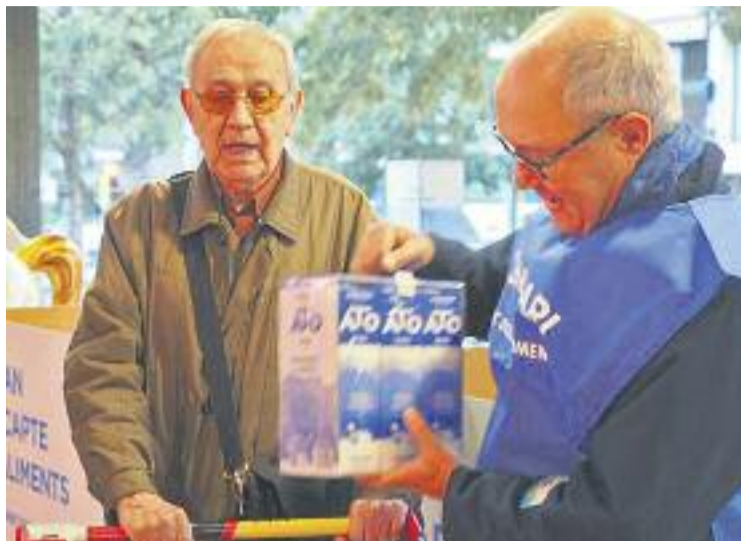
El recapte tindrà lloc els dies 1 i 2 de desembre.

El Gran Recapte arriba aquest 2017 a la vuitena edició. Es tracta d'una iniciativa que es porta a terme de manera simultània per part dels quatre bancs d'aliments que hi ha a Catalunya. Els dos objectius primordials són recollir aliments nutritius de llarga durada –com arret, oli i conserves– i sensibilitzar i mobilitzar la ciutadania