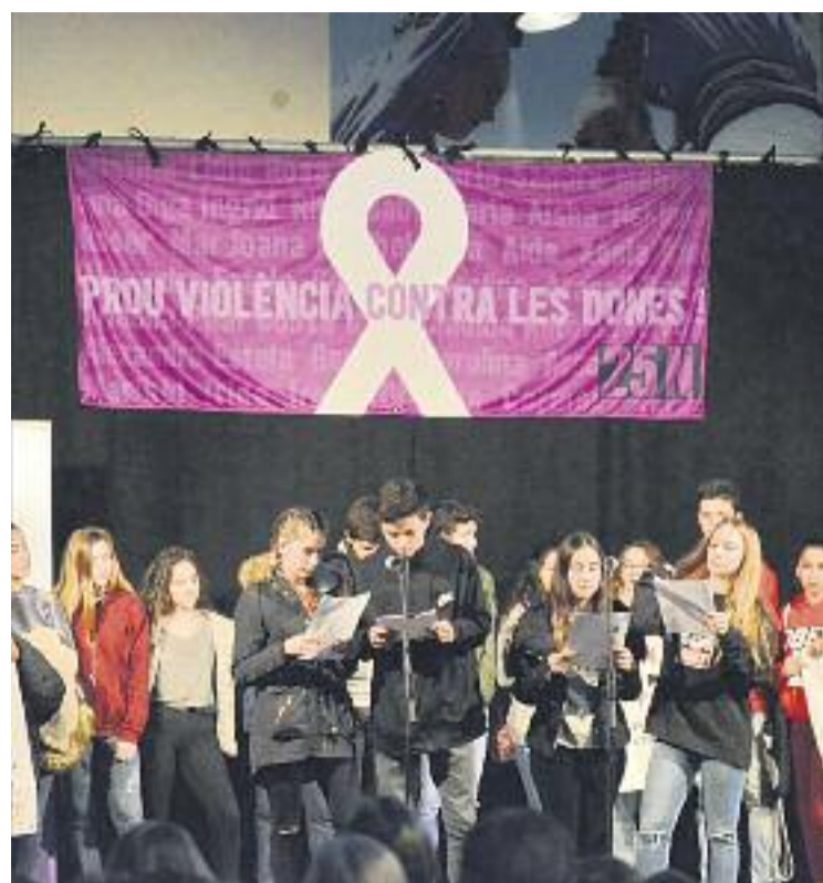
Els joves van tenir un paper important en la concentració del dia 25 de novembre a la plaça de l'Església.