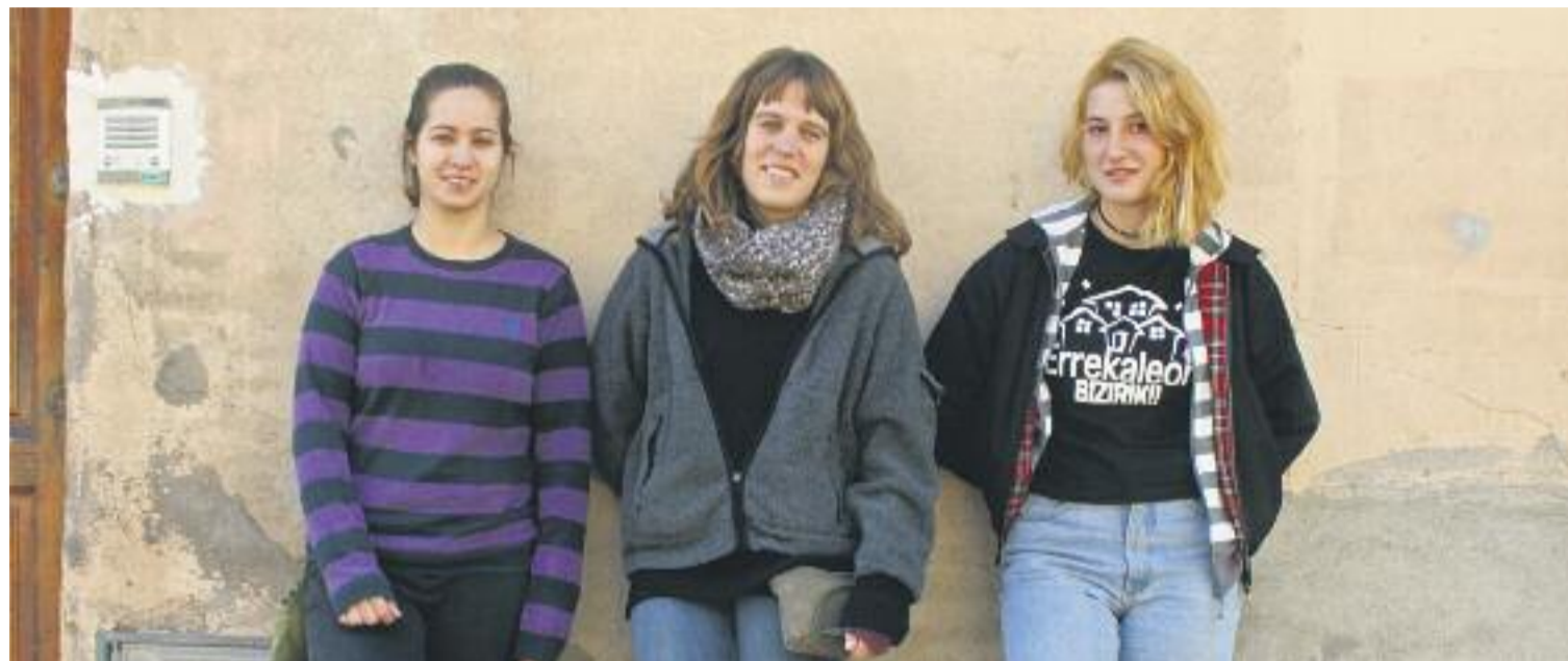
Tres noies comparteixen vivències i reflexions sobre la violència masclista amb aquesta publicació.

Les tres asseguren que els seus punts de vista han canviat des que participen en el grup de dones i Panyella explica que ha començat a veure el feminisme com "una vacuna". "De vegades et permet de