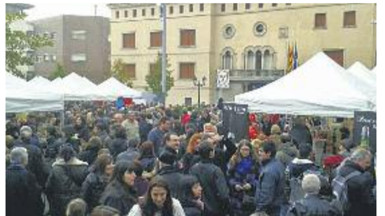
La Fira de Santa Llúcia arriba al sisè any.

Des de l'Ajuntament expliquen que la mostra "vol ser un punt de trobada en la qual tradició i Nadal omplin la ciutat".