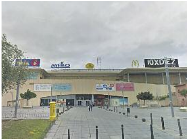
L'Eroski passa a ser Carrefour.

Carrefour explica en un comunicat que ha remodelat l'espai de gairebé 6.000 metres quadrats i que mantindrà els llocs de feina de les 73 persones que hi treballaven. A més, destaca que han contractat 40 treballadors i treballadores més per reforçar el servei de caixes,