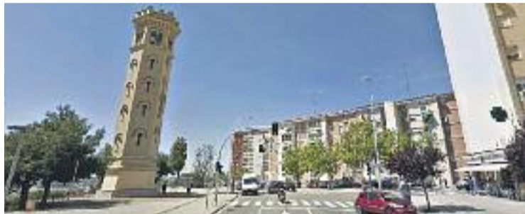
La presumpta agressió va tenir lloc a prop de la Torre de la Miranda.

La història, tanmateix, s'enverina quan aproximadament cinc mesos més tard el jove comença a veure borrós amb l'ull esquerre. El desembre, després de diverses visites a les urgències dels hospitals Moisès Broggi i de Bellvitge, els metges confirmen que la pèrdua de visió respon a un despreniment de retina i que cal operar-lo urgentment. Després que tant el Moisès Broggi com Bellvitge informessin la família que no tenien quiròfans disponibles –tal com consta als informes dels dos centres sanitaris, de l'1 de desembre–, O. B. C. va acabar a la clínica privada Barraquer, on va ser operat el 5 de desembre.