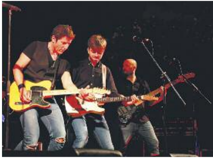
Fuentes va oferir un repertori ple d'èxits del Boss.

Com a teloners de l'espectacle va actuar el grup local Dais Rock, que durant 45 minuts van repassar els temes del seu àlbum Impecatvs . Segons han explicat, el propi Fuentes es va acostar per felicitar-los i encoratjar-los.