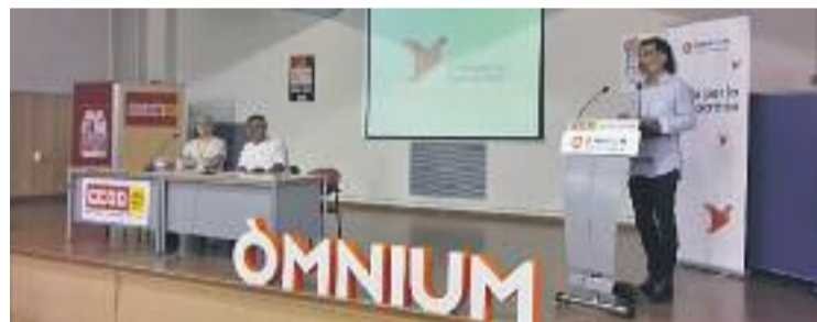
L'acte va tenir lloc a la seu de CCOO.

AGENDA NACIONAL ▶ El president d'Òmnium Cultural, Jordi Cuixart, va visitar la seu de CCOO de Cornellà el 20 de juliol per presentar la gestora que a partir d'ara coordinarà específicament la tasca de l'entitat sobiranista a Cornellà, Sant Just, Sant Joan, Sant Feliu i Esplugues, on ja compta amb 1.100 socis entre els cinc municipis.