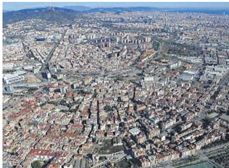
El consistori demana modificar la llei per agilitzar els desallotjaments.

Tot i que l'ocupació d'habitatges és una pràctica que sovint és el darrer recurs d'una família vulnerable que ha perdut casa seva, els casos amb que més treballa la policia local són de persones que tenen la finalitat d'especular amb l'habitatge i ocupen pisos il·legalment per rellogar-los o vendre'ls i treure'n