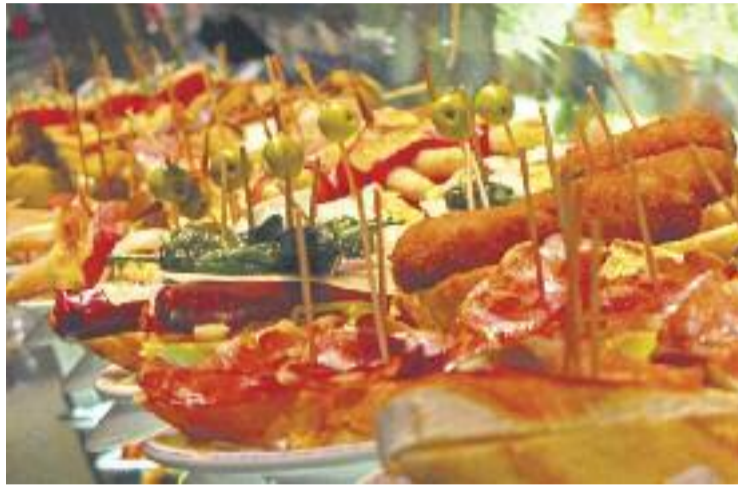
Les tapes arriben al Mercat Centre.

El bar del mercat, per la seva banda, serà l'encarregat d'oferir