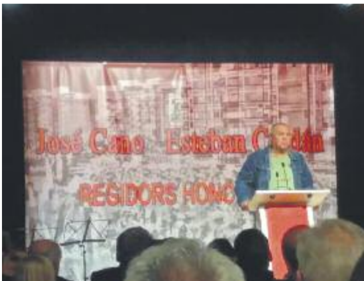
Un moment de l'acte en record de Cano i Cerdán.