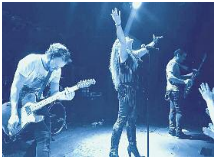
La Oreja de Van Gogh presentarà a l'Auditori el seu setè àlbum.

PROGRAMACIÓ ▶ La temporada de tardor de l'Auditori de Cornellà no deixarà indiferent ningú. Ja s'ha publicat l'oferta d'espectacles i abonaments, que es posaran a la venda a partir del 12 de juny, amb música i teatre de primera categoria. Destaca l'actuació del grup de pop rock La Oreja de Van Gogh, que presentarà el seu setè àlbum el 21 d'octubre. La banda celebra vint anys dalt dels escenaris, i després del relleu d'algun dels seus components, sembla que el camí de l'èxit encara no s'esgota per aquest conjunt.