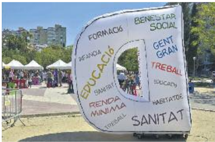
Cornellà reivindicarà la vida amb dignitat per cinquè any.

La Setmana de la Dignitat està impulsada per l'Ajuntament en el marc de l'Acord Social contra la Crisi, que aplega una trentena d'entitats, institucions, grups polítics, agents socials i particulars del municipi. Enguany, el famós periodista cornellanenc Jordi Évole obrirà l'acte inaugural el dijous 8 de juny, organitzat per Cornellà Solidari a l'Auditori de Sant Ildefons, a les 19 h, i on també