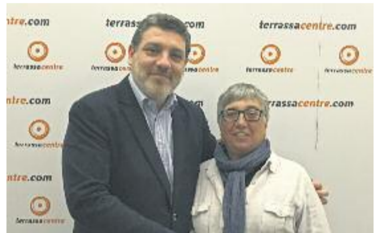
Calbet (RETAILcat) amb Costa (Fundació Comerç Ciutadà).

D'aquesta manera, la Fundació Comerç Ciutadà compartirà full de ruta amb Barcelona Oberta, Fundació Barcelona Comerç, Cecot Comerç i Comertia, socis fundadors de RETAILcat. Entre les cinc entitats representen més de 7% del Producte Interior Brut de Catalunya.