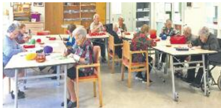
Usuaris del Respir a les instal·lacions del Recinte Mundet de Barcelona

DADES ▶ Durant l'any passat, el programa Respir va atendre un total de 3.300 usuaris.