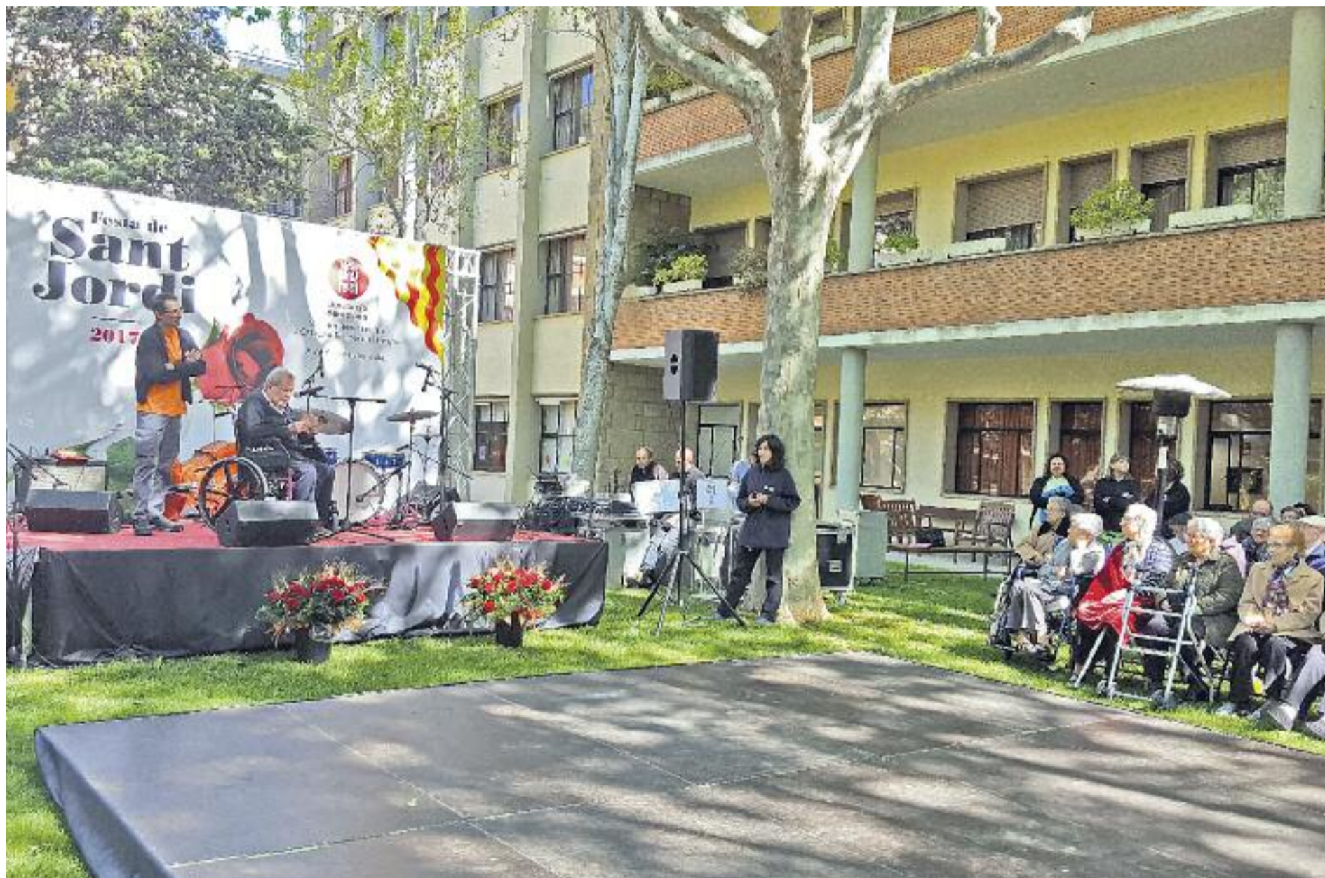
Celebració de la Diada de Sant Jordi 2017 al Respir

» La Diputació ofereix el servei d'acolliment temporal Respir per a persones dependents » Se'n poden beneficiar els més grans de 65 anys o amb discapacitat intel·lectual