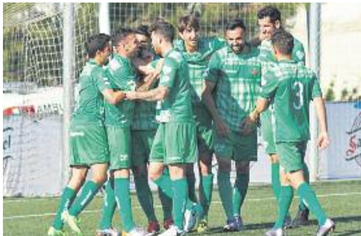
Un moment del darrer partit del curs dels verds.

Possiblement la nota més negativa de la temporada ha estat no haver pogut classificar l'equip per a la Copa del Rei de la temporada 2017-18, ja que només la jugaran els cinc millors conjunts