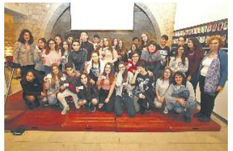
Els joves membres de la XAJI.

Al voltant de 80 joves dels diferents centres d'educació secundària del municipi formen part de la Xarxa i el passat 17 de març es va fer un acte simbòlic de reconeixement a la seva tasca amb el lliurament de Carnets d'Agents d'Igualtat, en el marc dels Actes del Dia Internacional de la Dona Treballadora a Cornellà, al Castell de Cornellà.