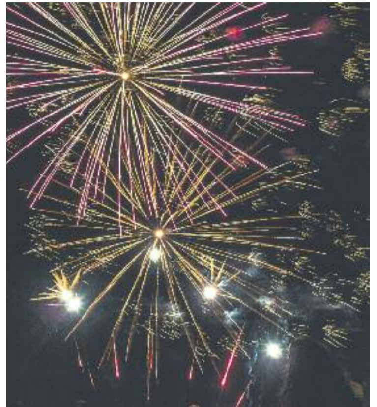
El Corpus tornarà a treure al carrer milers de cornellanencs.