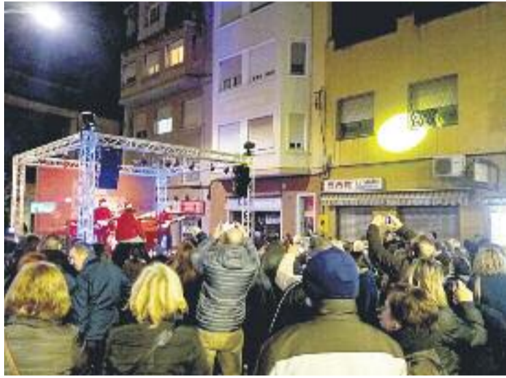
Algun dels espectacles de la Nit de Compres.

Durant la Nit de Compres es van repartir bosses reutilitzables entre els assistents amb el lema Queda't amb el comerç de Cornellà , una iniciativa que pretén premiar la fidelitat dels consumidors, els quals ja fan servir la