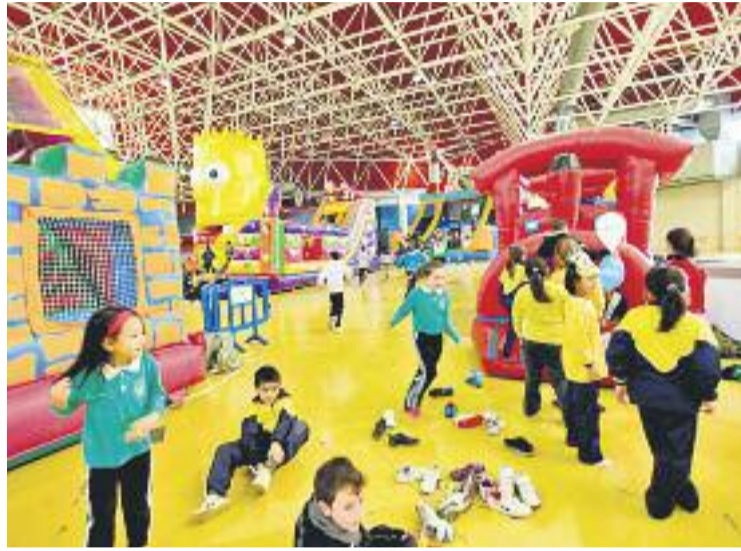
Milers d'infants tenen una cita a la Fira de Cornellà.

Enguany la Fira Infantil de Nadal col·labora per primera vegada amb l'associació Mechones solidarios a través de la perruqueria de Cornellà Narbona Estilistes, en favor de la lluita contra el càncer. Tots els vi-