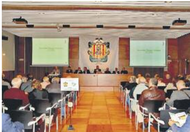
El club ha demanat que els socis assisteixin a l'assemblea.

En cas que els socis veiessin amb bons ulls el canvi i que club canviés la seva configuració, es començaria a desequilibrar la quantitat d'entitats del grup 3 de Segona B que són SAE. Al co-