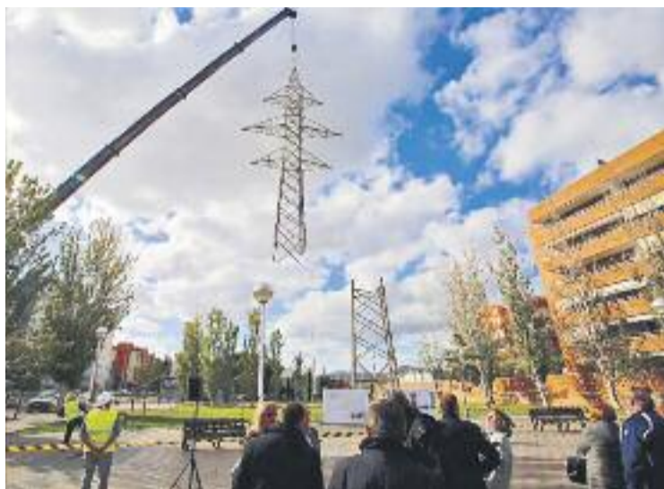
Desmuntatge d'una de les torres d'alta tensió al barri.

Aquesta línia uneix les subestacions elèctriques de Sant Boi i Sant Joan Despí i data dels anys 50, és propietat d'Endesa i està constituïda per dos circuits d'alta tensió de 110kV. La nova variant soterrada passa per la Via Llobregat, entrant a Cornellà pel carrer Priorat, passant per sota de la Carretera de Sant Joan Despí i vies del tramvia, continuant pel carrer Montserrat Roig fins a arribar al parc de Destraleta, des d'on es passa a l'altre costat de les vies del tren