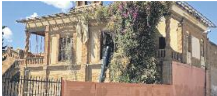
La Casa del Director, malmesa el 2013 per un incendi.