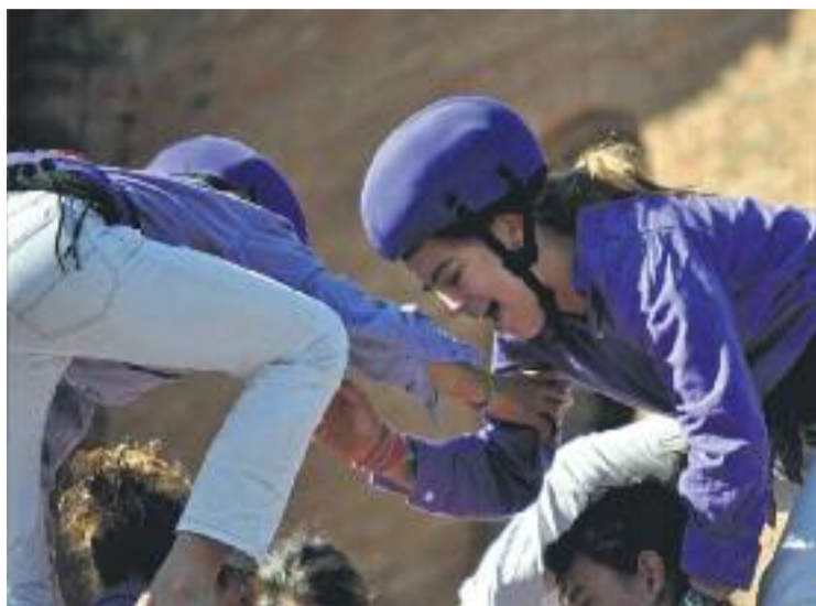
La Diada Castellera va ser tot un èxit.

La jornada de la XXVI Diada s'iniciava amb les Matinades i el so de les gralles, i fent entrega de la camisa d'honor al pallasso Tortell Poltrona. Un cop a plaça, i acompanyats pels Castellers d'Esplugues i els Xics de Granollers, els "liles" van aconseguir descarregar el 5 de 7, el primer 3 de 7 per sota després de 15 anys, el 7 de 7 i el pilar de 5. Tal com expliquen ells mateixos al seu bloc, "il·lusionats i plens d'alegria" van acabar l'actuació amb dos pilars al balcó de l'a-