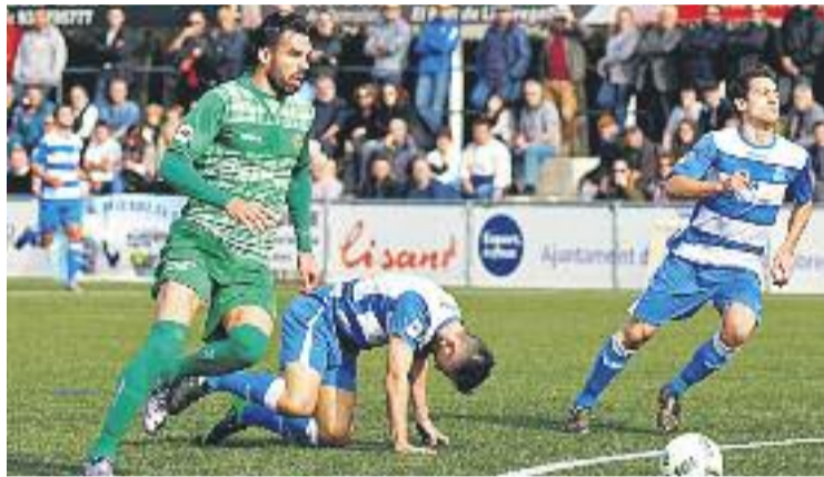
Els de Jordi Roger van puntuar al Sagnier.

Els de Pedro Dólera van crear les primeres ocasions, però el partit es va posar de cara per al Cornellà al minut 13, quan l'equip va recuperar una pilota i li va fer arribar a Enric, que arrencant gairebé des del mig del camp va marxar per velocitat, va driblar un defensa del Prat i Teixeira i va marcar a porteria buida. Els potabla-