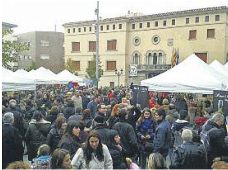
La fira arriba a la seva cinquena edició.

Una setmana més tard, el dia 1 de desembre, es donarà el tret de sortida a Nadal amb l'encesa oficial de l'enllumenat. Aquell dia arrencarà amb un taller infantil a les sis de la tarda a la plaça Catalunya i, ja a les