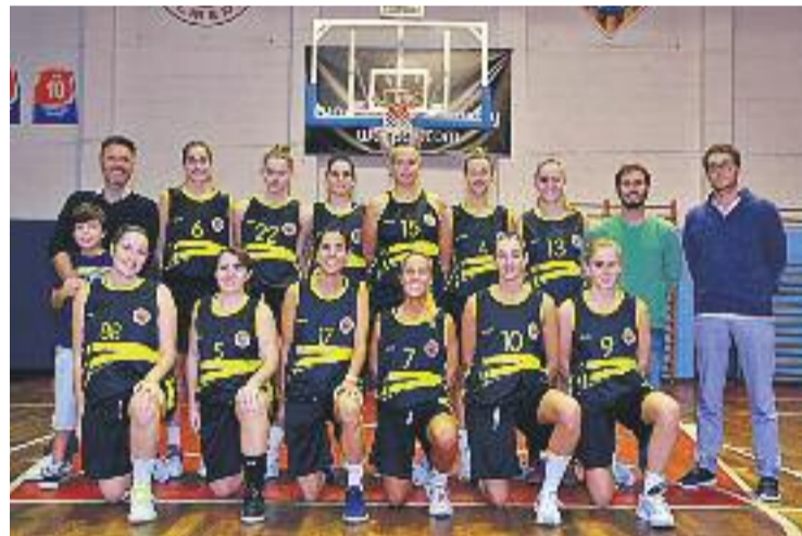
La plantilla i el cos tècnic per a aquest curs 2016-17.

L'equip voldrà retrobar-se amb la victòria dissabte, quan visitarà la pista del CEJ l'Hospitalet.