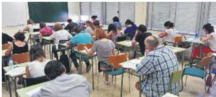
Una prova final dels cursos de català del CNL.