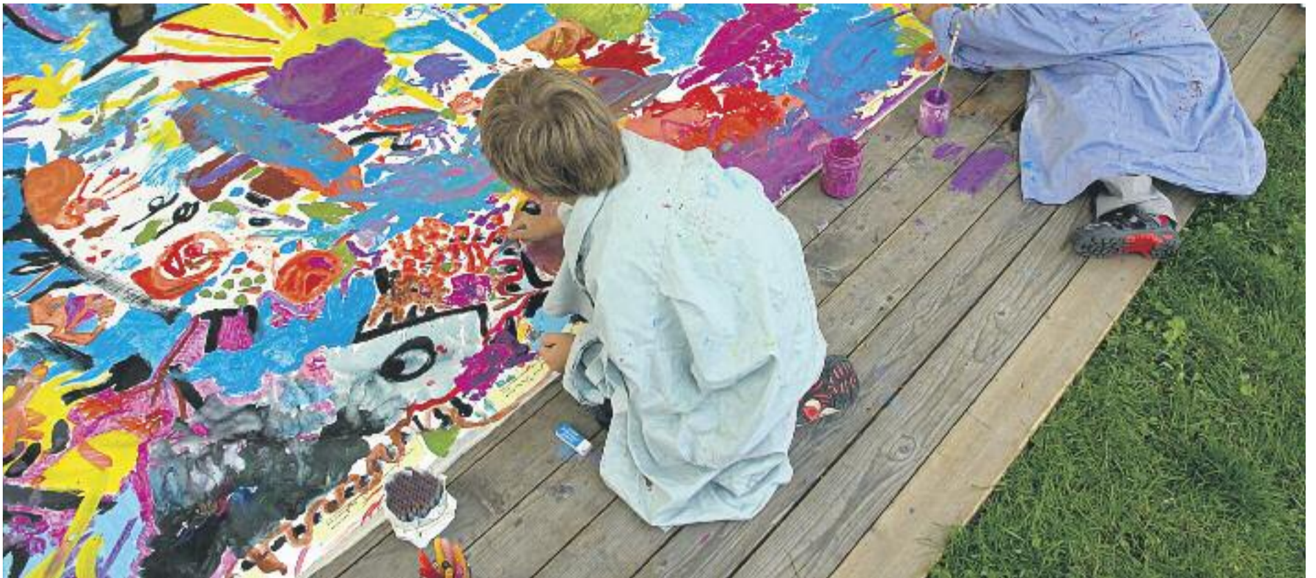
El programa Escola Nova 21 impulsa l'aprenentatge per projectes, valors i habilitats.