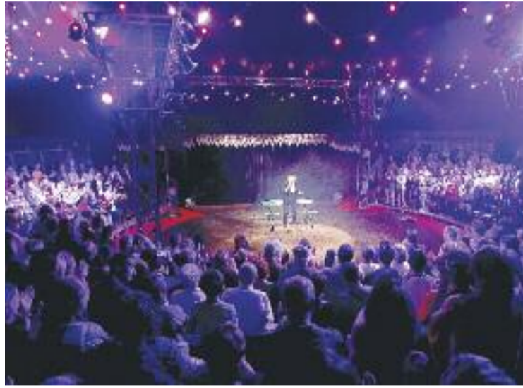
La carpa va ser l'epicentre del festival.

“Enguany hem recuperat l'essència dels primers festivals, allà pels volts del 1984”, explica a Línia Cornellà Rocío García, regidora de Cultura. El fet és que amb Tortell Poltrona a la direcció artística, el festival ha esdevingut més de carrer, amb 63 actuacions de les 100 que hi havia programades, i omplint 20 espais diferents de la ciutat. García ha explicat que reclamaran “més suport per part d'altres administracions”, per garantir la pro-