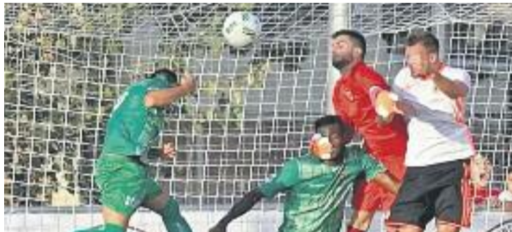
Els verds van perdre el segon partit del curs a casa.

Els canvis que va fer Roger al descans van sacsejar el partit i només havien passat nou minuts de la represa Noño, de falta, va restablir l'empat. El gol va donar moral al Cornellà, que va me-