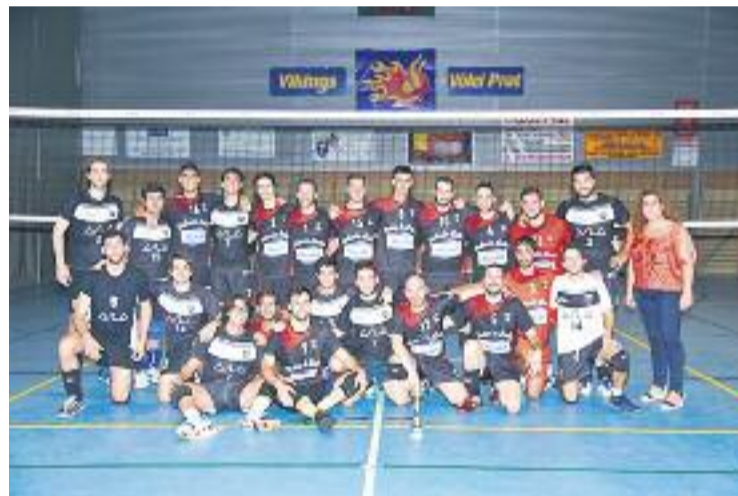
La foto de família dels jugadors amb la copa.

Després d'aquesta competició, els sandoristes ja estan centrats a la lliga. L'equip va debutar a la Primera perdent contra el mateix Aula (3-2), mentre que el primer partit a casa contra el Prat va repetir resultat (2-3). El Sàndor buscarà la primera victòria del curs a casa dissabte contra el CV Olot.