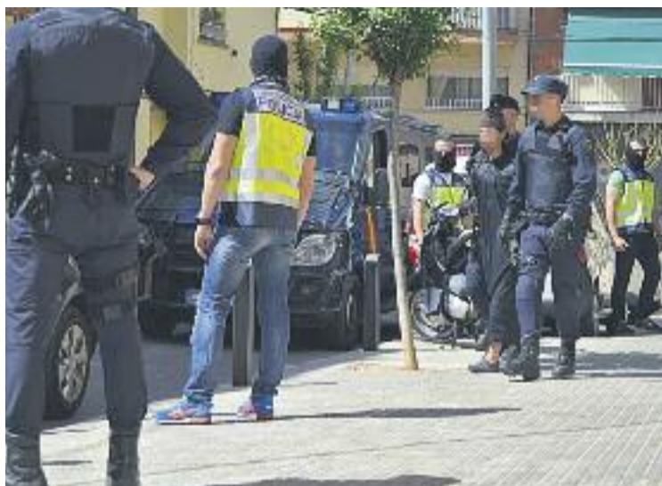
Les detencions van tenir fort ressò mediàtic.

Les detencions a les quals fa referència la informació es van produir l'any 2015, concretament als mesos de maig i novembre. La policia va detenir dues persones en cada operació acusades de captar terroristes per a l'Estat Islàmic i celebrar reunions en una mesquita local. Els detinguts seguien, segons Interior, "instruccions directes de Daesh" i es dedicaven a difondre propaganda de l'organització terrorista entre els seus simpatitzants utilitzant les xarxes socials. Segons la policia, els detinguts també produïen els seus propis continguts radicals.