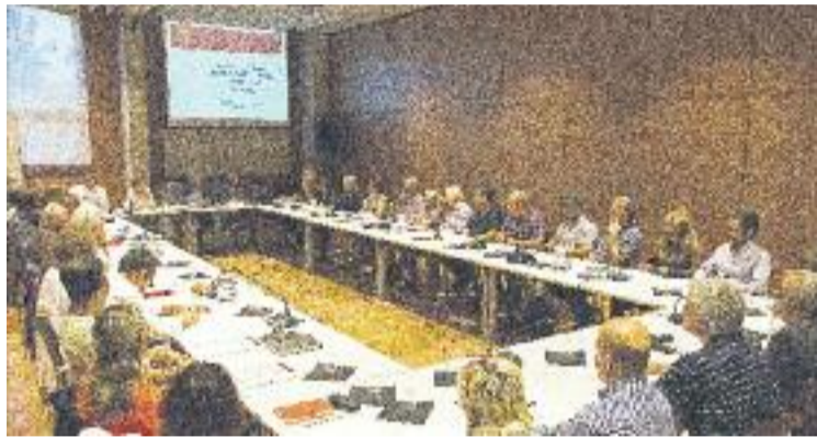
L'Acord Social recull un total de 90 propostes.

Per altra banda, des de CeC consideren que gran part de les propostes de l'acord "són massa genèriques" i que no s'ha fet cap tipus d'avaluació "seriosa" de l'Acord Social anterior, bona part de les propostes del qual, as-