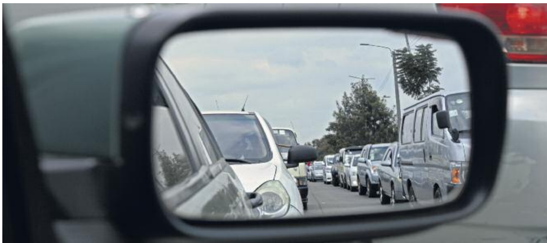
La congestió del trànsit per entrar a Barcelona agreuja el problema de la pol·lució.