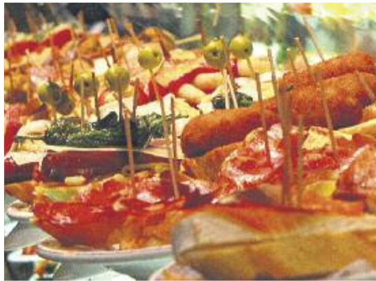
El Quinto Tapa reivindica les tapes amb productes de proximitat.

Els participants tornaran a oferir una doble proposta de degustació. Per una banda, la tapa km0, de tres euros, i la tapa especialitat de la casa, de 2,5 euros. El Quinto Tapa, a més, tornarà a dividir la ciutat en dues zones i oferirà la possibilitat de guanyar diferents premis mitjançant el Tapaport i un premi per als que facin fotografies i les penguin a Instagram.