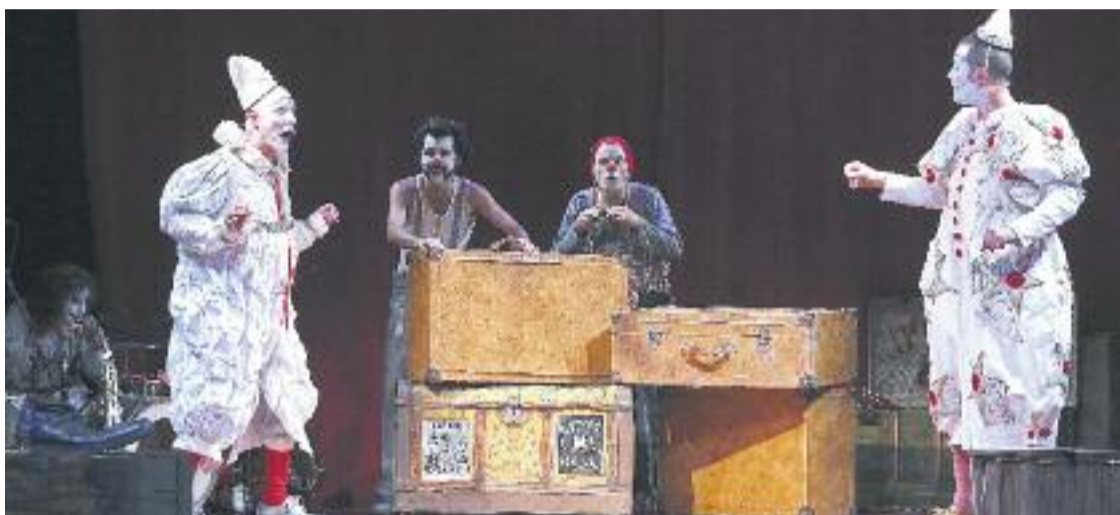
Enguany el festival arribarà a diversos espais de la ciutat.

Els recintes que enguany acolliran espectacles seran una carpa a la Plaça Catalunya, els teatres com l'Auditori Sant Ildefons i el Patronat, i aquest any també l'Auditori de Cornellà, que acollirà dos espectacles en la seva programació: Leo Bassi, que presentarà la Misa Patòlica, i la companyia francesa l'Enterprise, que presentarà l'espectacle