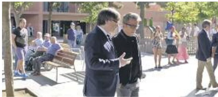
Puigdemont amb Buenafuente passejant per Sant Ildefons.

POLÍTICA ▶ El president de la Generalitat, Carles Puigdemont, va visitar Sant Ildefons fa uns dies, on va ser entrevistat per l'humorista i presentador Andreu Buenafuente en el marc del programa de TV3 Fora de sèrie .