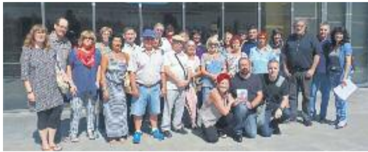
Suport als declarants.

“El meu pare no va ser un traïdor, ho van ser ells”, exclama