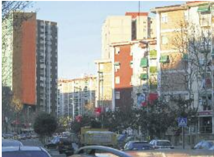
La PAH està gestionant actualment uns 50 casos.

Una altra de les iniciatives que impulsa l'Ajuntament per afrontar la problemàtica de l'habitatge són les sancions als tenidors de pisos buits. En el termini d'un mes aquests propietaris han d'ocupar el pis o bé l'han de cedir a l'administració perquè els disposi en règim de lloguer social. Si s'hi neguen, el consistori pot imposar sancions