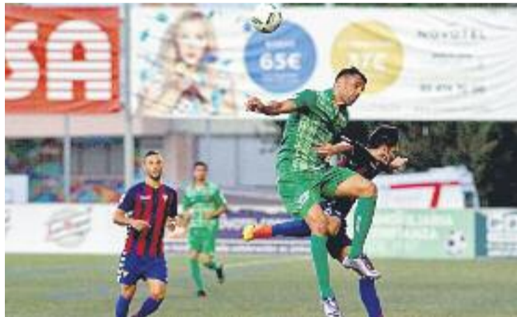
L'equip va patir la primera derrota contra el Gavà.