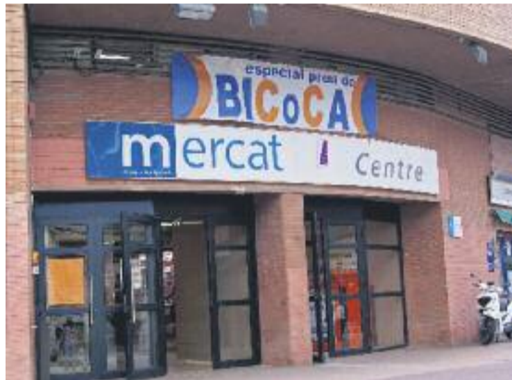
L'activitat es farà a finals d'octubre.