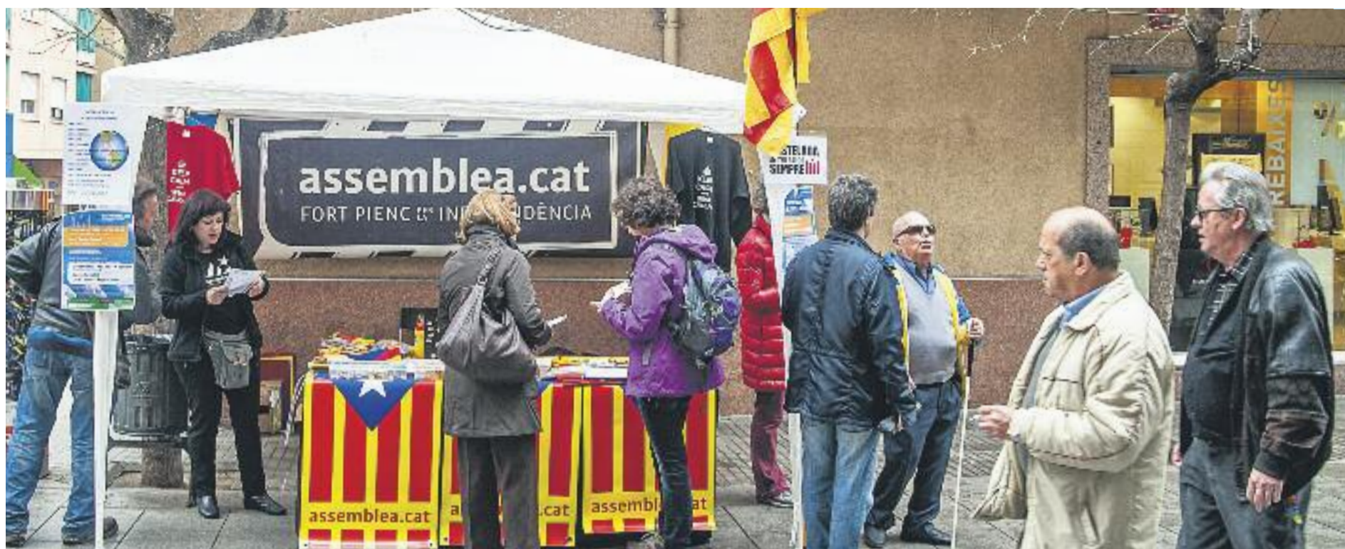
La feina de carrer, principal eina de les entitats independentistes.