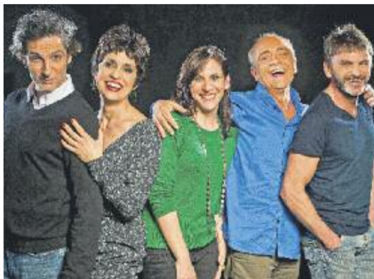
Els intèrprets d' Atchúuss! .

Els personatges que passen per la consulta comparteixen les seves vivències, preocupacions i també les seves ridiculeses amb el seu metge.