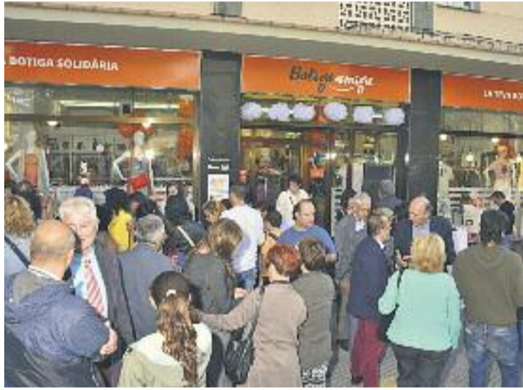
Dia de la inauguració de la botiga.