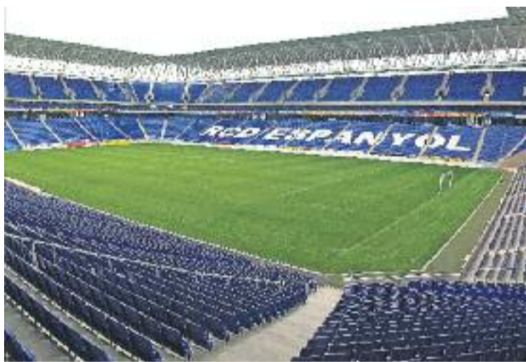
L'RCDE Stadium podria acollir un partit entre Espanya i Itàlia.