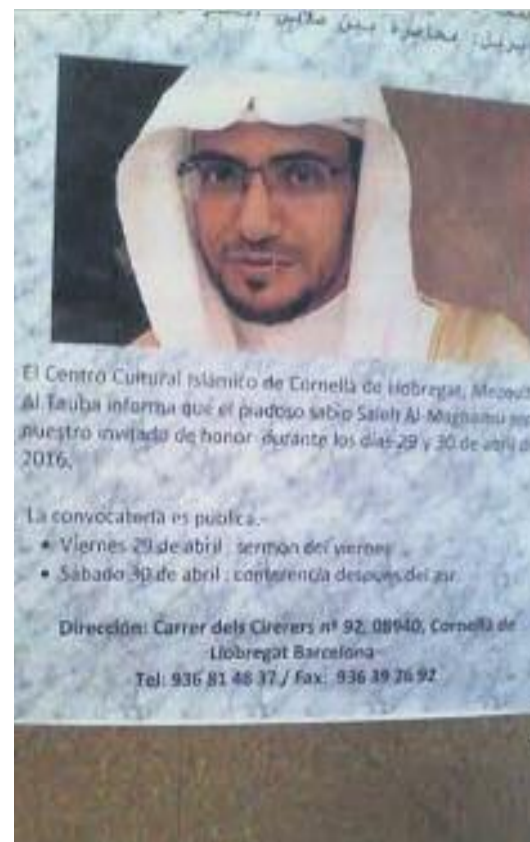
Mesquita Al Tauba (esquerra) i el cartell de la visita d'Al Moghamsy, "convidat d'honor" per fer el sermó de divendres 29 d'abril (dreta).