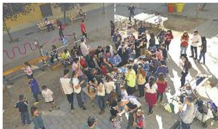
Un grup de l'esplai Gavina.

Per altra banda, ja han començat les inscripcions per als casals d'estiu que es duran a terme al juny i juliol.