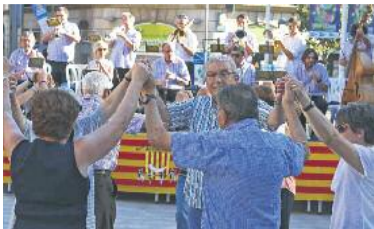
La cultura popular tornarà a ser protagonista al Corpus.

La festa Holi Dolly amb la Nit Sounday, del pròxim dissabte,