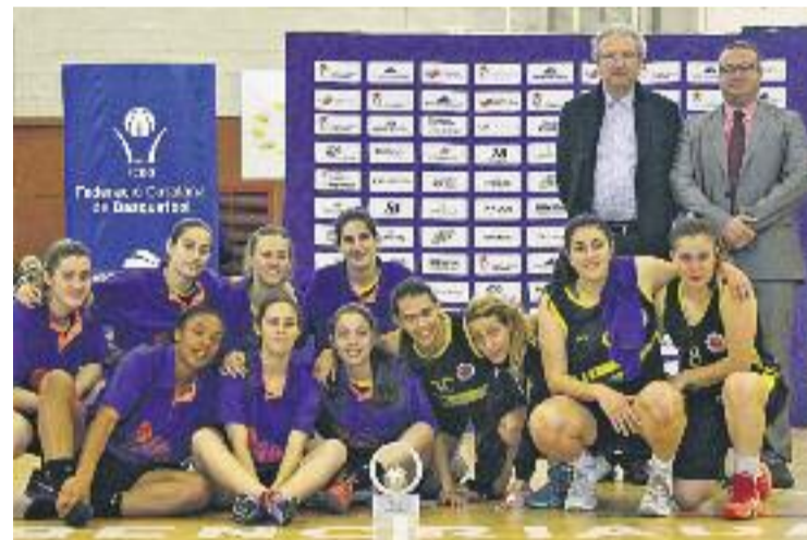
Les cornellanenques no van poder aixecar la copa.

Per la seva banda, el CB Cornellà va tancar la temporada en vuitena posició al grup C-2 de la lliga EBA. El 2016-17 serà el vuitè curs seguit de l'entitat en aquesta categoria.