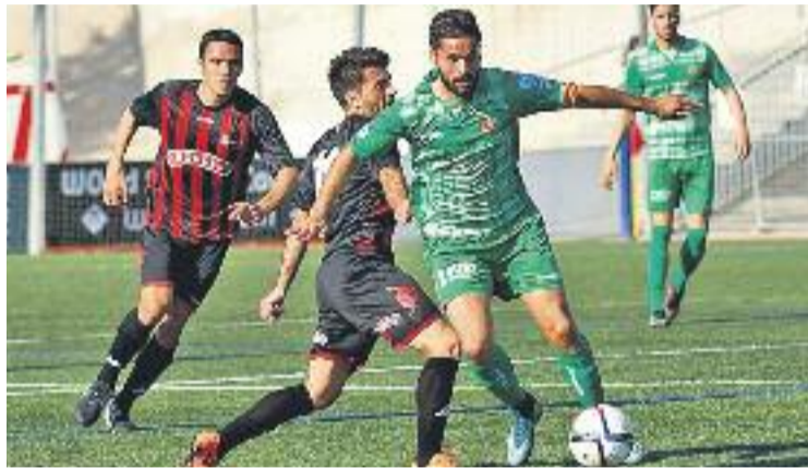
L'equip va perdre l'últim partit del curs contra el Reus.

Amb el curs tancat, la direcció esportiva ja treballa per dissenyar la plantilla de la temporada que ve. El club ja ha anunciat tres bai-