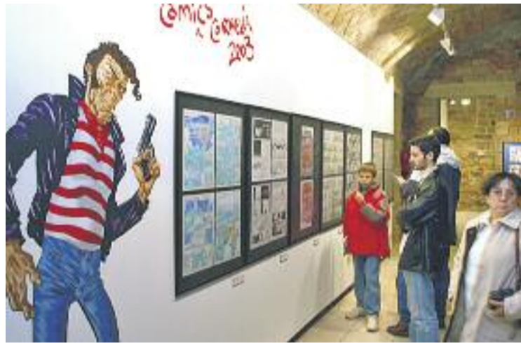
Exposició amb còmics d'altres edicions del concurs.

Hi ha un total de set premis. El primer guardó és de 1.200 euros i inclou un lot de còmics i un viatge al festival d'Angoulême. A més, hi ha tres mencions especials i els millors treballs seleccionats pel jurat es mostraran durant el novembre, en el marc