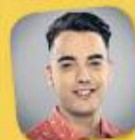
La tribu de Catalunya Ràdio Amb Xavi Rosiñol De dilluns a divendres, de 16 a 19 h