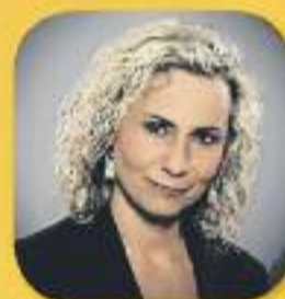
El matí de Catalunya Ràdio Amb Mònica Terribas De dilluns a divendres, de 6 a 12 h