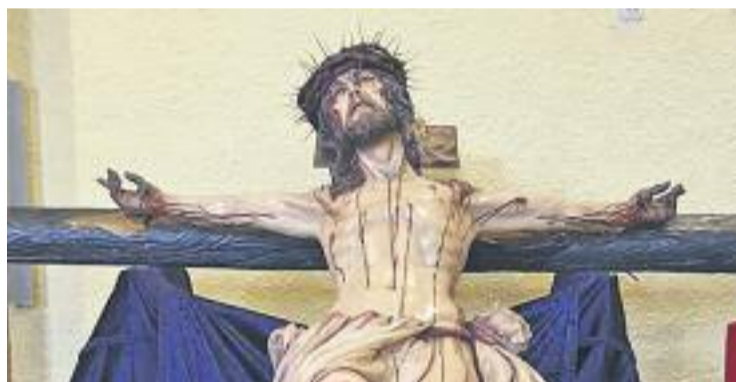
Una imatge d'arxiu del Crist.

ACCIDENT ▶ Ensurt a la Ma-drugá . Durant la processó nocturna del passat Dijous Sants la figura del Cristo de la Buena Muerte va caure d'esquenes i va ferir lleument dues persones que formaven part del seguici.