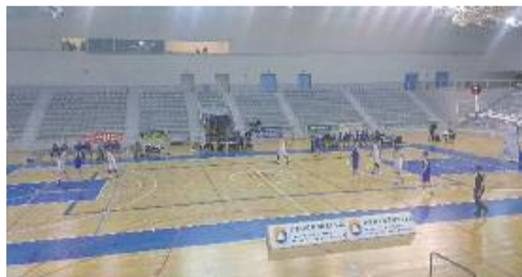
L'equip va patir una nova derrota al PELL.

BÀSQUET ▶ No va poder ser. El CB Cornellà va perdre el passat dia 19 contra el líder, el CB l'Hospitalet (53-76) i continua cuer del grup C-1 de la lliga EBA quan queden sis jornades perquè s'acabi la competició.