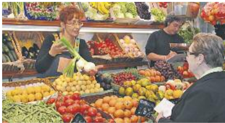
Segons la moció, el comerç contribueix al desenvolupament urbà.

Per aquest motiu es proposa "la creació d'un òrgan participatiu de treball i trobada de gremis, mercats i associacions comercials", el Consell Municipal del Comerç, que vol esdevenir un òrgan de debat i informació en l'àmbit comercial.