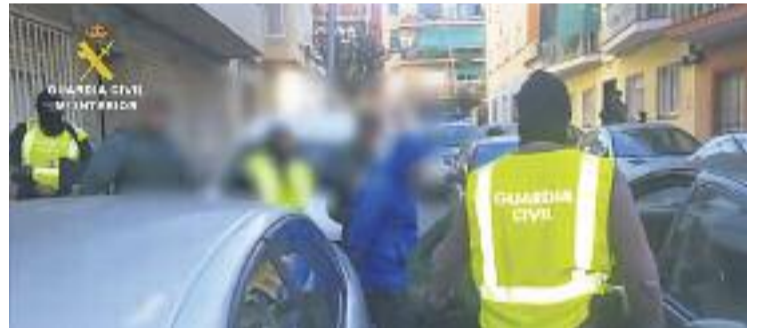
Moment de la detenció al carrer Llobregat.

SOCIETAT ▶ La Guàrdia Civil va detenir la setmana passada dos veïns de la ciutat, de nacionalitat marroquina i espanyola, presumptament relacionats amb la xarxa de captació de combatents per a l'Estat Islàmic (EI). Les detencions es van produir al carrer del Llobregat, al barri de Gavarrà, i al carrer del doctor Arús, a Sant Ildefons. L'operació va ser ordenada per l'Audiència Nacional i a hores d'ara segueix oberta.