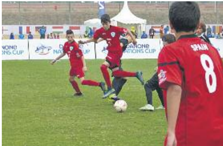
El Cornellà va perdre contra el Marroc, el qual acabaria sent campió.

Els nois de Pere Olivé van ser primers de la fase de grups, on es van enfrontar contra el Brasil, els Emirats Àrabs i Corea del Sud. Els cornellanencs van empatar a zero amb els primers, van guanyar per 2 a 0 contra els segons i van derrotar per la mínima el conjunt asiàtic. A vuitens de final, l'Aleví del Cornellà va de-