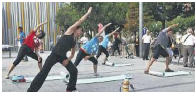
El programa ofereix activitats a l'aire lliure.

Les activitats es realitzen a set equipaments i indrets de la ciutat, com són el parc de la Infanta, Can Mercader, Can Mil·lers, la plaça de Sant Ildefons, l'Estadi Municipal d'Atletisme i Rugby i l'Associació Cultural Recreativa Peña Dominó del barri de Sant Ildefons.