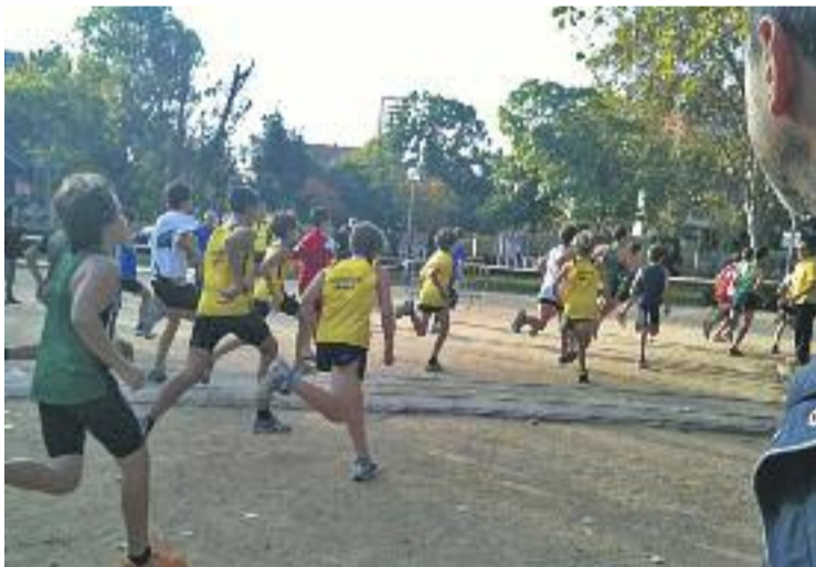
El Cros Escolar es va celebrar a Can Mercader.