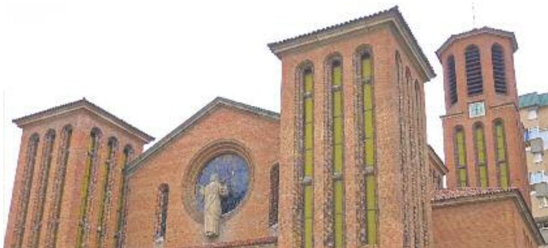
L'església de Santa Maria, on es van tancar els vaguistes de Laforsa.

Després del Nadal del 75, i davant la paràlisi de les negociacions —la vaga va ser considerada il·legal i es van acomiadar més de 150 membres de la plantilla—, els vaguistes es van tancar a l'església de Santa Maria, d'on van ser desallotjats violentament dos dies després per la policia. Aquella actuació va despertar la solidaritat dels treballadors de gairebé 200 empreses de tota la comarca, que van declarar-se en vaga, un atur que a la pràctica va