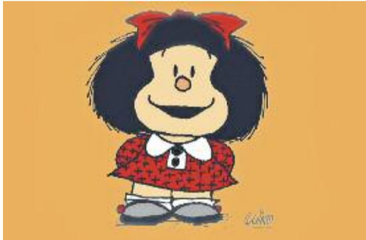
La mostra inclou una exposició sobre els 50 anys de Mafalda.

El primer dia va arrencar amb diverses mostres instal·lades a diferents indrets de la ciutat. En-