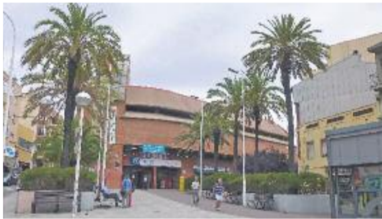
La jornada tindrà lloc al mercat del Centre i els seus voltants.

La Nit de Compres tindrà lloc en aquest mercat, on els paradistes obriran excepcionalment els seus estands durant la nit, i els seus voltants, on s'instal·laran carpes per als botiguers i comerciants que hi participin. "Encara no sabem el nombre exacte de carpes que s'instal·laran i pel que fa als paradistes del