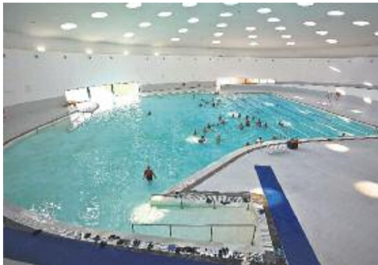
El complex està situat al barri de Riera.

La primera d'elles, una exposició sobre aquesta dècada d'esport a la ciutat, ja es pot visitar al hall del centre. A més, el passat dissabte dia 17 es va fer una classe magistral de pink zumba , una