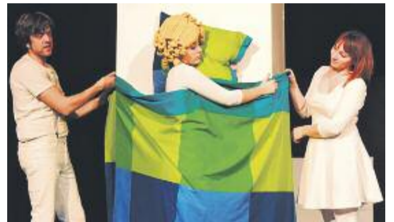
Hi haurà espectacles fins al 20 de desembre.

Per als espectacles de sala de la programació Cultura en Família hi ha diversos descomptes. L'entrada anticipada té un 10% de descompte, i es pot aconseguir un 20% addicional amb el Carnet Jove, el carnet de la Xarxa de Biblioteques o la targeta Rosa, entre altres. També hi ha abonaments que poden suposar fins a un 30% de descompte.