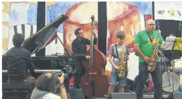
La música, una de les grans protagonistes de la jornada.

Entre les cerveses artesanes que es van poder tastar al llarg de la jornada hi ha Ales Agullons, Cornèlia, Hazte 1 litro, Birra o8, Les Clandestines, Hope, Els Minairons, Espiga, Espina de ferro i Bripau.