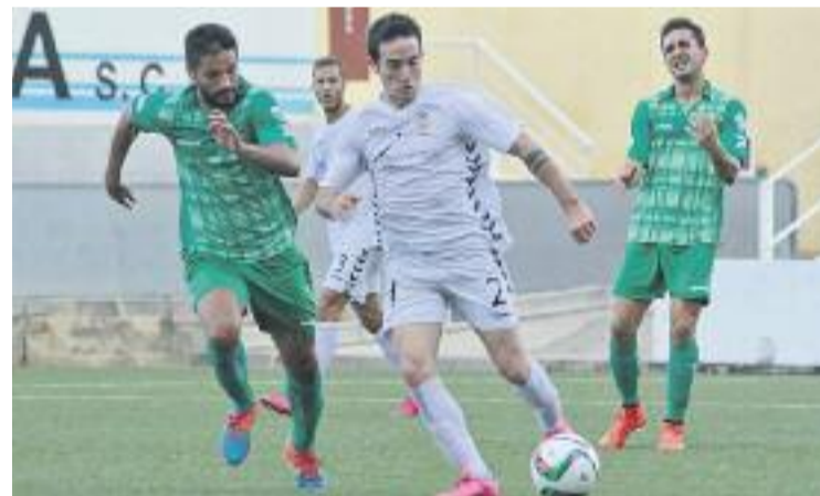
Els verds van tornar de la Murta amb els tres punts.