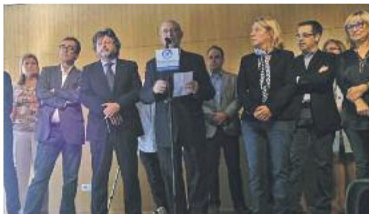
Roda de premsa on van anunciar el congrés.

POLÍTICA ▶ El partit Demòcrates de Catalunya (DC), creat per exdirigents sobiranistes d'Unió, celebrarà el seu congrés fundacional a l'Auditori el pròxim 7 de novembre, data que coincideix amb la fundació d'Unió.