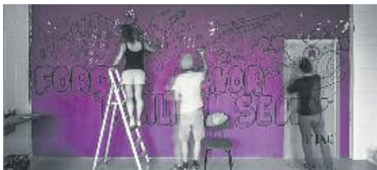
L'estació (a dalt) i un altre projecte de la FAC (a baix).

ral. "No només ens hem divertit, sinó que també hem intentat posar-hi tot el nostre cor", asseguren, tot posant èmfasi en la bona rebuda que ha tingut el mural. "Estem molt agraïts amb el bon feedback que hem tingut", argumenten.