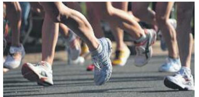
Hi haurà sis modalitats de curses.

Les inscripcions encara es poden fer a través d'internet –a ChampionChip–, o de manera presencial a l'Estadi Municipal d'Atletisme i a l'Ajuntament.