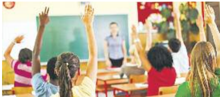
La comunitat educativa es mostra contrària a la LOMCE.

ENSENYAMENT ▶ Cornellà ha començat un nou curs escolar amb un total de 14.000 alumnes inscrits als seus centres, dels quals 2.400 pertanyen a l'educació infantil, 4.900 a la primària i més de 2.400 a l'ESO. La resta són estudiants que es distribueixen en les diferents modalitats de batxillerat i en els cicles formatius.