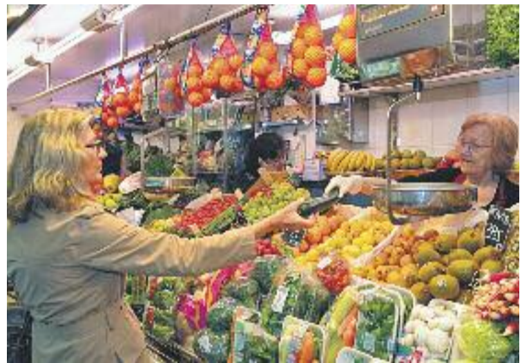
La Confederació premiarà els comerços que fomentin el català.

Però, a més, la CCC també ha creat un premi extraordinari que lliuraran a un establiment que hagi destacat per la seva col·laboració en el Pla d'Assessorament comercial lingüístic als comerços dels nouvinguts.