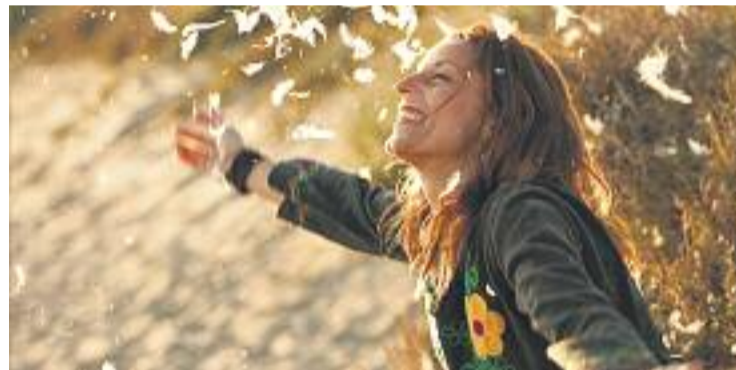
Chambao celebra enguany 13 anys de carrera professional.

El 8 de novembre serà el torn de l'òpera, amb Simfonia ; el 22 actuaran The Funamviolistas i el 13 de desembre tancarà la temporada Joan Pera amb Fer riure és un art .