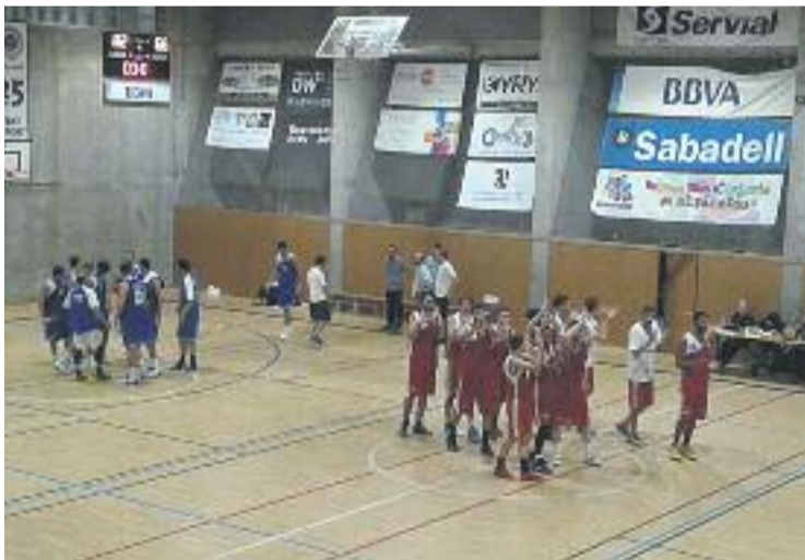
El Sant Nicolau celebrant la victòria davant del Cornellà.