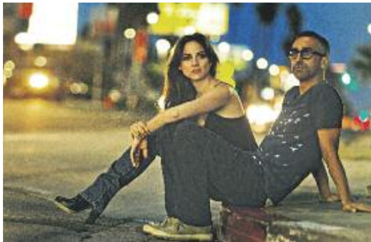
Marlango va estrenar el seu nou disc, El Porvenir .

Divendres 17 de juliol serà el torn de la formació musical Son Silvestre, a les deu de la nit, i de BGKO-Barcelona Gypsy Klemer Orchestra, a les onze -tots dos a Can Mercader-.