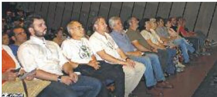
Alguns dels assistents a l'acte al Patronat.

Va ser el representant del SAT l'encarregat d'obrir foc, preguntant-se com pot ser que "hi hagi gent que defensi la independència del Sàhara però no la d'altres pobles de l'Estat". Salvador també va recordar la vinculació entre