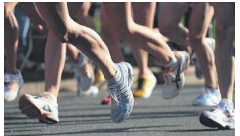
El Corss va recaptar energia per valor de 21.720 euros.

Amb els diners aconseguits, 87 famílies amb dificultats econòmiques de la ciutat tindran un estalvi del 20% en les seves factures energètiques.