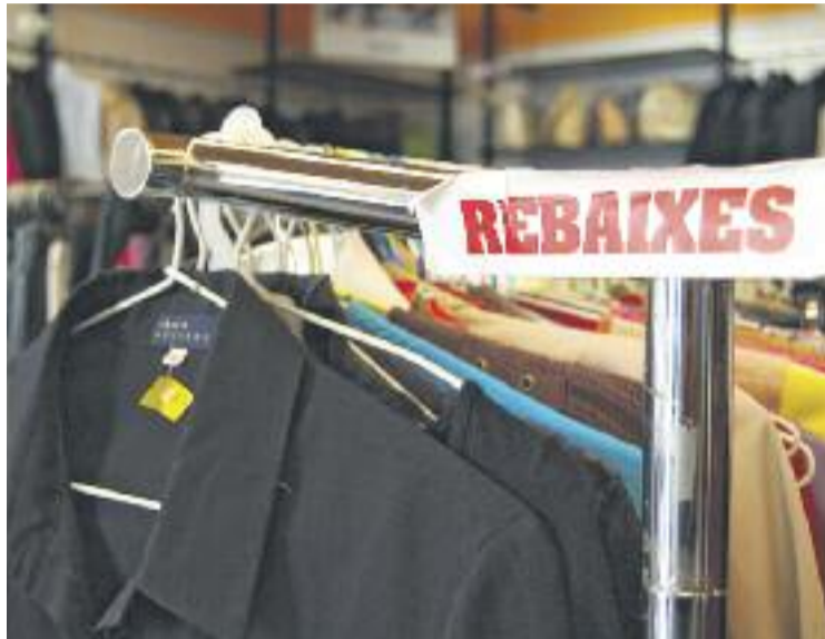
Els comerciants asseguren tenir "molt gènere" per a les rebaixes.

L'optimisme de la CCC es basa en l'augment de les vendes experimentat en els últims mesos. Respecte de l'avançament de descomptes i ofertes que fan algunes marques, la CCC recorda que el dia 1 de juliol continua sent el dia d'inici tradicional de les rebaixes "en l'imaginari col·lectiu", i assegura que començar abans les rebaixes és