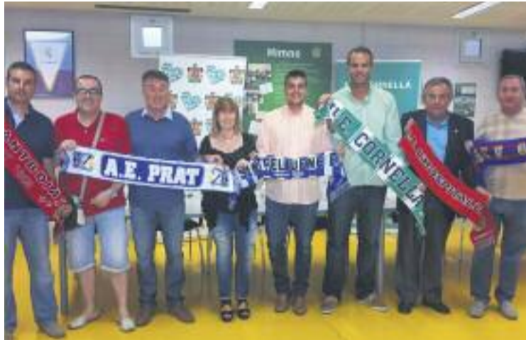
Foto de la presentació de la copa amb els presidents dels equips.

La fase de grups es jugarà els dies 11 i 12 d'agost a la tarda,