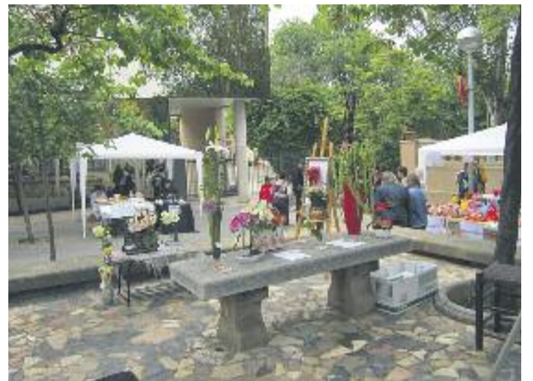
La fira se celebra mensualment a la plaça Enamorats.

Crear Cornellà també duu a terme altres iniciatives i treballa braç a braç amb altres associacions, fomentant la comunicació i l'intercanvi entre les entitats del municipi.