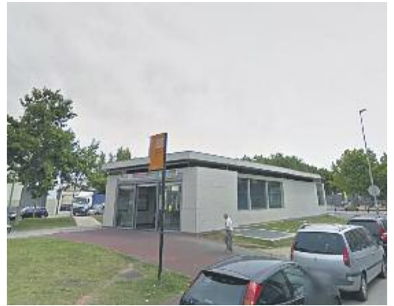
Les obres no afectaran l'usuari.

Segons han informat des de FGC, les obres es duran a terme durant els pròxims mesos i no