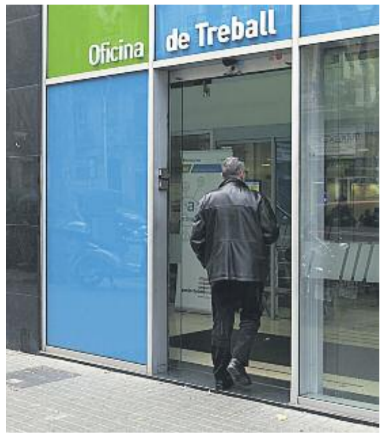
L'habitatge i l'atur, dos dels principals problemes segons l'informe del Consell Comarcal.