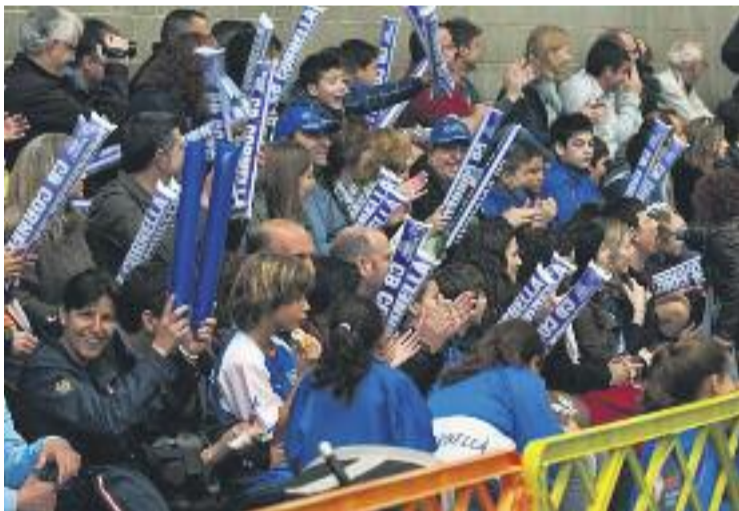
L'afició blava espera que l'equip funcioni millor l'any que ve.