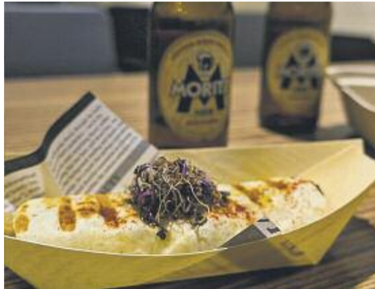
Una de les tapes servides durant les jornades.

El Quinto Tapa ha estat organitzat per l'Associació de Gastronomia i Turisme del Baix Llobregat (AGT) i ha comptat amb el suport del Consorci per a