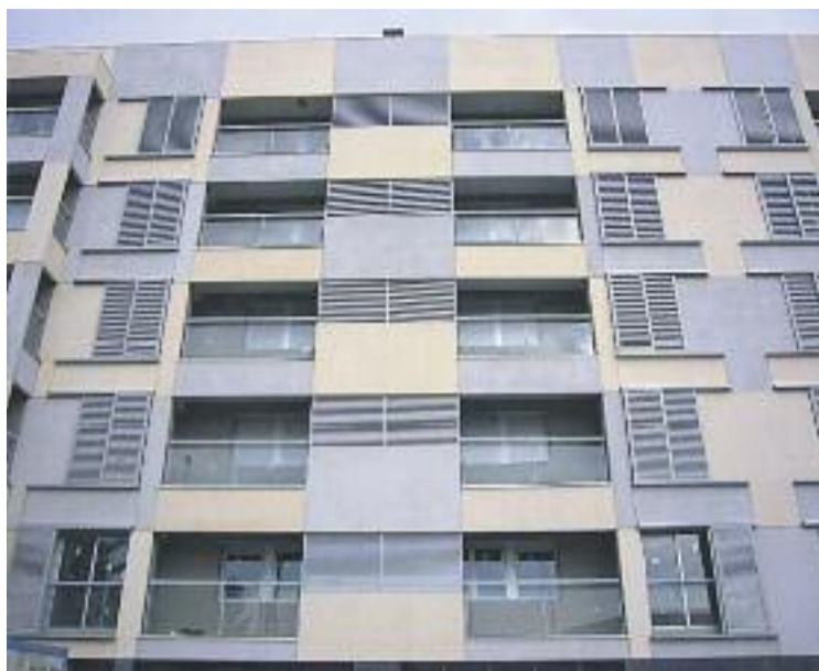
Procornellà s'encarregarà de la gestió dels pisos.

Les persones que es beneficiïn d'un lloguer d'aquestes característiques seran seleccionades pel departament d'Acció Social. Per la seva banda, Procornellà s'encarregarà de què es compleixin tots els requisits tant per part dels propietaris com dels arrendataris. També farà front als pagaments mensuals dels lloguers socials fins a l'ex-