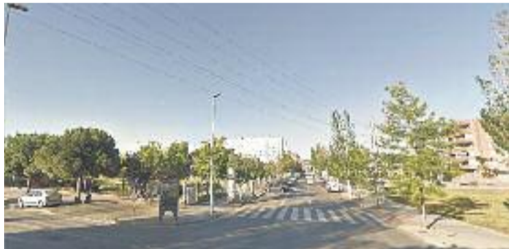
Un tram de la línia al carrer Montserrat Roig.

Està previst que les obres s'allarguin set mesos aproximadament, i consistiran en la creació d'una rasa per la qual es canalitzaran els cables de la línia. D'aquesta manera, asseguruen fonts municipals, la infraestructura energètica no estarà exposada al mal temps i s'intentarà reduir l'impacte visual i me-