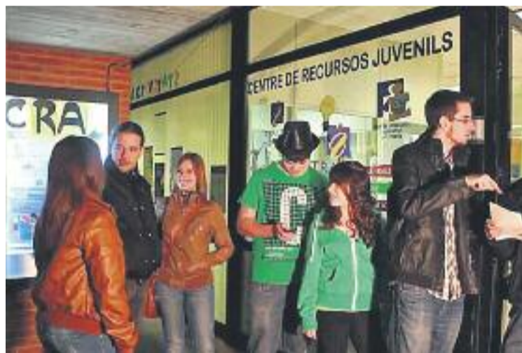
Joves durant una de les edicions de les Nits d'Insòmia.

També es faran tallers d'imatge personal i creació, del 27 al 28 de juny, el Cornellà desperta't, també l'endemà, tallers de cuina, softcombat, esports de muntanya i ball amb els diables.