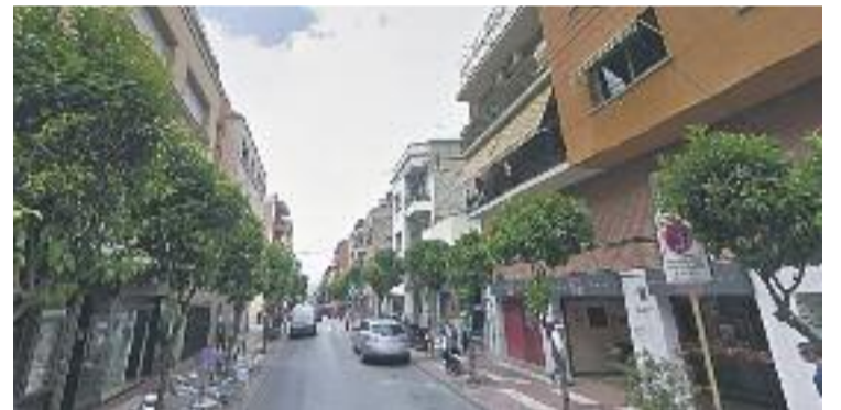
Els municipis han d'escollir dos dies més als decretats.

A banda d'aquests vuit dies per any, els ajuntaments han d'escollir dos dies addicionals més, que establiran conjuntament amb les associacions i eixos comercials de cadascun dels municipis.