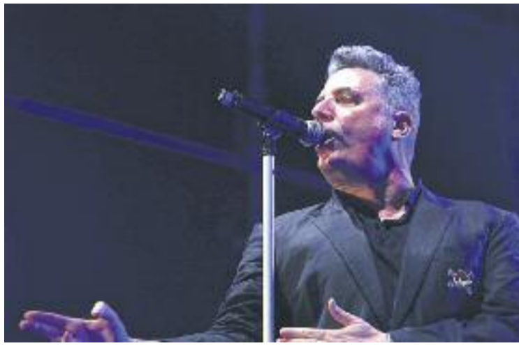
Un dels plats forts de les festes va ser el concert de Loquillo.

Diumenge dia 7 al vespre, els Pets van fer vibrar els cornellanencs. El mateix dia es va celebrar la Nit Sunday i el Festival d'Arts Urbanes, un esdeveniment pensat per als joves de la