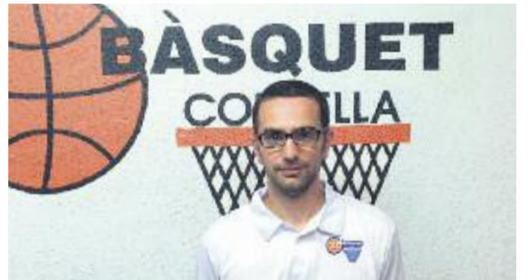
Solanes no és una cara desconeguda a l'entitat.

La composició dels grups d'EBA de la pròxima temporada es coneixeran el 3 de juliol.