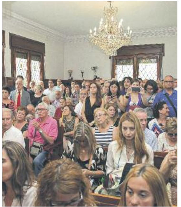
Els regidors del nou govern (esquerra) i el Ple d'investidura, que es va quedar petit (dreta).