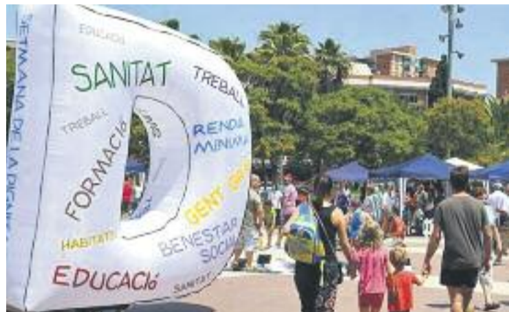
La Setmana de la Dignitat va celebrar la seva tercera edició.

SOLIDARITAT ▶ El teixit associatiu cornellanenc va fer un pas endavant contra la pobresa amb la Setmana de la Dignitat, celebrada a finals de maig, que va comptar amb més d'una vintena d'activitats reivindicatives i un nou recapte d'aliments destinats a la Botiga Solidària.