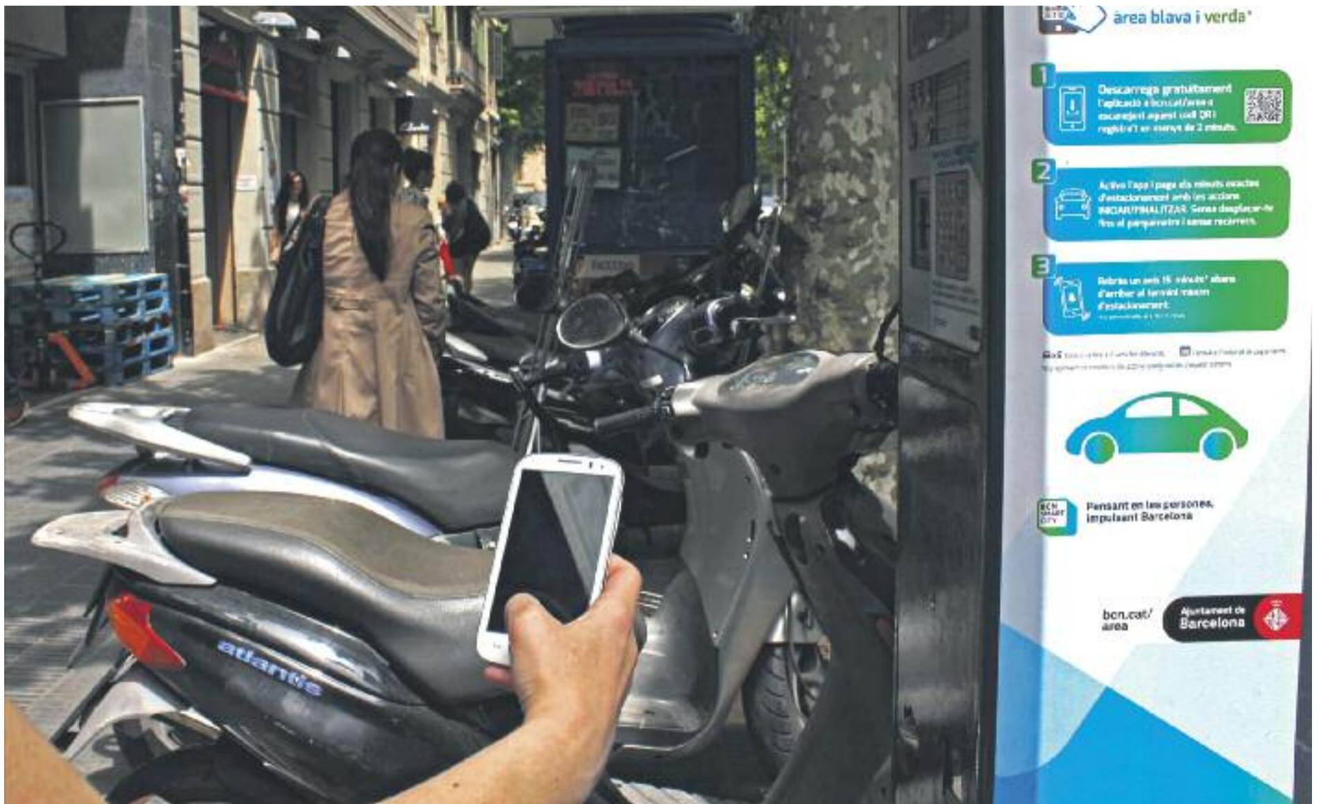
Els usuaris de vehicles de l'Àrea Metropolitana de Barcelona també podran fer servir l' apparkB .