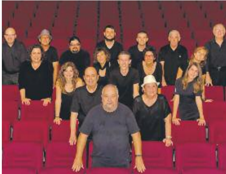
K-Mama, una de les companyies amateurs participants.

Les companyies teatrals amateurs seleccionades per participar en el concurs de teatre amateur són l'Agrupació Teatral del Casal de Calaf (Anoia) amb l'obra El Nom ; la K-Mama de Calafell (Baix Penedès) amb l'obra R.I.P. ; la companyia amateur Teatre 8 de Tarragona, amb l'obra Sóc lletja! ; l'Acte Quatre de Granollers (Vallès Oriental) amb l'obra Dansa d'agost ; Gespa Teatre de Palamós (Baix Empordà) amb l'obra Dues dones que ba-