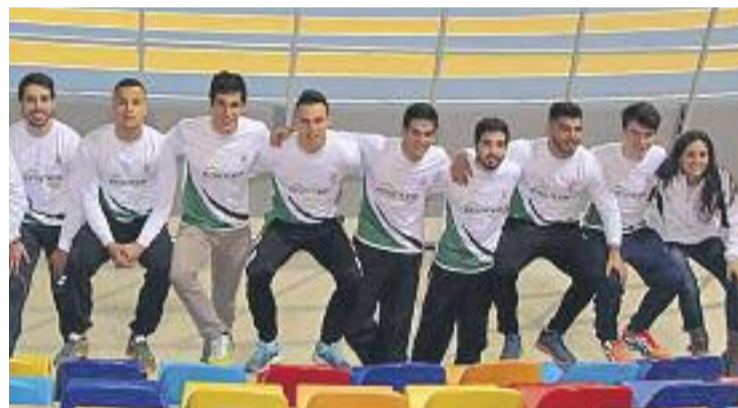
El Cornellà Atlètic va aconseguir dos èxits importants a Sabadell.