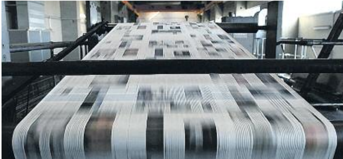
Línia és la capçalera gratuïta local no diària amb més difusió de Catalunya.