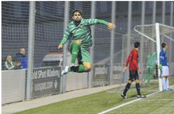
El Cornellà va dominar el joc contra el Reus.

La segona part de l'enfrontament va ser menys vistosa que la primera, amb molt de joc al mig