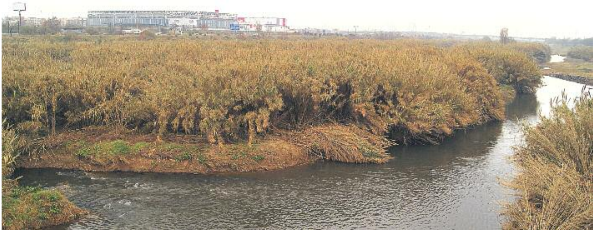
El Llobregat ha estat, tradicionalment, un riu lligat a l'activitat industrial.