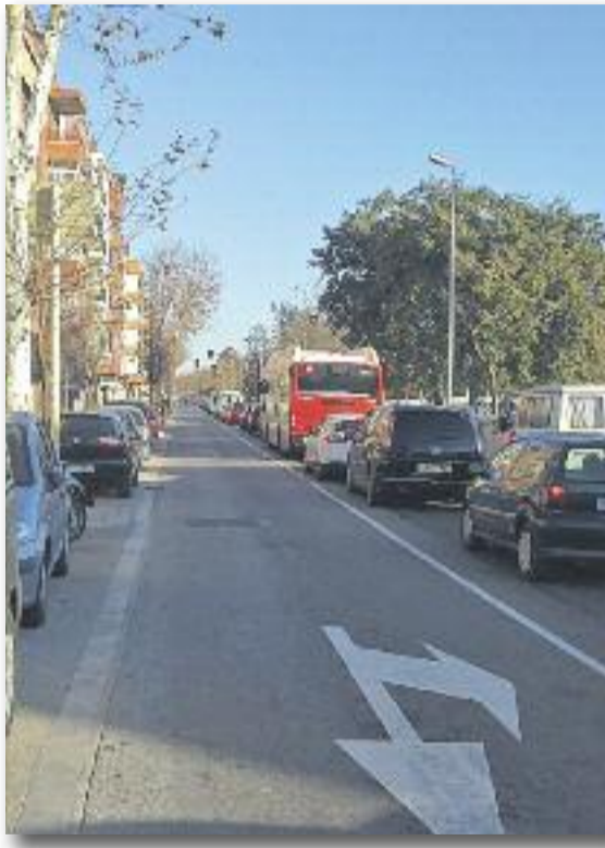
Cues a l'Avinguda Baix Llobregat