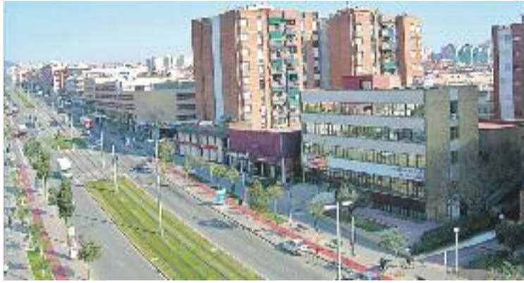
A Cornellà calen 7,6 anys de renda per pagar un habitatge.

Aquesta xifra surt d'un estudi del portal immobiliari Idelista.com, on s'ha comparat el preu mitjà d'un pis de 80 metres quadrats amb les dades de l'estudi de renda personal dels municipis i la seva distribució –publicat el passat mes de novembre per la Fundació d'Estudis d'Economia Aplicada (FEDEA)–, que mostra