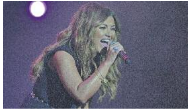
Amaia Montero actuarà a l'Auditori de Cornellà el 25 d'abril.

El 25 d'abril actuarà la cantant Amaia Montero i el 30 i 31 de maig el grup Cornellà Teatre interpretarà l'obra El retaule del flautista .