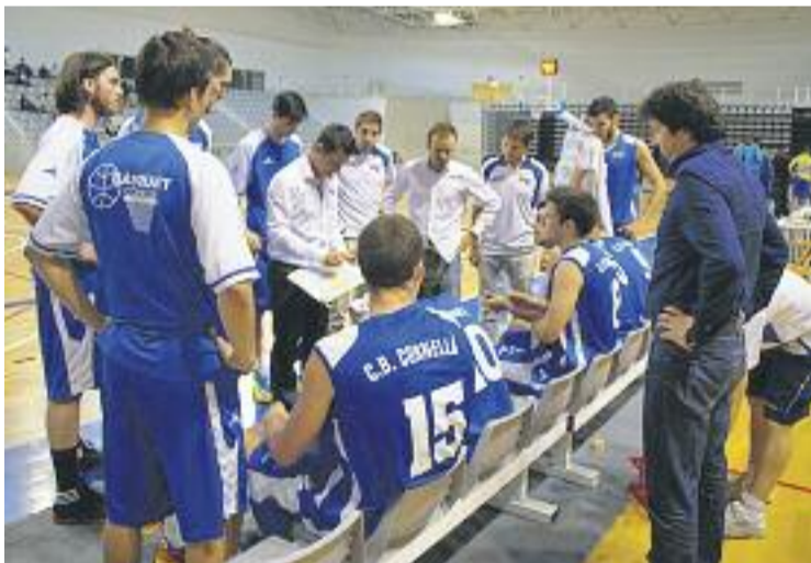
El Cornellà buscarà la victòria a Arenys aquest cap de setmana.

BÀSQUET ▶ El CB Cornellà va perdre a l'última jornada de la lliga EBA contra l'Aracena Collblanc de l'Hospitalet per 56 punts a 72. Aquesta derrota va venir just després d'una altra contra el JAC Sants al pavelló de l'Espanya Industrial, en aquest cas per 77 a 74.