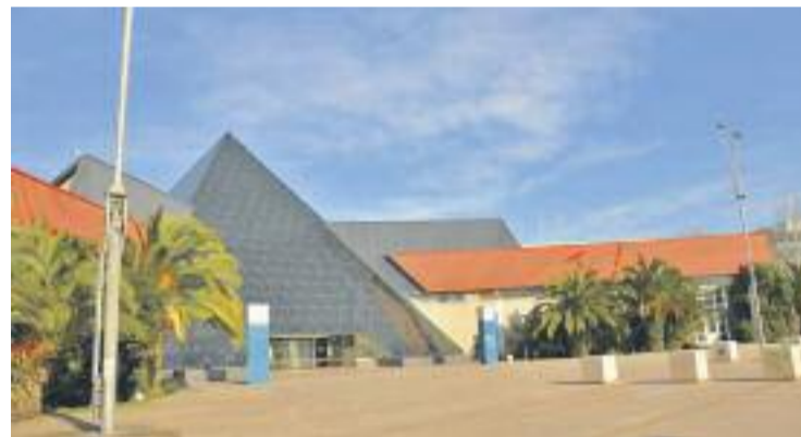
La Fira Infantil es va instal·lar al recinte de la Fira.

Una de les novetats de la passada edició va ser la instal·lació d'un espai de salut i bellesa per als més petits, i que incloïa tallers de perruqueria o massatges, entre altres propostes d'aquest àmbit.