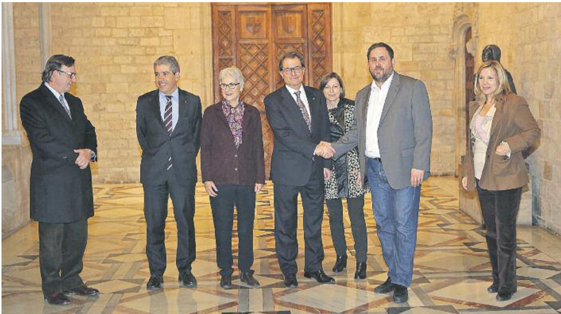
Mas i Junqueras van tornar a protagonitzar una imatge d’entesa el passat dimecres 14 de gener.

» Mas i Junqueras refan la unitat “per portar el procés de transició nacional fins a la victòria” » L’acord prioritza la creació d’estructures d’Estat des d’ara fins a les eleccions del 27 de setembre