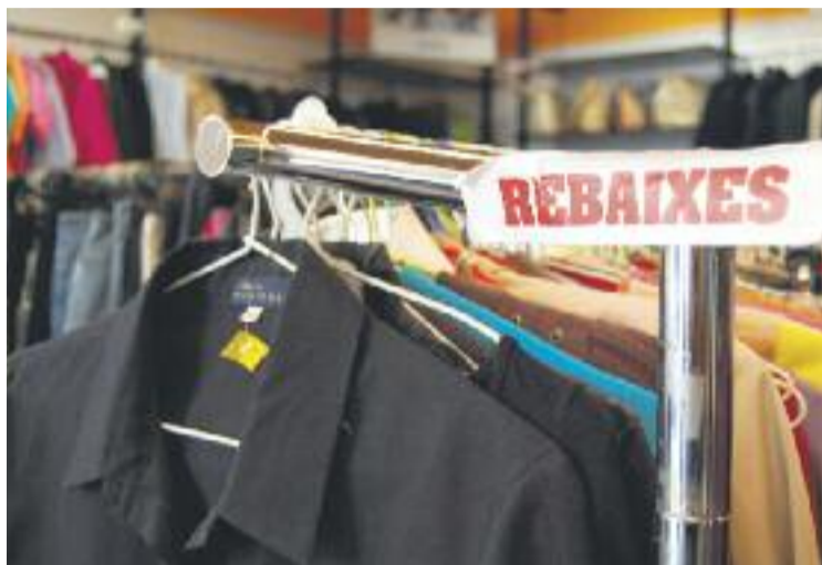
El petit comerç cornellanenc va començar les rebaixes el dia 7.

Tanmateix, la suspensió de l'alt tribunal ha dividit el sector, ja que moltes grans marques i establiments han aprofitat per fer descomptes gairebé una setmana abans. En aquest sentit, gran part del petit comerç ha optat per