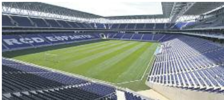
L'estadi perico està situat al barri de Riera.