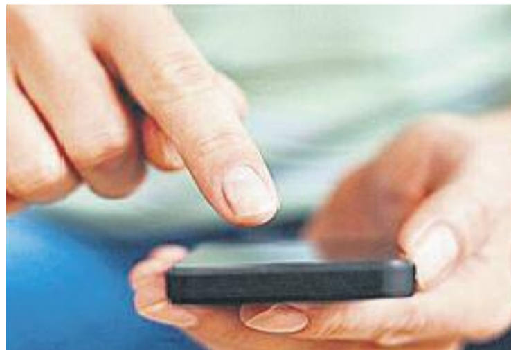
El PELL i Can Mercader compten amb més de 5.000 abonats.

Durant l'any passat es van registrar més de 61.000 usos entre abonats i entrades puntuals als dos centres esportius municipals.