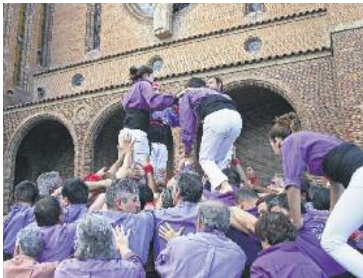
Els liles de Cornellà fan pinya en una actuació.

Durant la XXIV Diada Castellera del passat 2 de novembre, a la primera ronda els liles van descarregar aquest set de set . A aquest castell el van seguir el cinc de set , el quatre de setembre amb agulla i el va de zinc . La colla va tancar l'actuació a la plaça de l'Església amb els pillars –un d'ells caminant– davant del balcó de l'Ajuntament.