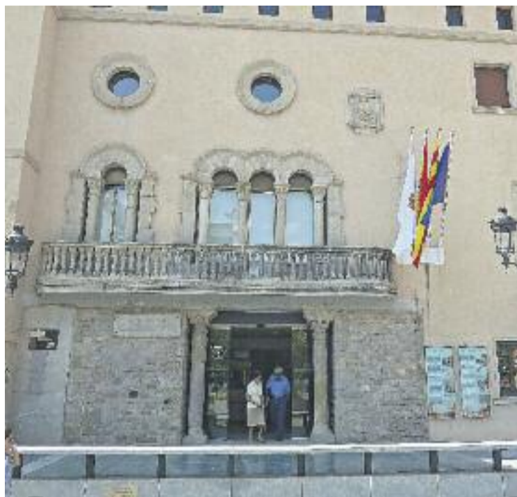
Els pressupostos es van aprovar al Ple de l'octubre.