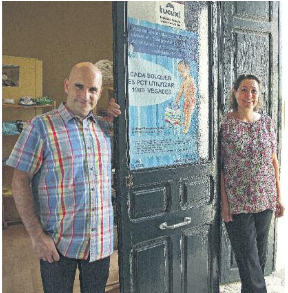
Un total de 75 empresaris han cedit a altres emprenedors la seva activitat quan l'han deixat per jubilació o altres motius.