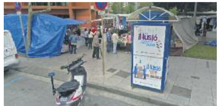
Una moto de la Guàrdia Urbana al mercat de Sant Ildefons.

SEGURETAT ▶ Els mercats ambulants del barri del Centre, Gavarra i Sant Ildefons gaudiran de més seguretat gràcies a la posada en marxa d'un nou dispositiu de la Guàrdia Urbana.