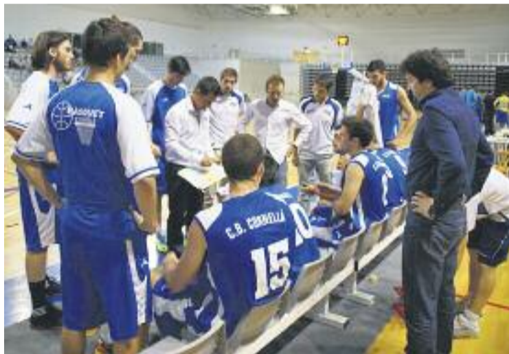
El CB Cornellà intentarà trencar la ratxa de derrotes dissabte.