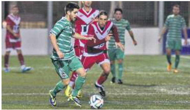
El Cornellà va rebre poc premi pel seu joc.

Després d'un inici fulgurant de tots dos equips, el matx va entrar en una fase trabada i amb molt joc al mig del camp. Amb aquest guió es va arribar al descans. A la represa, el Badalona va