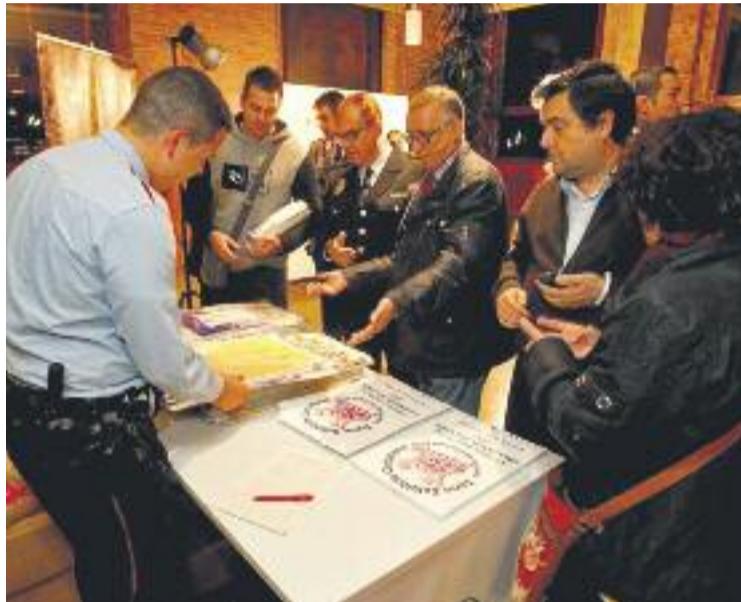
Un agent de seguretat ven el calendari a la presentació.

La iniciativa solidària, que es va presentar oficialment el passat 12 de novembre, ha estat impulsada per les forces i cossos de seguretat de Cornellà –Mossos d'Esquadra, Policia Nacional