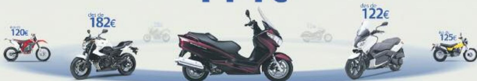
Suzuki Burgman 200. Preu anual orientatiu amb bonificació.

TERCERS AMB ASSISTÈNCIA EN VIATGE des de 114€