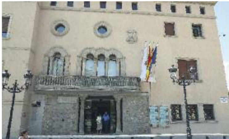
El consistori qualifica de "fet puntual" les dades d'Hisenda.

Aquest canvi s'explica perquè en les dades del 2013 s'hi ha inclòs el deute de les empreses municipals: en el cas de Procornellà, d'uns 80 milions d'euros. Amb tot, aquest deute total suposa 1.064 euros per cada cornellanenc –el deute per habitant de l'Hospitalet, per exemple, no supera els 530 euros, i el de