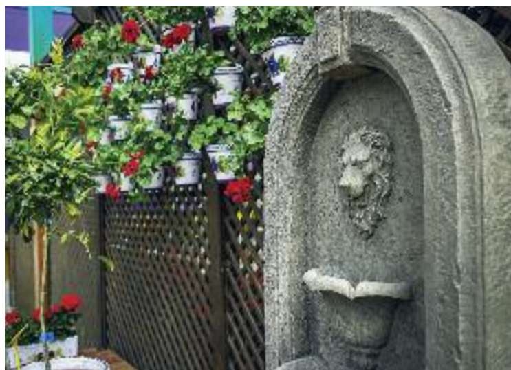
Un dels espais del Garden Cornnatur.

Tecsalsa compta amb diversos àmbits per tal d'adequar-se al màxim al perfil i capacitats de