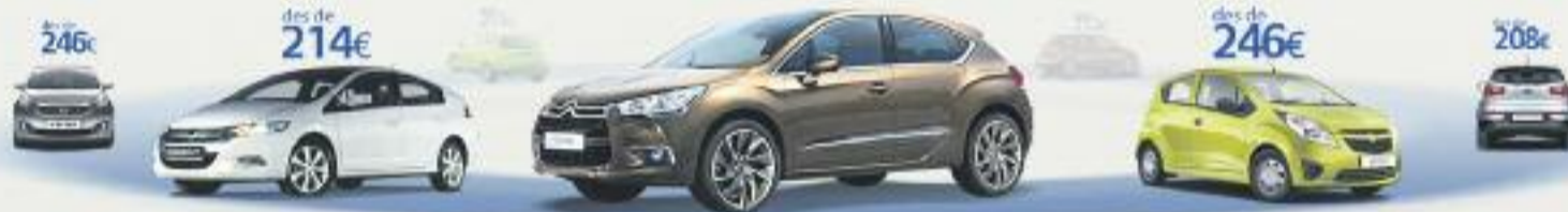
Citroën DS4-1.6 VTI 120 Design SP 120CV. Preu anual orientatiu amb bonificació.

TERCERS AMB ASSISTÈNCIA EN VIATGE des de 114€