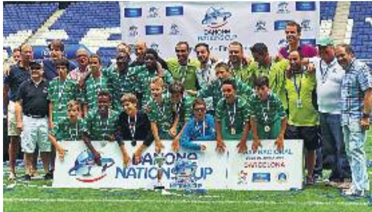
El Cornellà és el millor conjunt aleví de l'Estat.

Els joves cornellanencs van derrotar el Llevant a la final, disputada a l'estadi de Cornellà-El Prat, per 3 gols a 0. Abans, però, els de Luis Galindo van completar unes eliminatòries excel·lents, derrotant els alevins de l'Espanyol, l'Atlètic de Madrid, l'EEDD –l'equip format per l'organització del torneig–, el Tenerife i el Celta de Vigo. De fet, els alevins cornellanencs només van encaixar tres gols durant tot el campionat.