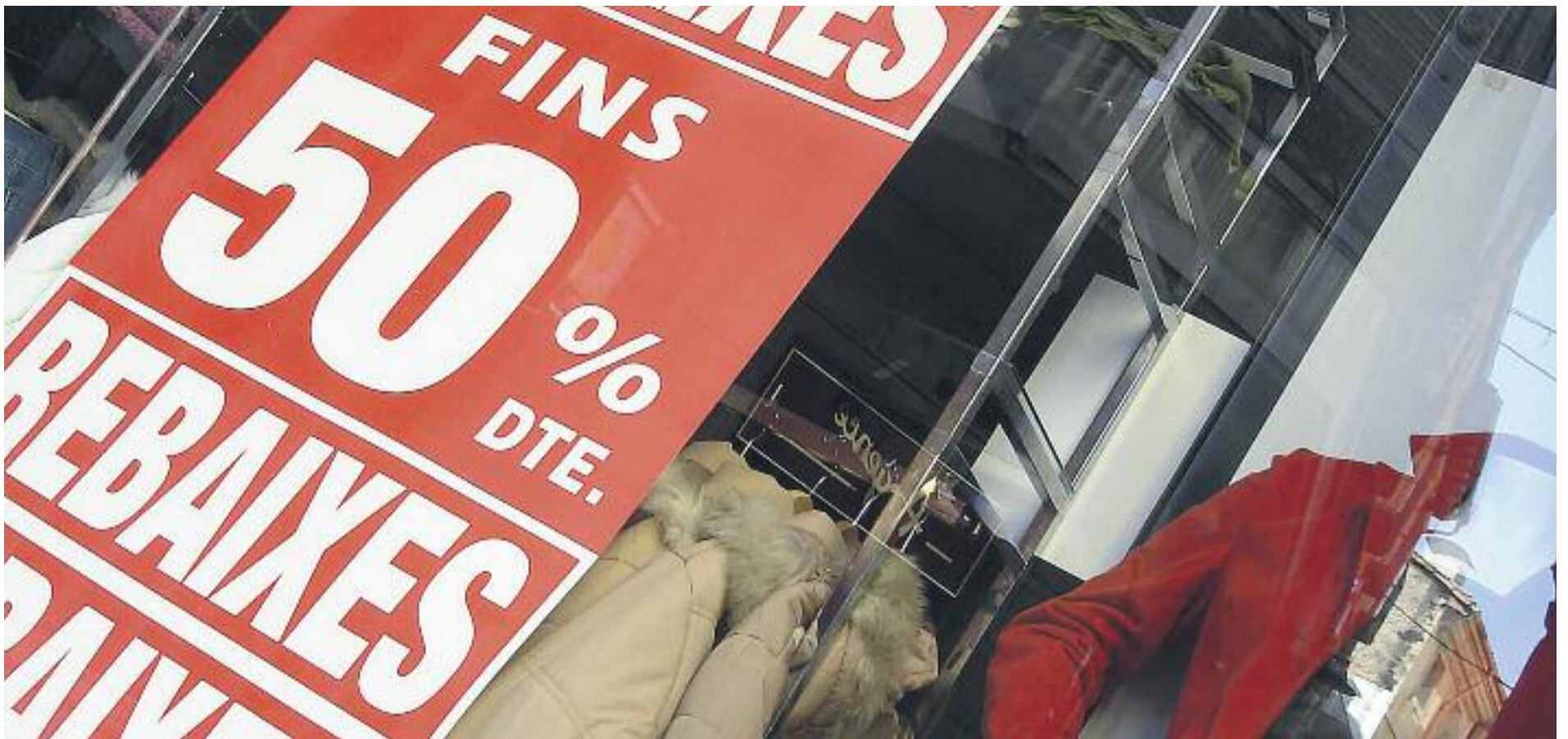
En general, els comerciants cornellanencs creuen que el sector ja ha tocat fons.