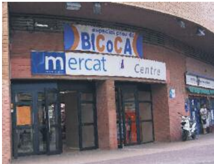
El mercat organitza diverses activitats per a infants.

Durant la ruta pel mercat, els conta contes van explicar històries als més petits a partir del què veien i experimentaven. Aquesta activitat de descoberta es va fer sobre la marxa i va servir perquè els més petits valoressin el producte fresc i aprenguessin a no malbaratar els aliments, segons expliquen des de l'entitat.