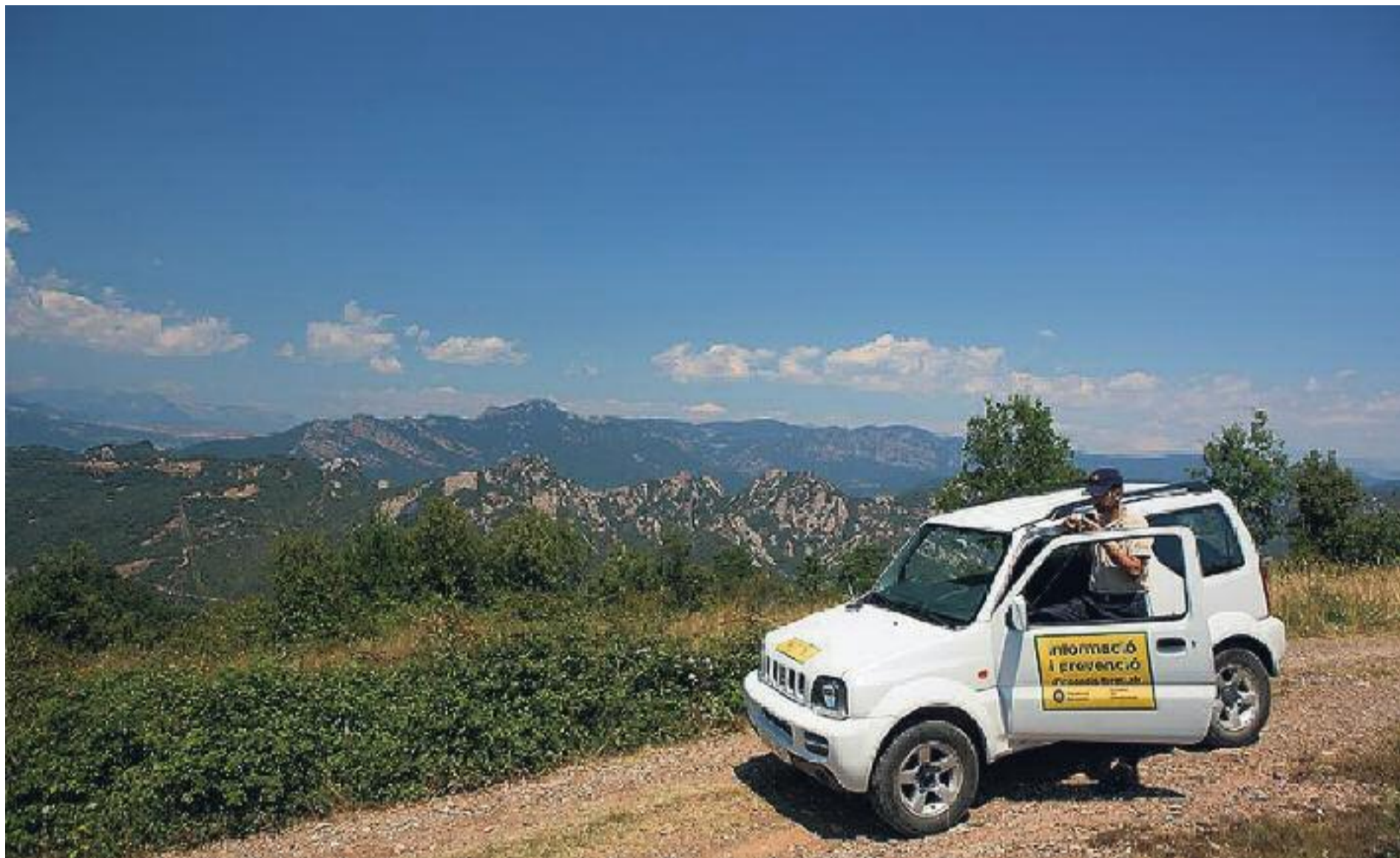
El Pla té com a finalitat principal evitar els incendis i limitar els seus efectes.