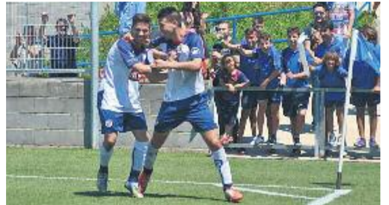
La UE Sant Ildefons militarà a Primera catalana l'any que ve.

A més, el club ja ha fet oficials els fitxatges de Gil, del Castellar; Liesegang, del Sant Joan Despí, i els juvenils Garcia i Tregón, procedents de la pedrera local.