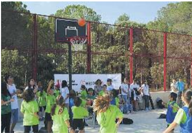
El programa 'Juga Verd Play' fomenta l'esportivitat entre els infants.

GUARDÓ ▶ El projecte Juga Verd Play , desenvolupat pel Consell de l'Esport Baix Llobregat i promogut per l'Ajuntament, va ser guardonat el juny amb els premis Compta fins a tres que atorga l'Ajuntament de Barcelona en reconeixement a projectes, entitats, centres docents, equips i tècnics de joc que han destacat pel seu treball de promoció de l'esport en edat escolar.