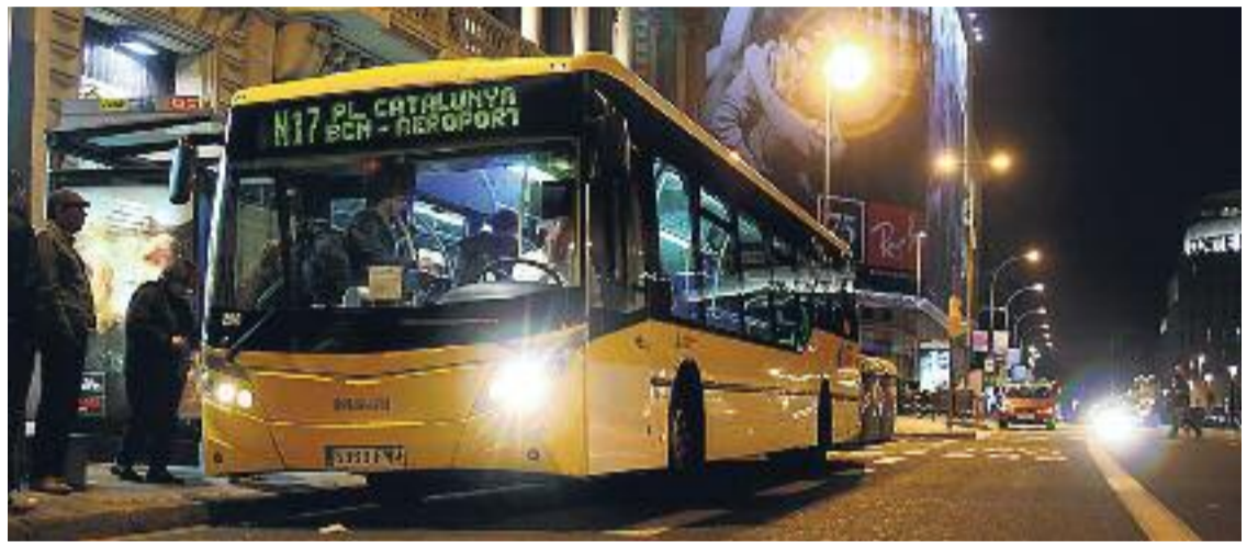
El Nitbus és un servei que uneix 18 municipis de l'Àrea Metropolitana de Barcelona.

PROP DE 6 MILIONS D'USUARIS Durant l'any passat, el nombre de passatgers que van fer servir el Nitbus va superar els 5,9 milions. D'aquests, la majoria eren persones que es dirigien al domicili particular –un 81,4% de les destinacions– o a la feina –un 10,2%–. Pel que fa als orígens dels desplaçaments, un 45,2% dels usuaris van agafar el Nitbus per tornar de la feina i un 28,8% per tornar d'una nit de festa o d'un esdeveniment esportiu. Aquest servei de transport nocturn està justament pensat per a aquests dos tipus de col·lectius –els que es mouen a