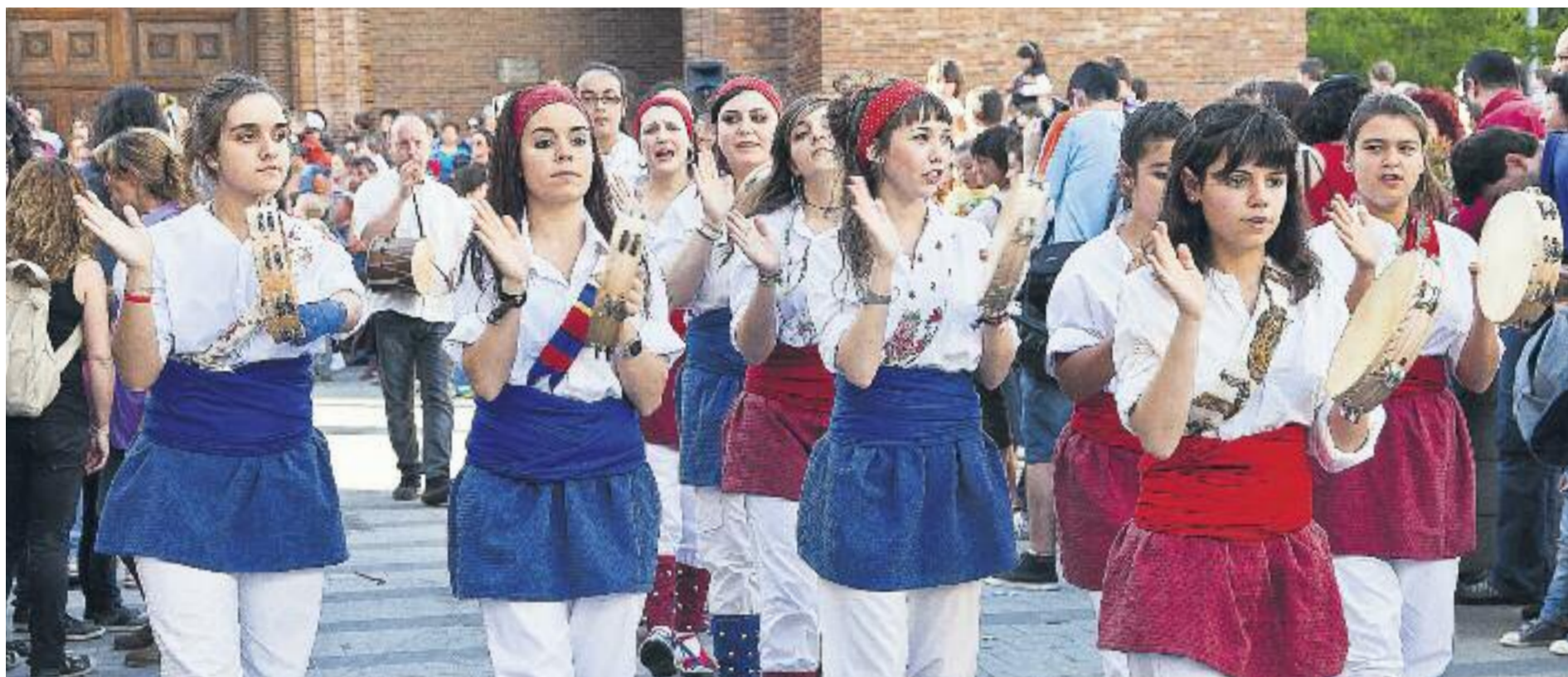
La ciutat espera amb delit l'inici de les celebracions.