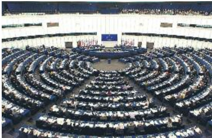
La participació en les europees a la ciutat va ser d'un 46,8%.

En segon lloc va quedar ICV-EUiA, amb 3.877 vots (un 13,71%), seguit pel PP, tercer amb 3.409 vots (un 12,05%), i ERC, que va donar la sorpresa a Cornellà triplicant els seus vots (3.231, un 11,42%) respecte a les