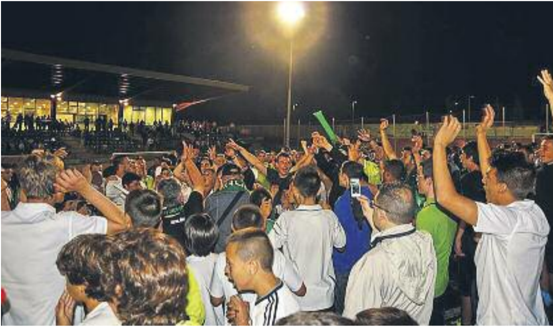
Alegria desfermada a l'estadi del Cornellà després de la victòria contra l'Izarra.