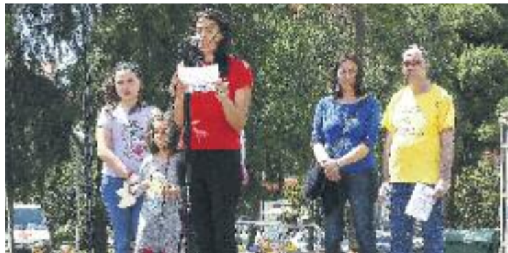
Lectura del manifest de l'acte l'any passat.

SOLIDARITAT ▶ Per segon any consecutiu, Cornellà impulsa la Setmana de la Dignitat, una ocasió per mostrar la implicació ciutadana en la lluita contra la pobresa.