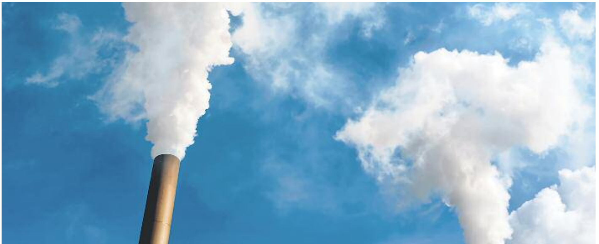
La concentració de cotxes i l'activitat industrial són les principals causes de contaminació atmosfèrica.