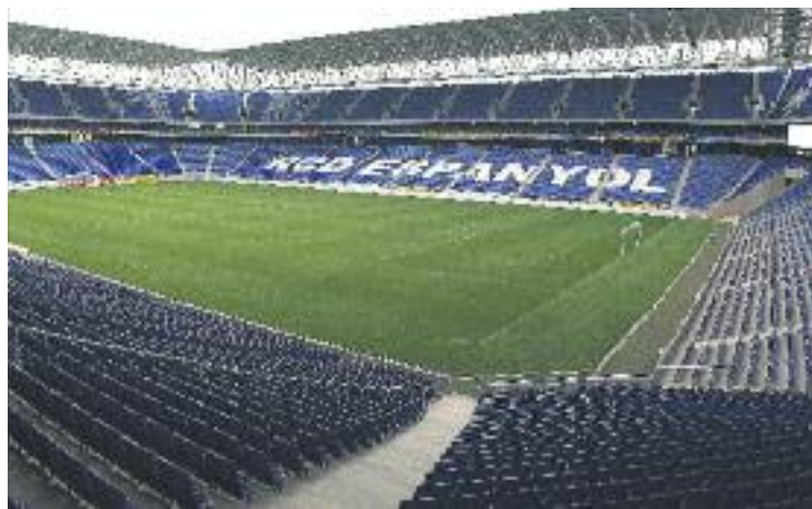
L'estadi de Cornellà-El Prat va ser inaugurat l'any 2009.

ECONOMIA ▶ Segons va avançar el diari La Grada, l'Ajuntament de Cornellà ha decidit posar a la venda el paquet accionarial que té del RCD Espanyol. Segons la nova Llei de Racionalització i Sostenibilitat de l'Administració Local (LRSAL), que va aprovar al desembre el govern central, les empreses municipals, en aquest cas Procornellà, no poden disposar d'accions d'altres empreses i, per tant, s'han de vendre per complir amb la normativa.