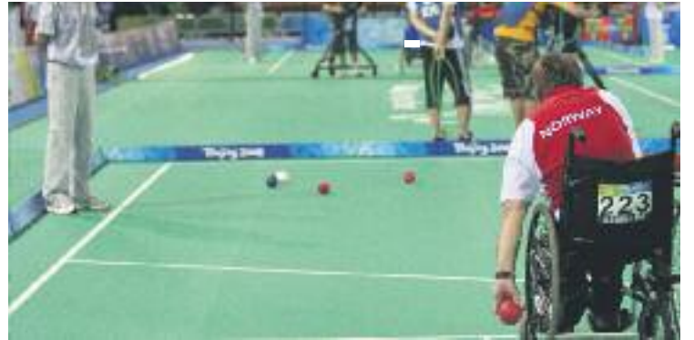
La boccia és un esport molt similar a la petanca.

La boccia és un esport que es remunta a la Grècia clàssica, molt similar a la petanca, que va ser rescatat als països escandinaus durant els anys 80.