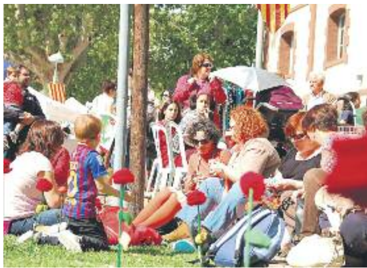
La Jordiada s'ha consolidat com una gran festa local.

Un dels plats forts de la celebració de la Jordiada va ser la commemoració del Commemorem el