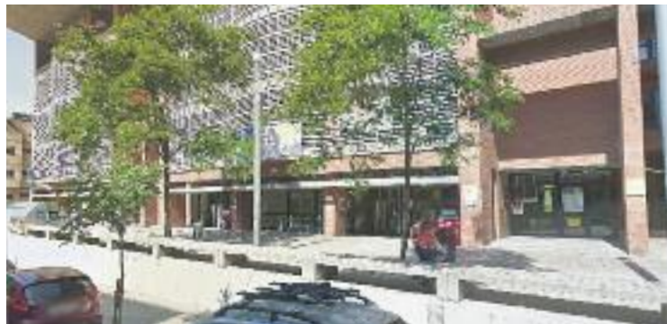
Seu del Síndic de Greuges de Cornellà.

Tal com explica Barrera a la memòria, les queixes sobre l'en-