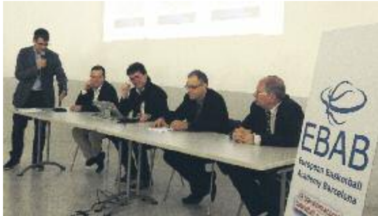
Moment de la presentació de l'estada estiuenca.

Els participants es dividiran en dos grups: el Pro, amb les fu-