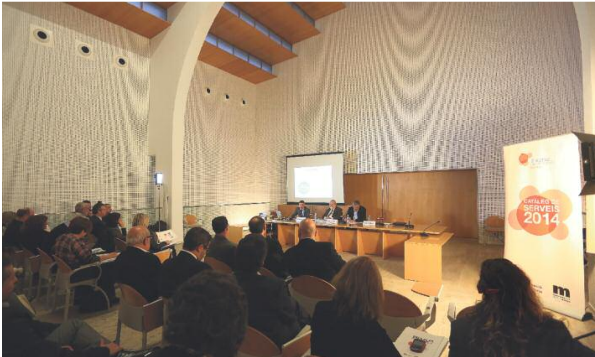
El president de la Diputació, Salvador Esteve, va visitar tota la província per presentar els serveis oferts als governs locals.

Les inversions al territori són fruit del treball en xarxa entre els governs locals i la Diputació per tal de dotar de la màxima autonomia els ens locals. Aquestes inversions van des de les previstes al Catàleg de Serveis, a ajudes d'urgència social, ajudes al transport escolar, programes de crèdit local, assistència financera i les meses de concertació.