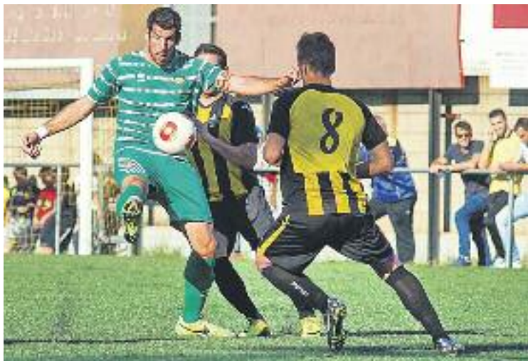
El Cornellà va aconseguir un punt important a Nou Barris.