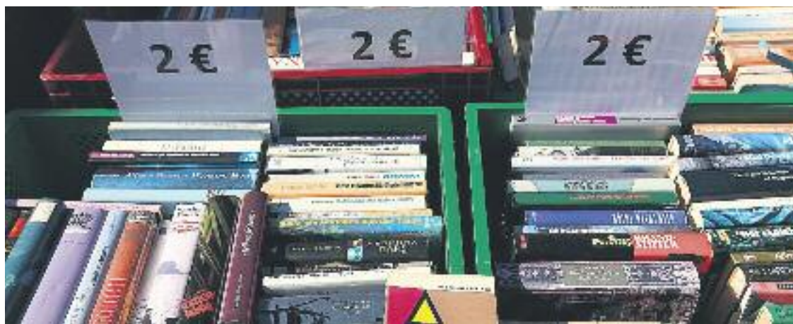
Els mercats d'intercanvi col·laboraran amb la Botiga Solidària.

El 3 de maig es farà el primer mercat d'aquest tipus al parc de la Infanta, situat al barri Font Santa-Fatjó; el segon tindrà lloc el pròxim 13 de juliol a la plaça d'Almeda la Vella, ubicada al barri Almeda; el 20 de setembre es farà un mercat d'intercanvi a la plaça d'Europa, al barri la Gavarra; l'11 d'octubre, a la plaça de Sant Ildefons, al barri Sant Ildefons; i el 22 de novembre la jornada comercial d'intercanvi i segona mà es farà a la plaça de l'Església, al barri Centre. Sobre el seu horari, tots els mercats se celebraran de deu del matí a dues del migdia. Els primers dos mercats estaran organitzats per Asociación Es-