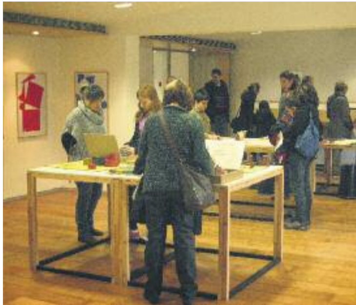
Una de les activitats relacionades amb les matemàtiques.

I és aquí on es troba el malentès: l'MMACA va emetre un comunicat que situava Cornellà com "la primera ciutat que