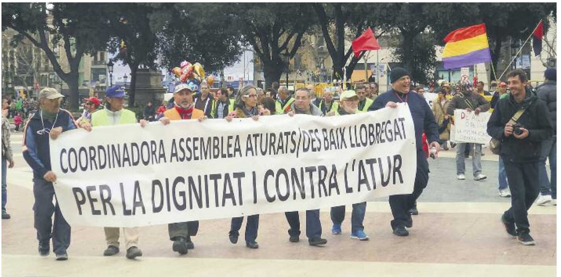
La marxa va recórrer gairebé tots els municipis del Baix Llobregat, passant també per Cornellà.