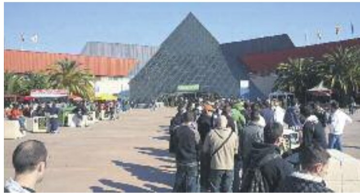
L'Ajuntament és 100% propietari de Procornellà.