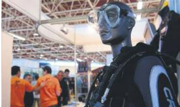
Un dels estands del Mediterranean Diving .

Als estands s'hi han pogut veure materials d'última generació, s'han ofert packs de vacances amb sortides de busseig (entre els destins per practicar submarinisme destaca el Mar Roig, les Maldives o les illes Filipines) i s'han fet demostracions d'apnea estàtica. Aquests,