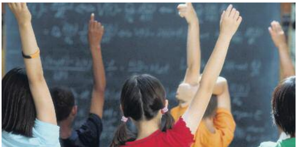
Tota la informació sobre la preinscripció escolar es pot consultar a gencat.cat/preinscripcio .

La documentació que cal presentar és l'original i la fotocòpia del llibre de família o altres documents relatius a la filiació, i l'original i la fotocòpia del DNI de la persona sol·licitant (alumne major de divuit anys, mare, pare o tutor) o de la targeta de residència on consta el NIE, si es tracta de persones estrangeres. Les dades d'identificació o filiació per a infants estrangers poden acreditar-