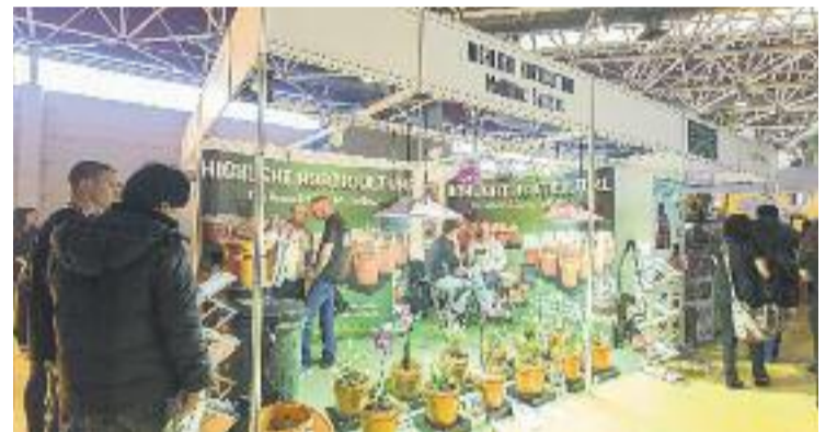
Una de les 500 empreses participants.

A la mostra s'hi va poder trobar una àmplia gamma de productes relacionats amb la planta del cànnabis, tant per al seu consum com a droga (com a producte terapèutic o d'oci) com per a la seva utilització industrial.