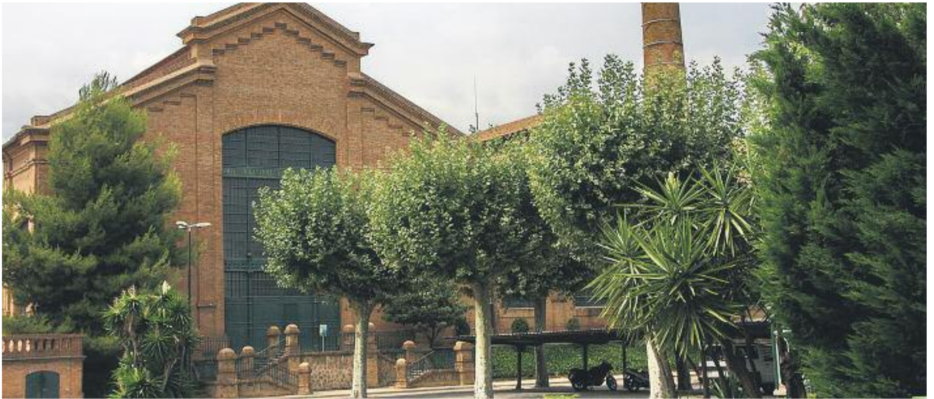
El Consorci de Turisme del Baix Llobregat ofereix vals de descompte per visitar el Museu de les Aigües de Cornellà.