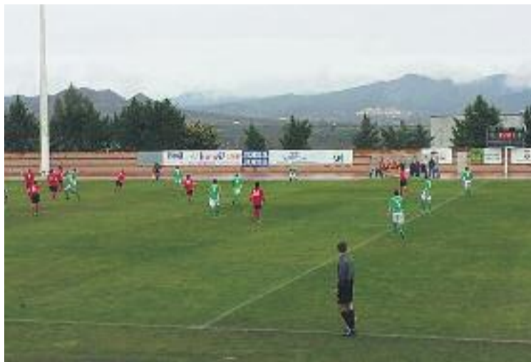
La UE Cornellà ocupa la cinquena posició a la classificació.

La primera meitat del matx no va oferir cap gol, i els aficionats presents al camp de l'Ascó van haver d'esperar a veure algun gol a la represa, quan una centrada des de la banda dreta de Seri Moreno era aprofitada per Canadell, que marcava el primer gol a plaer. L'1 a 0 va fer molt de mal al Cornellà, que no