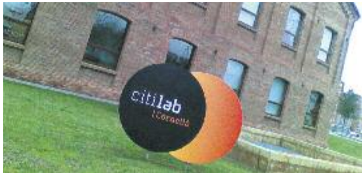
El Citilab també ofereix serveis d'assessoria a emprenedors.

Les ajudes, batejades com a Quota Zero i que s'implementen a Catalunya per primera vegada, bonificaran fins al 100% d'impostos com ara l'IBI o el de vehicles, i en taxes de recollida de residus o de serveis urbanístics, entre d'altres, als joves emprenedors de menys de 35 anys empadronats a Cornellà que vulguin desenvolupar la seva empresa a la ciutat.