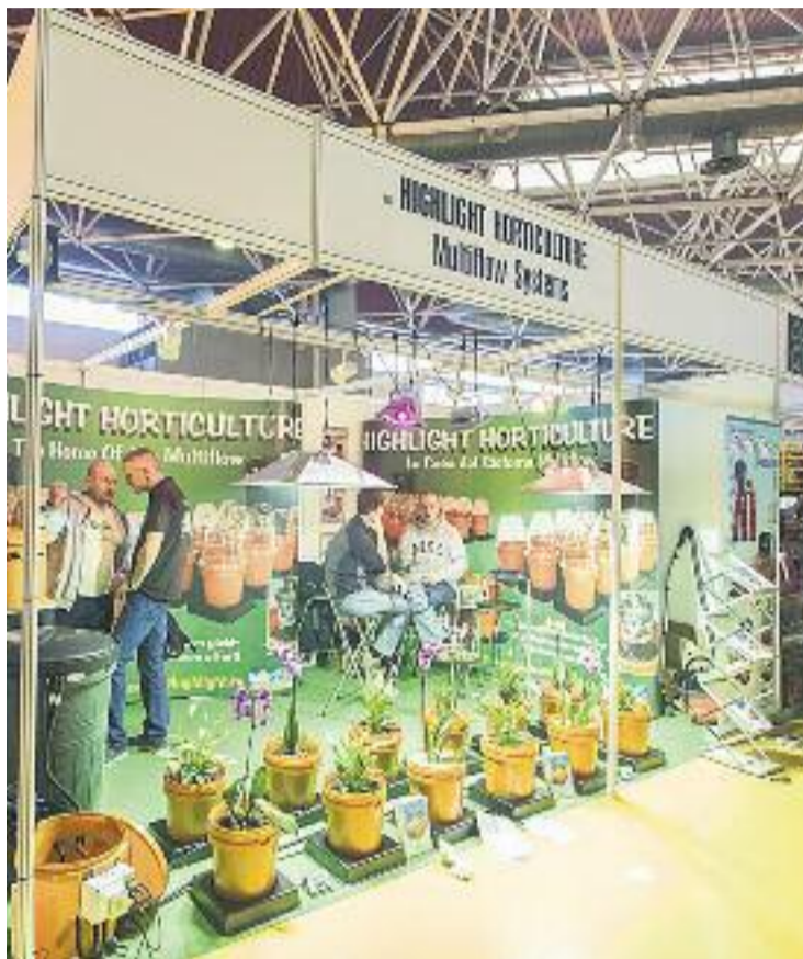
Un estand del saló Spannabis a la Fira de Cornellà.

Els visitants poden trobar des de llavors per al cultiu privat de cànnabis fins a materials i instruments per a cultivar-lo, entre molts altres productes relacionats.