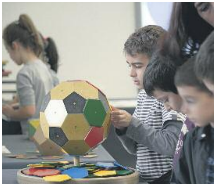
El museu aull activitats per a escolars.

El Museu de Matemàtiques de Catalunya està promogut per una associació de docents en actiu. El centre també compta amb el suport i la participació d'altres professionals, ja jubilats, de tot Catalunya. Així, des de l'inici, el projecte museístic compta amb un important vessant formatiu i didàctic.