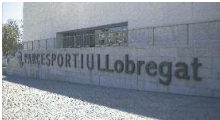
El Parc Esportiu va acollir la presentació del CB Cornellà.

Els locals van tornar a disputar un matx més aviat fluix, i van cedir la que ja és la quarta derrota consecutiva. Els blaus tanquen, d'aquesta manera, la primera volta de la lliga amb un balanç total de quatre victòries i sis derrotes.