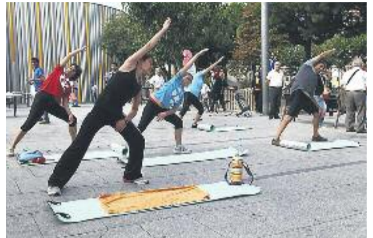
Pavelló municipal Sergio Manzano.

Aquest programa municipal té com a objectiu promoure els hàbits de vida saludable entre la població cornellanenca mitjançant activitats dirigides per monitors i experts. Fins al mes d'abril, i inclosos els caps de setmana, hi ha programades activitats a tota la ciutat.