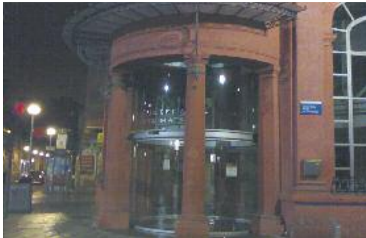
La façana de la biblioteca recorda l'antic cinema Titàn.

Tot són bones dades per a una biblioteca que només el primer trimestre de 2013 va presentar 55 propostes de tot tipus de disciplines culturals i de divulgació. La recompensa dels usuaris no es va fer esperar: durant el primer trimestre de 2013 el nombre d'u-