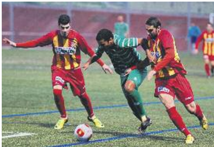
El Cornellà es col·loca tercer amb 41 punts.