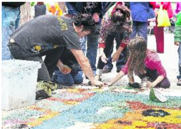
El civisme és tasca d'adults i infants.

Per fomentar el civisme, l'Ajuntament de la ciutat també va realitzar el passat 20 de gener la conferència Civisme: Ètica necessària , a càrrec del doctor Josep Ramos.