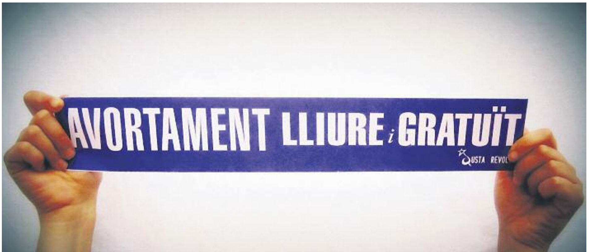
La nova reforma de la llei de l'avortament ha generat una forta controvèrsia.