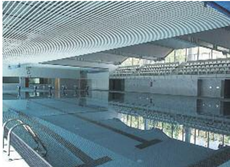
Una de les piscines de la instal·lació.

Prèvia inscripció en la recepció del centre, els visitants van poder gaudir de classes de Body Jump , una pràctica que es basa en la utilització d'una petita cama elàstica per fer exercici aeròbic. A més, l' spinning o el zumba tampoc van faltar a les jornades festives. En l'àmbit dels esports aquàtics, el Complex Esportiu Can Mercader va oferir classes d' aquafit , una modalitat que con-