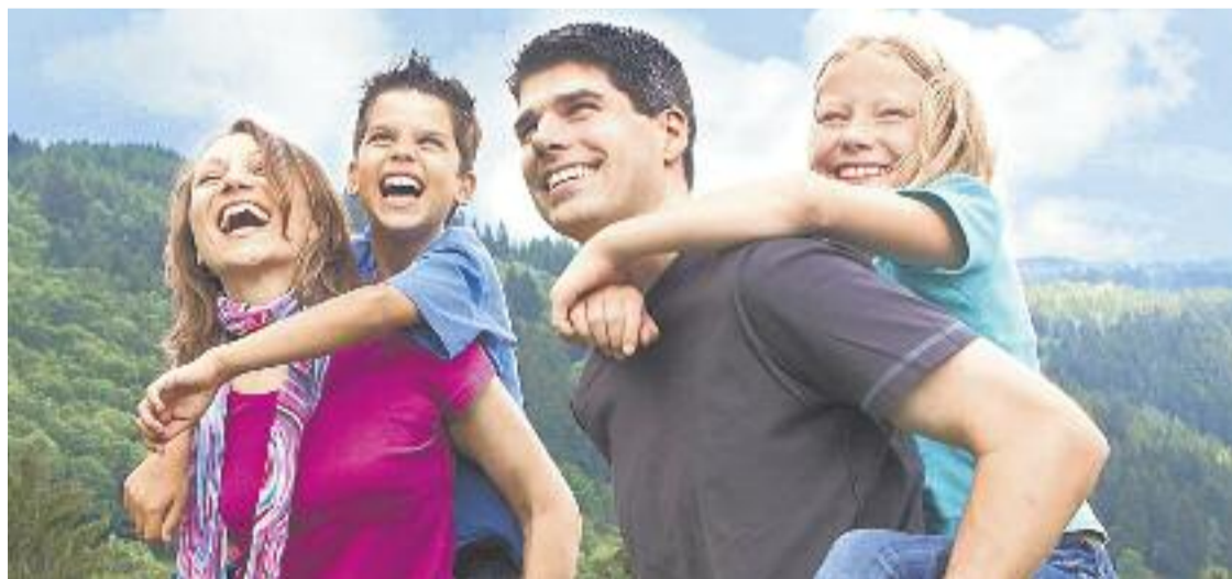
El programa Vacances en família arriba a la desena edició.

La primera convocatòria del programa Vacances en família és per a estades entre el mes de març i setembre. El període de preinscripció serà del 3 fins al 24 de febrer i les preinscripcions es podran fer per internet. Enguany hi ha nous albergs disponibles i una nova eina de gestió de reserva i preinscripció.