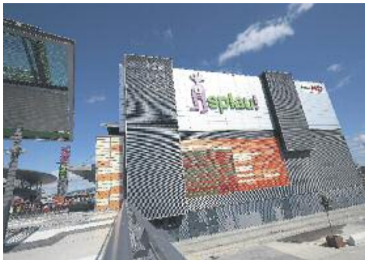
L'Splau celebra unes dades de visites i vendes molt bones.

Aquest increment de vendes i visites és la resposta natural a una forta inversió dels responsables del centre comercial, que durant l'any 2013 van invertir 15