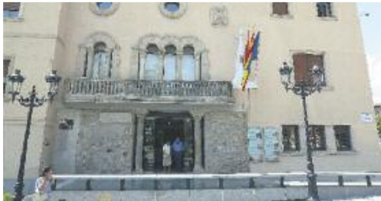
El pressupost de l'Ajuntament augmenta en un 8%.

Pel que fa estrictament al pressupost del consistori, aquest supera els 70 milions d'euros i suposa un increment de més del 8% respecte als pressupostos del 2013. Una quantitat de diners que, segons el govern municipal encapçalat per Antoni Balmón, serviran per impulsar les actuacions municipals encadrades a cinc eixos: l'ocupació, l'e-