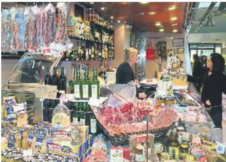
Qualsevol tipus de comerç treu profit de les xarxes.

Els cursos mostraran com s'utilitzen i com treure el màxim profit de les principals xarxes socials: Facebook, Twitter, LinkedIn i Google Alerts. Aquesta iniciativa s'emmarca dins del