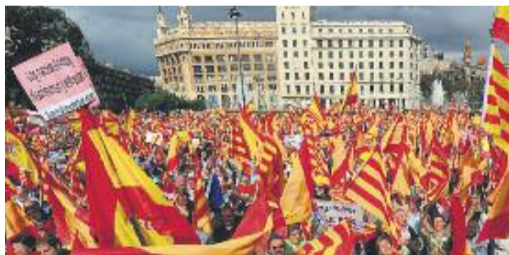
Molts cornellanencs van participar a la manifestació del 12-O.