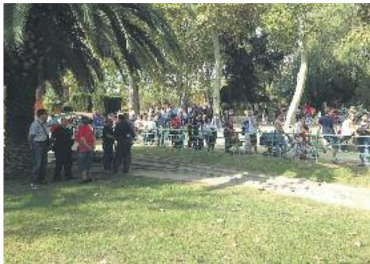
La Festa del Trenet va comptar amb una bona assistència.

A partir de dos quarts d'onze del matí es van iniciar les circulacions lliures del trenet petit que creua el parc de Can Mercader. I a partir de dos quarts de dotze van començar a sortir els primers trens oficials de la diada. La jornada de viatges ferroviaris només va quedar interrompuda pel dinar de germanor al parc. Un cop finalitzat, va tornar la circulació lliure dels trenets fins a les vuit de la tarda, hora en què es va cloure l'acte.