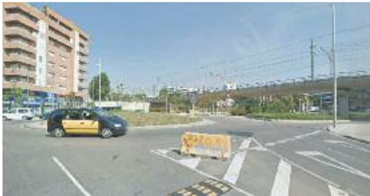
Un dels punts afectats a l'avinguda dels Alps.

L'objectiu del Consistori és mantenir el model de ciutat cohesionada i la xarxa de serveis públics locals creats en els darrers anys. Per fer-ho, el PAUM defineix actuacions que permeten impulsar el creixement futur des