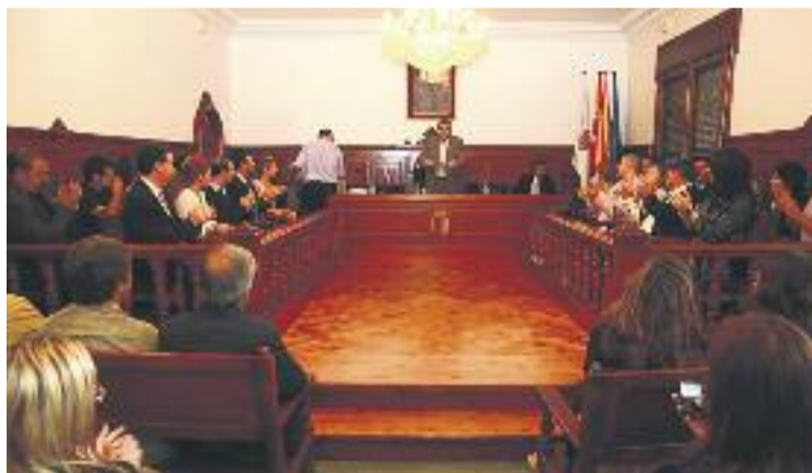
El Ple de Cornellà no debatrà sobre el dret a decidir a la ciutat.

Més enllà de consideracions polítiques, el PSC de Cornellà defensa la seva postura argumentant que el Reglament d'Ordenament Municipal (ROM) no permet aquest tipus de votacions. Aquest reglament, que va ser aprovat l'any 2000 quan José Montilla era alcalde de la ciutat, esmenta a l'article 133 que "no es poden presentar mocions sobre assumptes que excedeixin la competència municipal". Jordi Rosell, portaveu