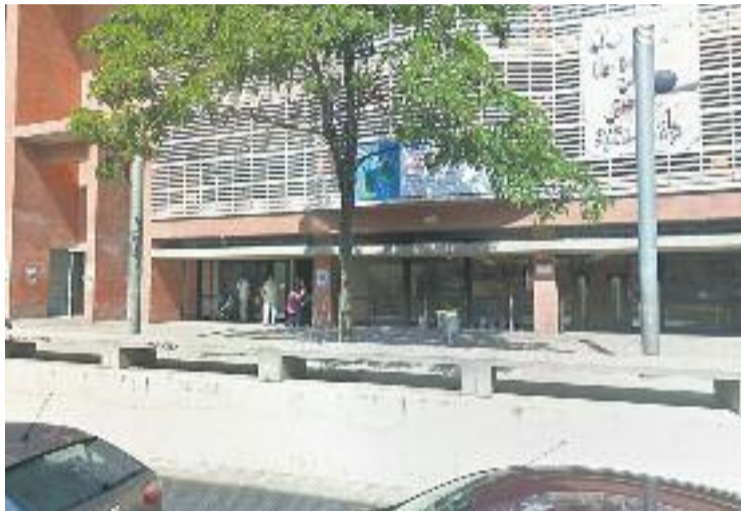
Centre Cívic Juan García-Nieto.

NECESSITATS DELS MALALTS Més enllà dels tractaments que reben, els malalts de càncer necessiten molt de suport i seguiment, per part de familiars però també d'especialistes.