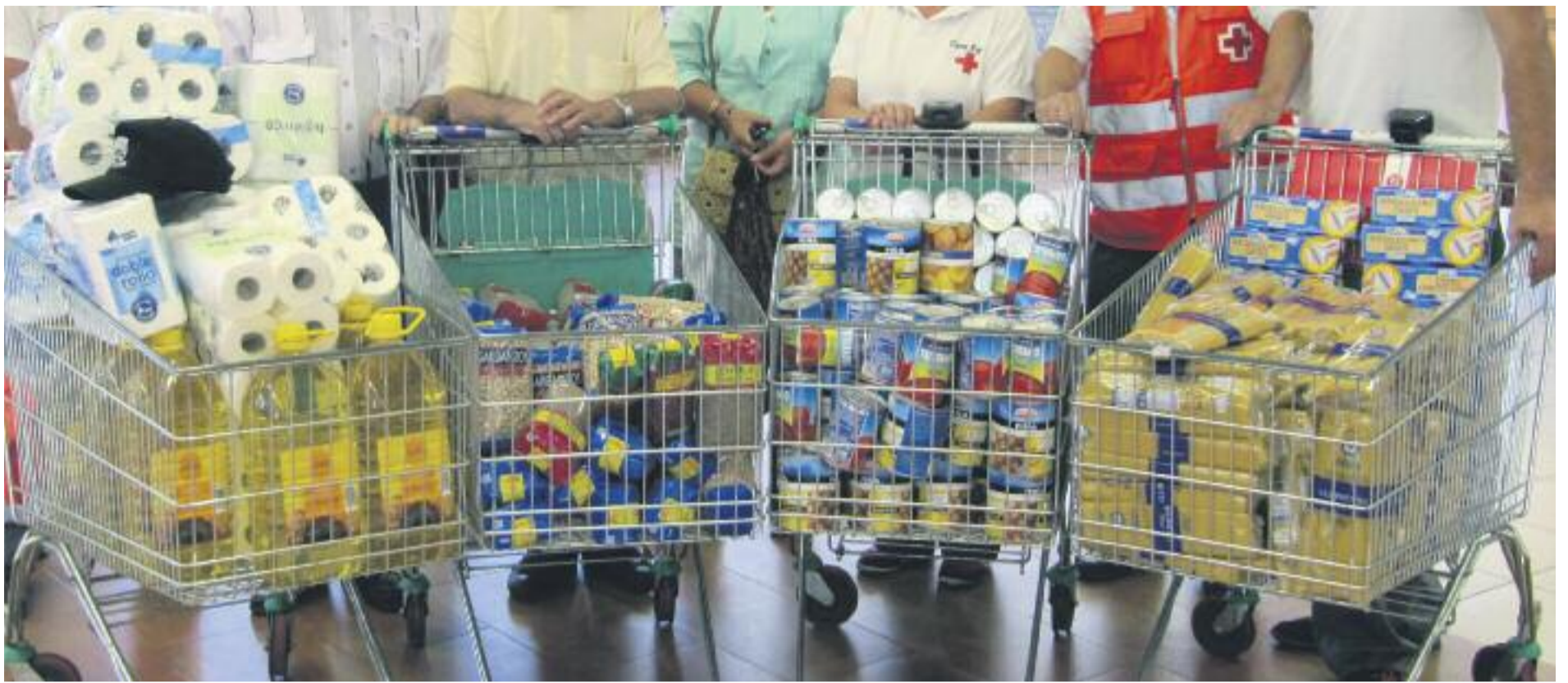
Recapte d'aliments en un supermercat.