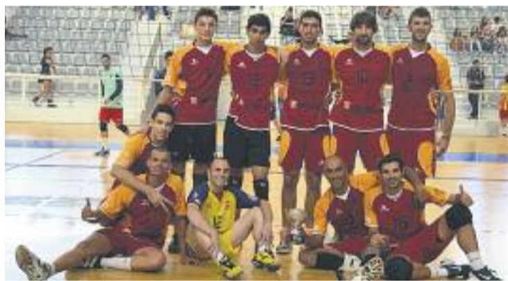
El CV Andorra, campió de la Lliga Catalana 2013.

VÒLEI ▶ El Parc Esportiu de Cornellà va acollir el passat diumenge 6 d'octubre la final a tres de la Lliga Catalana de vòlei, on el CV Andorra es va proclamar nou campió de la competició.