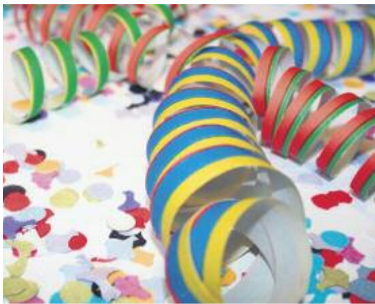
Les festes de Gavarra se celebren sempre al setembre.

L'endemà van començar els actes purament festius com diferents tornejos esportius, entre els quals destaca el de petanca i la prova ciclista de la plaça Europa, cercaviles, actuacions de pallasos i una exhibi-