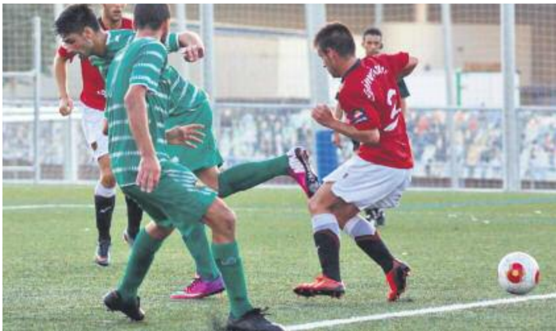
Moment del partit contra la Poble de Mafumet a la tercera jornada.