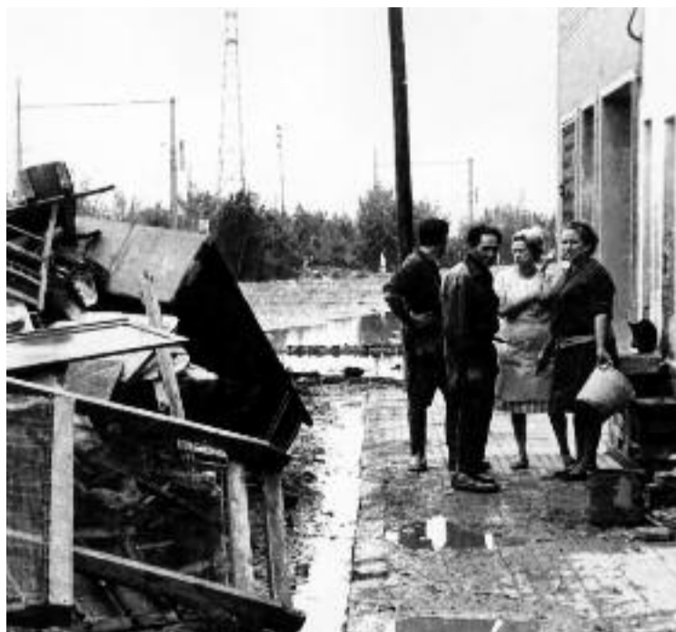
Moment de la riuada al seu pas per Almeda.