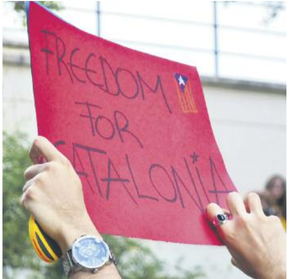
La Via Catalana va ser tot un èxit.