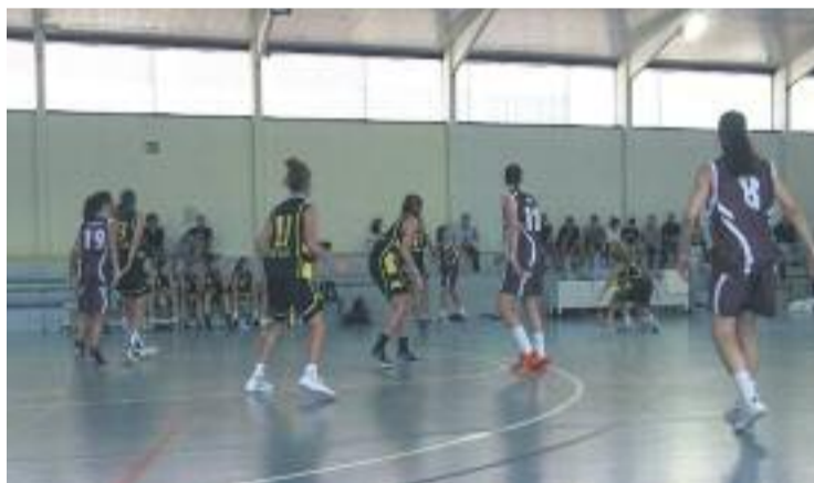
El Bàsquet Almeda va perdre a casa del Sant Adrià.

BASQUETBOL ▶ L'equip sènior femení del Club Bàsquet Almeda va jugar el primer partit de la seva història de Copa Catalunya, la màxima competició del bàsquet català.