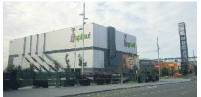
Els cinemes de l'Splau volen convertir-se en els millors del país.

CINEMA ▶ El cinemes Full HD del centre comercial Splau, al barri de la Riera, estrenen aquest mes 10 noves sales que se sumaran a les 18 actuals.