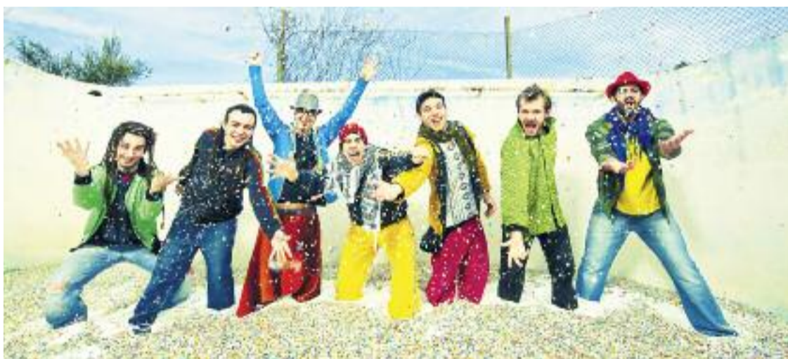
La Pegatina és una de les formacions que va actuar per les Festes del Corpus 2013.

Aquests dies s'estan celebrant les Festes Majors d'Almeda (del 13 al 21 de juliol). La festa se celebra a una pista de bàsquet i futbol sala del barri, al carrer Sant Ferran. Allà es fan totes les activitats (llevat enguany, que