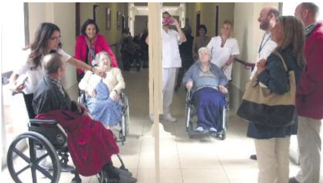
Imatge del centre que SARquavitae gestiona a Jerez de la frontera.