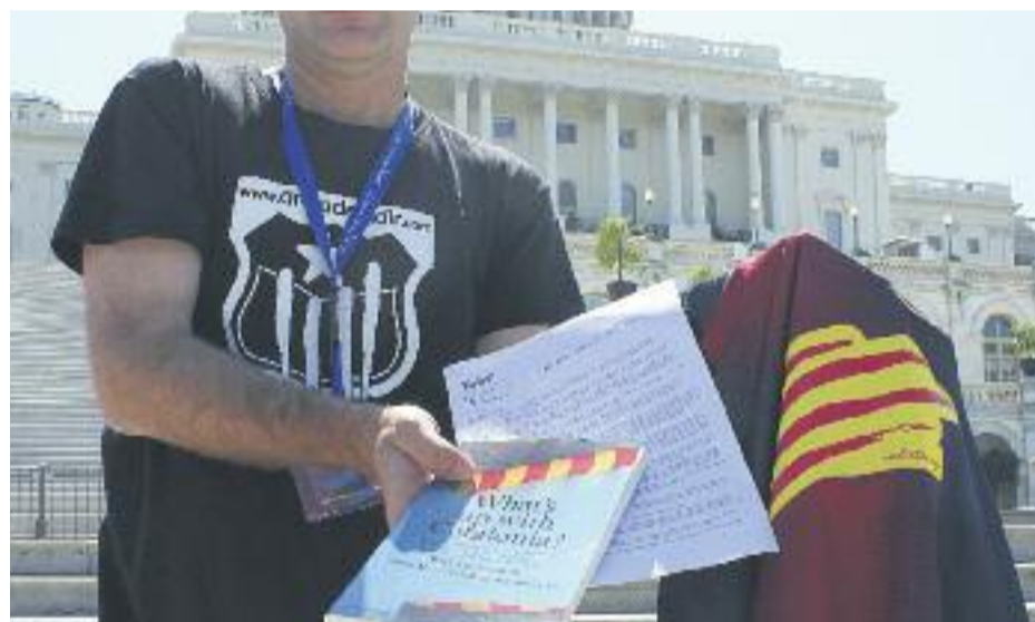
Diversos moments de la ruta que ha fet Dretadecidir.com durant tres setmanes als Estats Units.