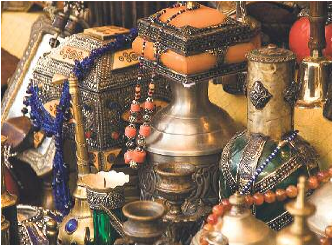
Fira de les Antiguitats a Cornellà.

» L'esdeveniment, que va reunir una quarantena d'expositors, pretén ser un referent pels antiquaris i seguidors del sector