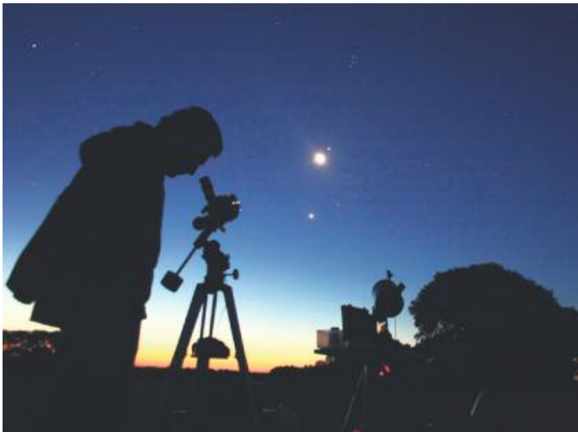
Cartell del programa juvenil 'Nits d'Insòmnia'.

» Fins al juny, el programa Nits d'Insòmnia ofereix una àmplia gamma d'activitats nocturnes als joves de Sant Ildefons