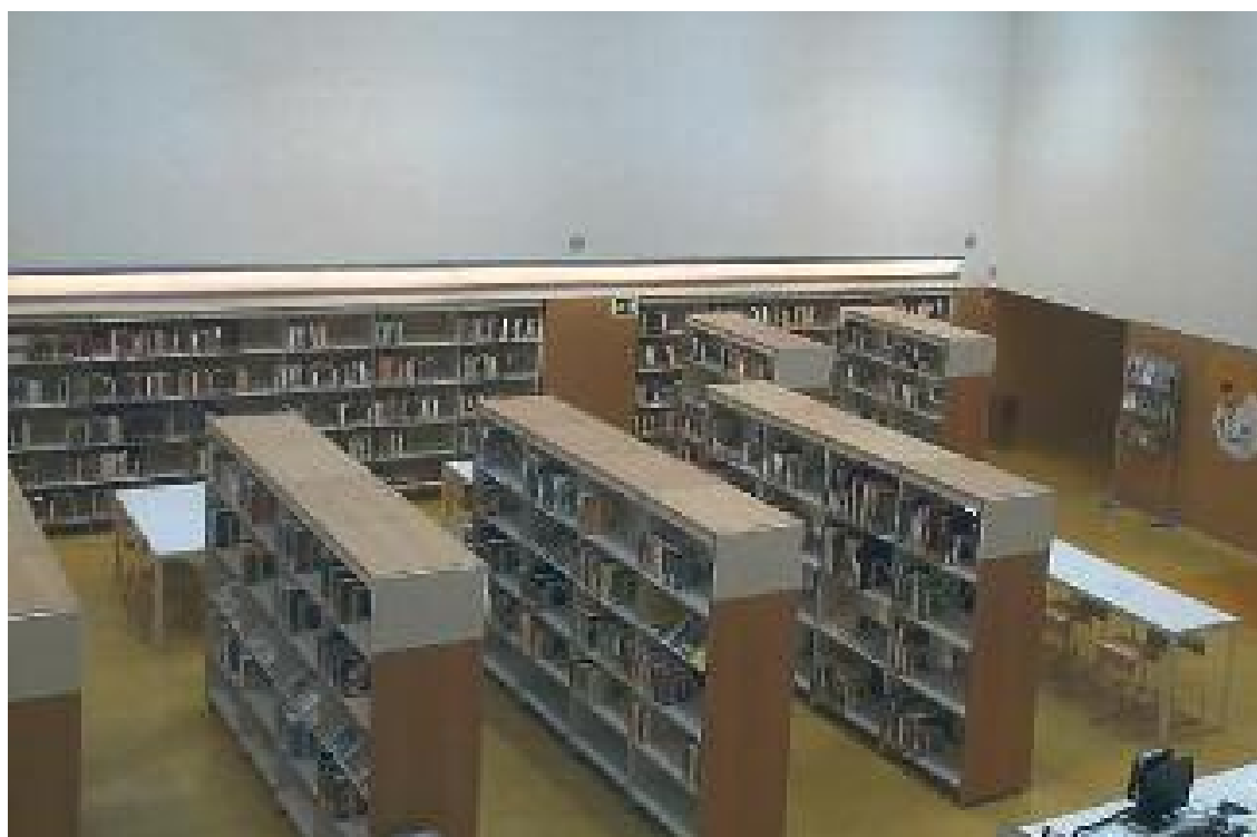
Nou centre cultural de Sant Ildefons.

» Al centre s'emplaça la nova biblioteca, un auditori i una sala d'actes » Les modernes instal·lacions faciliten l'accés a la cultura i a la formació