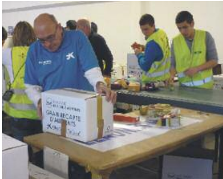
Campanya del gran recapte d'aliments.

Però no ha estat l'única iniciativa solidària en l'àmbit de l'esport a l'Almeda. Els organitzadors del recapte han fet una crida a una