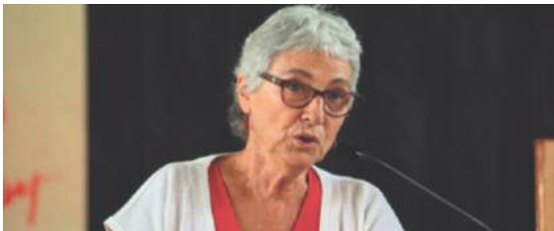
Muriel Casals, presidenta d'Òmnium Cultural.

» L'entitat organitza el cicle Dijous a l'Òmnium de Primavera » La iniciativa pretén difondre la Campanya pel sí a la comarca