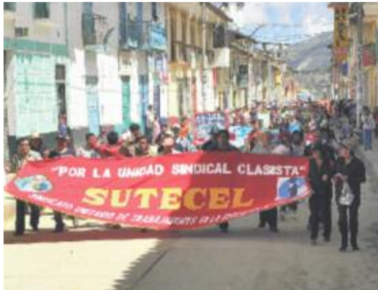
La cooperació sindical a Centreamèrica és clau per a la fundació.

Al mateix temps, l'exposició vol servir de revulsiu per a la implicació personal dels visitants. "Donem informació del que fan els nostres companys a l'estranger, perquè sol ser una tasca desconeguda per l'opinió pública", prossegueix Martín mentre explica el funciona-