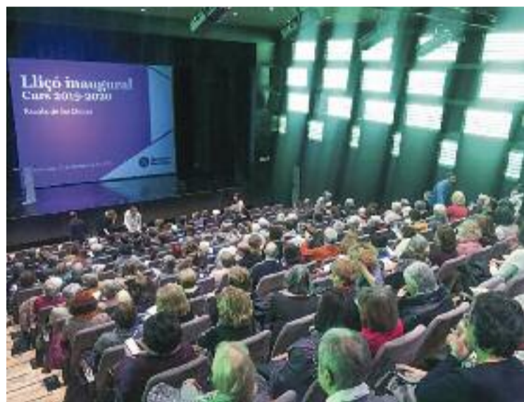
Lliçó inaugural del curs 2019-2020 de l'Escola de la Dona.