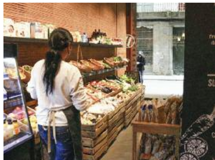
La dependenta d'una botiga en una imatge d'arxiu.

ministeri d'Indústria, Comerç i Turisme del govern espanyol des d'on es pot fer la tramitació per constituir les formes jurídiques més habituals de manera telemàtica i gratuïta. Repartits per la demarcació de Barcelona hi ha 45 d'aquests punts d'atenció, on els interessats poden gestionar d'un sol cop fins a 22 tràmits i crear l'empresa en només 48 hores. Segons les dades facilitades per la Diputació, durant la primera meitat del 2021, la de Castelldefels ha estat la seu on s'han registrat més altes de l'àrea metropolitana.