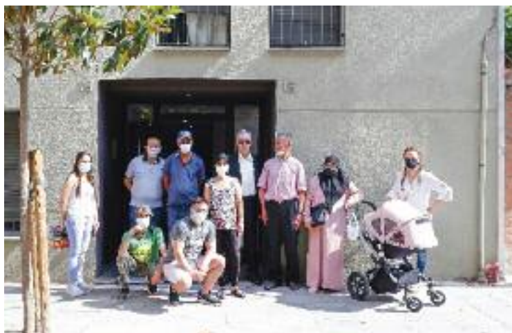
Alguns veïns de l'edifici ocupat, en una imatge d'arxiu.