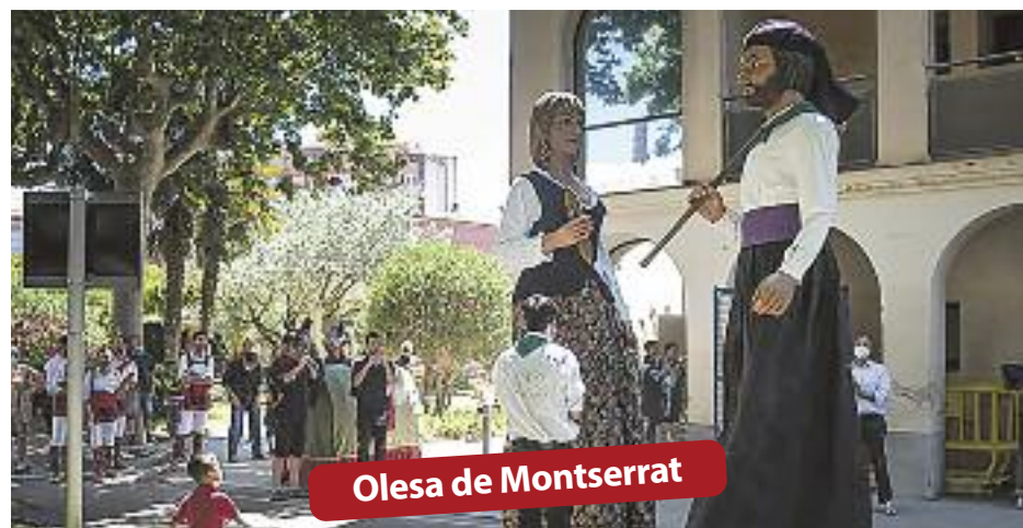
Olesa de Montserrat