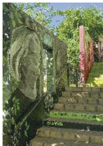
Una de les obres.

senta una dona que "té el seu cor a la mà i l'està oferint a la natura", tal com ha explicat l'artista a martorelldigital.cat . "És un homenatge a totes les dones que han protegit i cuidat la natura", ha afegit. Espinar ha reflectit a la façana de la Nau 1 de Ca n'Oliveres un esperit festiu i de disbauxa. Les també valencianes Feministart han decorat les escales del pavelló amb imatges de dones i missatges feministes.