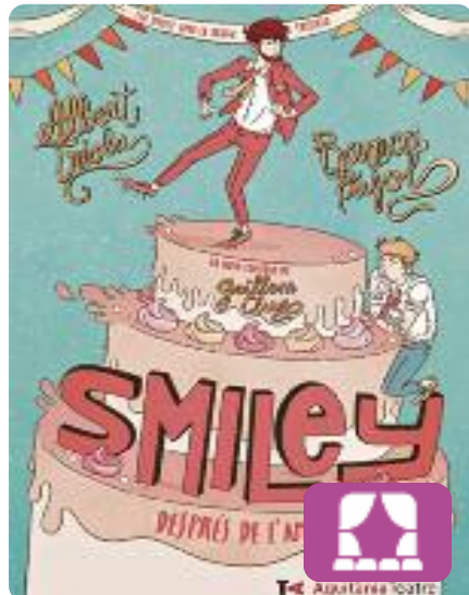
Smiley, después de l'amor Guillem Clua

Una comèdia romàntica contemporània que narra la història d'amor entre l'Àlex i el Bruno, una parella que fa vuit anys que es va enamorar inesperadament i ara s'enfronta a problemes una mica més madurs, però igual de divertits i entretinguts. És el futur dels personatges de l'obra Smiley, una història d'amor .