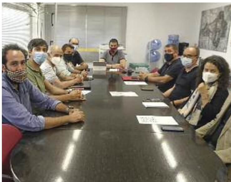
Representants polítics locals s'han reunit a Abrera.

El projecte de reforma i ampliació de l'A-2 es remunta a l'any 2017, durant el govern de Mariano Rajoy, i en aquell moment ja va generar rebuig entre els municipis implicats per la intenció de Foment de fer fins a deu carrils a l'autovia (tres per cada sentit, més els carrils laterals per a la sortida i la incorporació a la via). De fet, aquest no és el primer cop que els representants locals fan pinya per evitar el projecte i per traslladar al Mi-