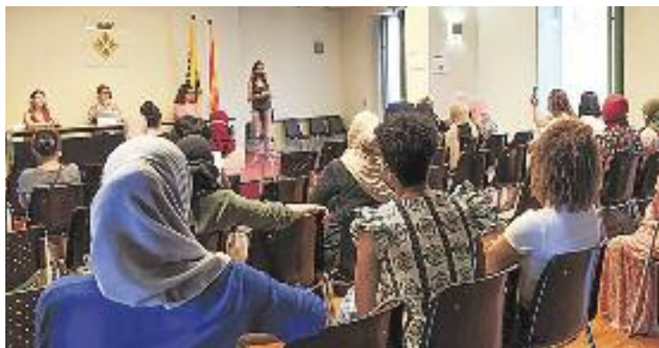
L'acte de cloenda del curs es va fer a Can Pasqual.

Més enllà de la necessitat d'obtenir el certificat, algunes alumnes del curs han explicat al consistori altres motivacions per