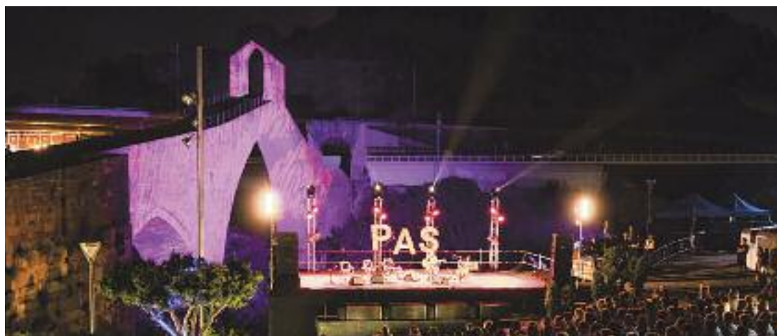
Una imatge de l'última edició del PAS, l'any 2019.

L'encarregada de donar el tret de sortida aquest divendres, dia 9, serà Mèlodie Gimard, que exhibirà al pont del Diable el seu flamenc fusionat amb jazz i música moderna. L'endemà hi tor-