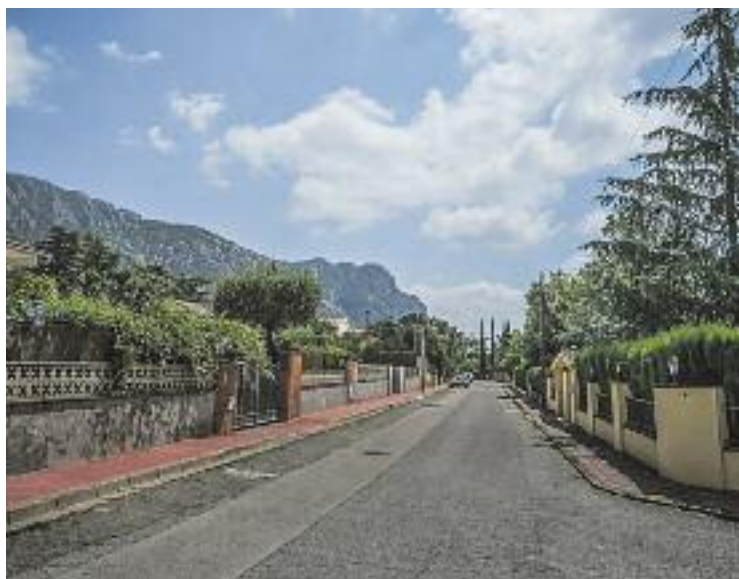
El projecte urbanístic, envoltat de polèmica.