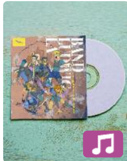
La mateixa sort La Ludwig Band

La Ludwig Band acaba de publicar el seu segon disc, La mateixa sort (The Indian Runners, 2021). El grup d'Espolla (Alt Empordà) va triomfar entre els joves catalans l'any passat amb Al límit de la tonalitat , i amb aquest nou àlbum torna a oferir una bona dosi de folk-rock. La dotzena de cançons que formen el disc ja estan triomfant a Spotify i YouTube.