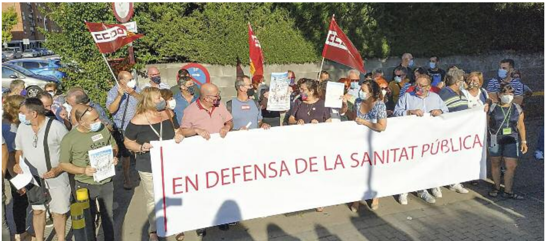
La concentració del dia 30 al CAP de Martorell.