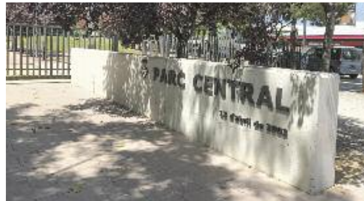
L'acte d'homenatge es farà al parc central.

commemora el 28 de juny. Amb motiu d'aquesta data, el consistori va posar en marxa una sèrie d'actes que acabaran aquest dimarts, 6 de juliol, amb la presentació al Teatre Núria Espert del llibre LGTTBI. Claus bàsiques , a càrrec de l'Observatori contra l'Homofòbia. Altres propostes van ser l'exposició Trencant mites , la projecció del documental Lesbofòbia i el Drag Show organitzat per l'Agrupació.