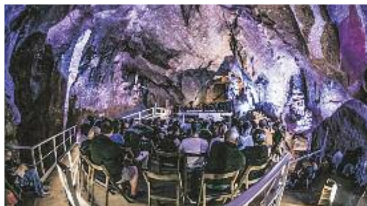
El festival de les Coves de Montserrat repren la 15a edició.

mar part de la Comissió de seguiment del Programa d'adequació de la Urbanització (PADUR) del Bosc del Missé. Torres afirma que diversos propietaris s'hi han presentat, però que caldrà decidir en assemblea la desena de membres definitius.