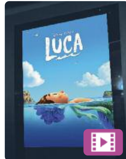
Luca Enrico Casarosa

En un poble de costa, a la Riviera italiana, un nen, el Luca, viu un estiu inoblidable amb tots els ingredients imprescindibles: gelats, pasta... i viatges en escúter. El Luca comparteix aquestes aventures amb el seu nou millor amic, però tots dos han de guardar un secret: l'amic és un monstre marí que ve d'un altre món, ubicat just per sota de l'aigua.