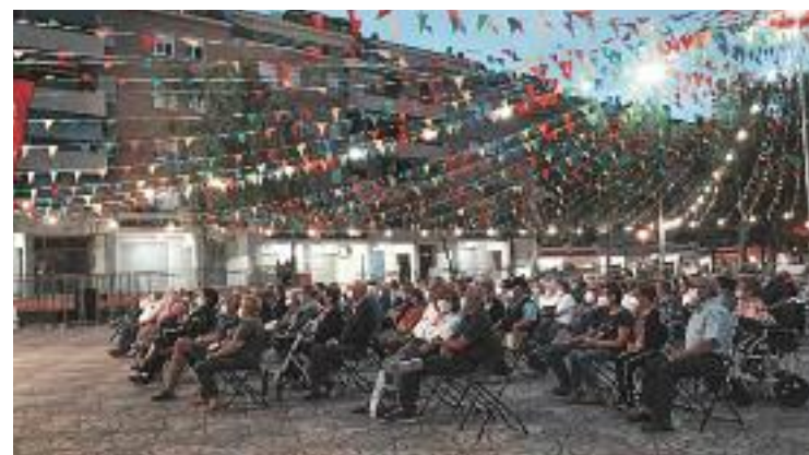
La nit d'havaneres de la Festa Major d'Abrera.

D'altra banda, des del consistori abrerenc van recordar a la reunió les connexions viàries que encara estan pendents de resoldre, com la de la B-40 amb la C-55 i l'A-2, que han d'enllaçar el Vallès amb el Baix Llobregat i el sud de l'Anoia.