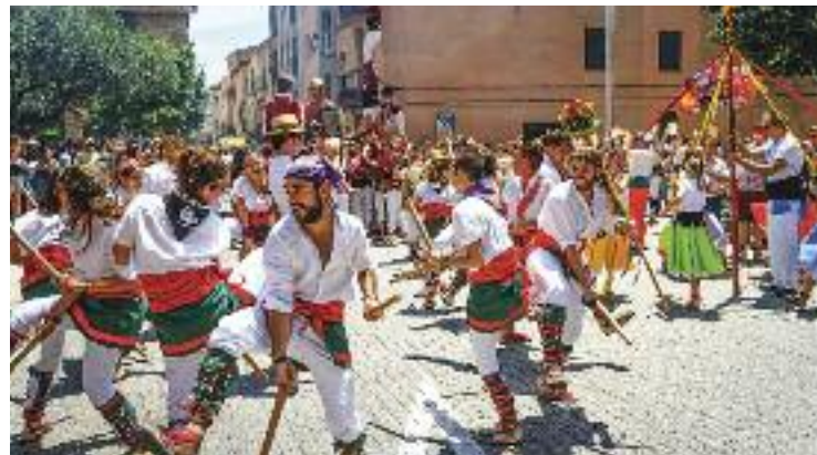
La cultura popular tornarà a sortir al carrer.

Ara, de cara al curs vinent, l'Ajuntament ha avançat que impulsarà una "formació prelaboral" per a persones amb un nivell baix de coneixement de les llengües catalana i castellana, així com dos cursos de nivell bàsic de català que es gestionaran de la mà del Consorci per a la Normalització Lingüística.