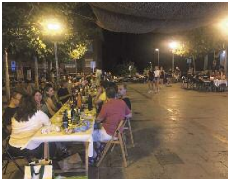
El sopar de la Festa Major 2019, la darrera 'normal'.

La primera activitat serà una sessió de cinema a la fresca amb la projecció de Frozen , mentre que a la nit l'humorista Adrián oferirà un dels seus monòlegs. El