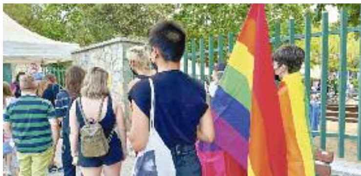
Un dels actes amb motiu de l'Orgull LGTTBI.

El protocol està pensat per a festes majors i altres esdeveniments multitudinaris, com ara concerts o activitats juvenils. Per això preveu, entre altres coses, formar en matèria d'igualtat i diversitat els organitzadors dels actes i els integrants de les entitats locals que normalment col·laboren a les festes. El docu-