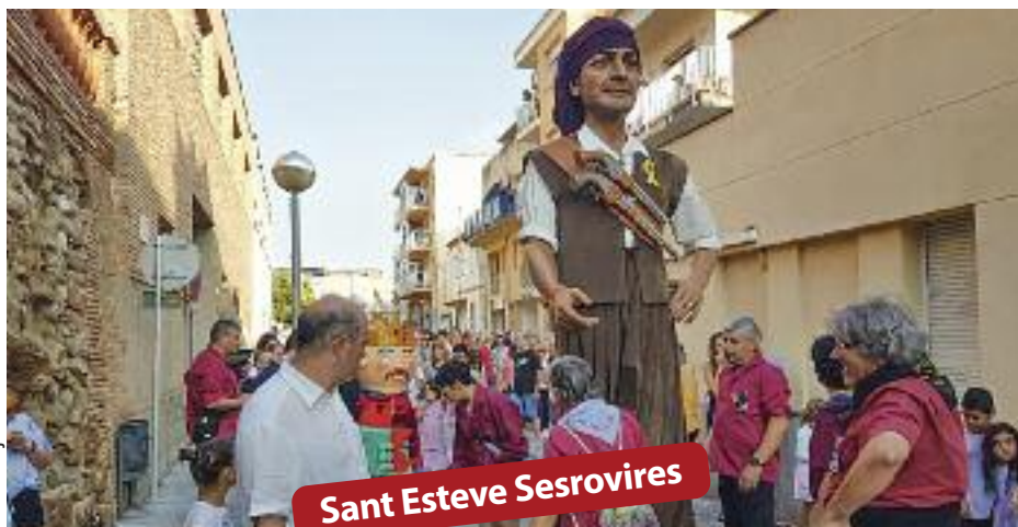
Sant Esteve Sesrovires

▶ Sant Esteve i Esparreguera ho faran aviat amb limitacions però amb força activitats pàgs 14, 16 i 18