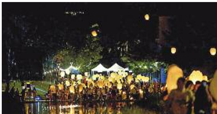
L'enlairament de fanalets al parc municipal.

Una de les estratègies per evitar aglomeracions va ser establir tres escenaris amb propostes diferents: la plaça Catalunya, la plaça de l'Oli i el parc municipal. Aquest últim, per exemple, va acollir els concerts més adreçats al jovent, com el de Lildami. A més, el pati de l'escola Montserrat també va acollir algunes