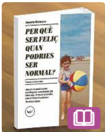
Per què ser feliç quan podries... Jeanette Winterson

Quan Jeanette Winterson va confessar a la seva mare que s'havia enamorat d'una noia, va rebre una resposta que la marcaria per sempre més: "Per què ser feliç quan podries ser normal?". Aquesta és la història d'una dona que no es rendeix, d'un esperit lliure que es va refugiar en els llibres i en l'afecte per sobreviure en un món que no acceptava la seva manera de viure.