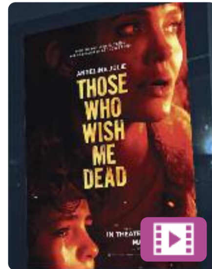
Aquells que desean mi muerte Taylor Sheridan

En Connor (Finn Little), un adolescent que presència un assassinat, és perseguit per dos assassins bessons a través de la salvatge Montana. Tot i que compta amb la Hannah (Angelina Jolie), una experta de la supervivència, per evitar que el trobin, un incendi proper aviat amenaçarà amb posar fi a la vida de tots els implicats.