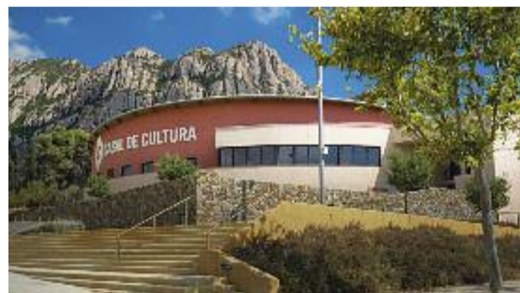
El Casal de Cultura amplia l'horari.

L'alcalde Miquel Solà ja va explicar a Línia Nord que aturar el PADUR suposaria "no poder accedir a possibles línies d'ajudes" i va recordar que, tot i les queixes de manca de participació, l'Ajuntament ha fet "moltes reunions" amb els propietaris.