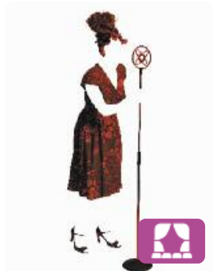
L'Emperadriu del Paral·lel Lluïsa Cunillé

Pocs mesos abans que es proclamés la Segona República, Barcelona plora la seva artista més estimada i aclamada: Palmira Picard, l'Emperadriu del Paral·lel. Mentre la gran avinguda de l'oci barceloní està de dol, l'efervescència nocturna ha convocat al bar La Tranquil·litat tot d'artistes que beuran a la seva salut. Al Teatre Nacional de Catalunya.