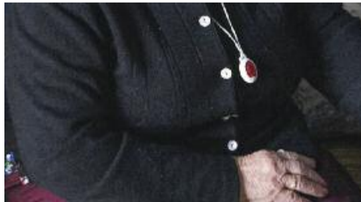
El nou sistema ha millorat la digitalització del servei.

aquest sentit, destaca l'espectacle itinerant Moltes gràcies , de Quim Masferrer, que recorrerà els carrers del municipi i farà participar els veïns. També hi haurà altres propostes d'animació, un concert i mostres d'entitats locals, com la cinquena trobada de percussió de la Colla de Diables. Tot plegat, això sí, amb les mesures de seguretat que ha imposat el coronavirus.