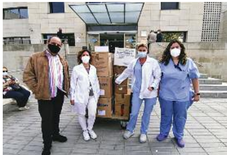
Dues ONGs locals han rebut una donació de medicaments.