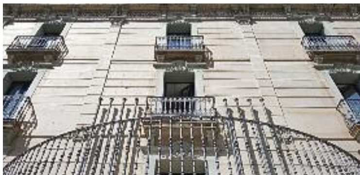
El govern diu que la informació s'ha fet pública quan s'ha pogut.

En aquest sentit, el consistori ha fet un comunicat explicant que ja ha fet arribar la documentació demanada –concretament, l'informe mediambiental sobre el pla d'ordenació urbanística municipal (POUM) emès per la Generalitat– a la plataforma. L'Ajuntament ha aclarit "que s'ha lliurat quan el tràmit d'aprovació provisional del