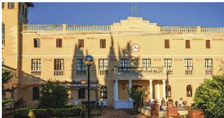
La residència municipal Can Comelles va superant el brot.