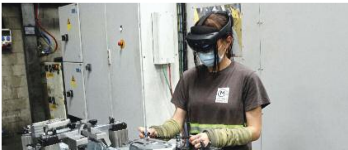
Una operària de Meleghy Automotive treballant amb les ulleres de realitat mixta.

capaç de fer tots els processos de la mateixa manera, sense saltar-se passos per garantir la qualitat del producte", ha detallat Rodilla al mateix mitjà.