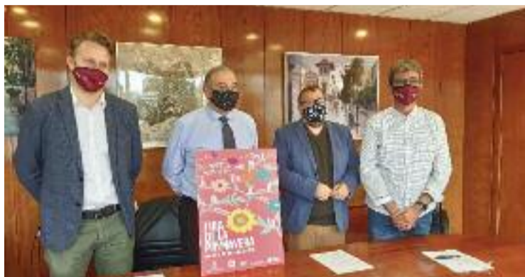
Un moment de l'acte de presentació del programa de la fira.

Tal com ha detallat l'Ajuntament, hi participaran més de 160 botigues, que faran descomptes i promocions mentre duri la fira. A més, els clients que comprin als establiments implicats durant aquests dies optaran a diversos premis econòmics, que poden arribar als mil euros per gastar al comerç local. Per al pre-