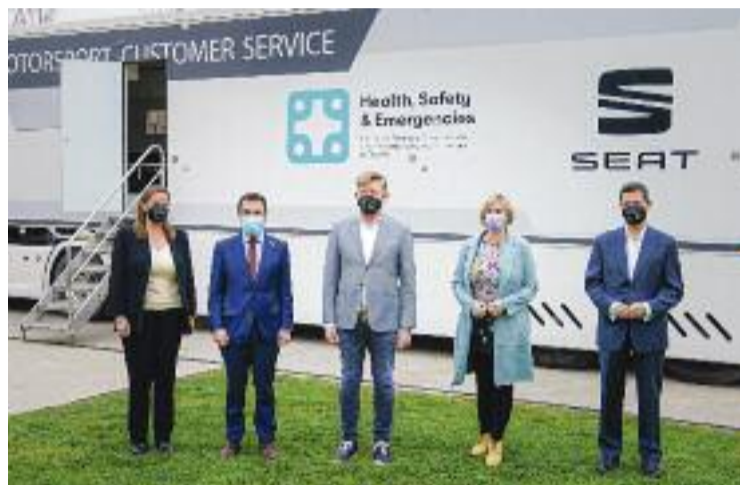
La companyia s'ha coordinat amb el Departament de Salut.