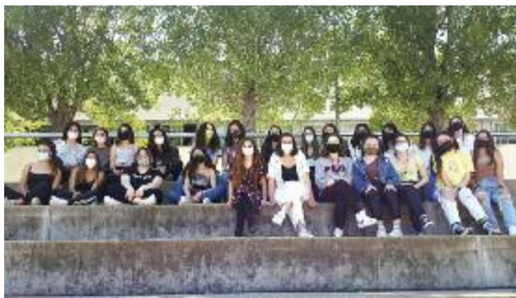
Les alumnes de Sant Esteve que hi participen.