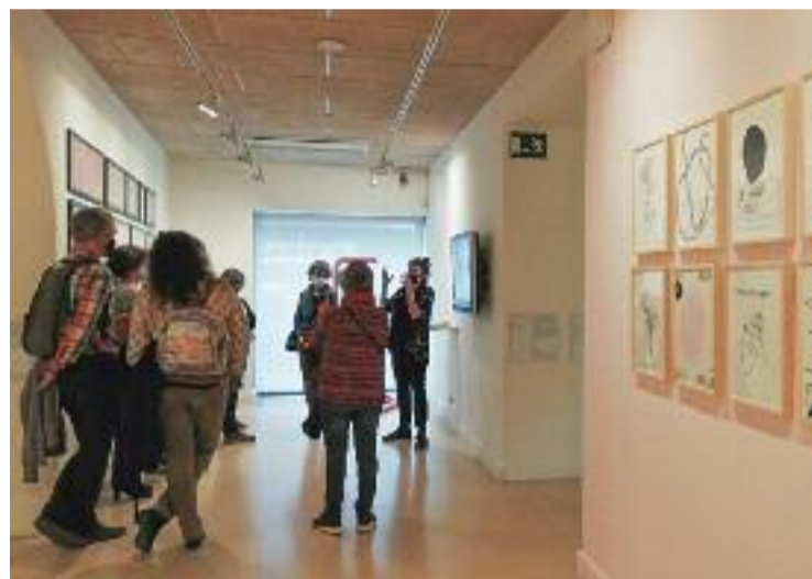
Una de les activitats del Dia dels Museus a l'Espai Muxart.