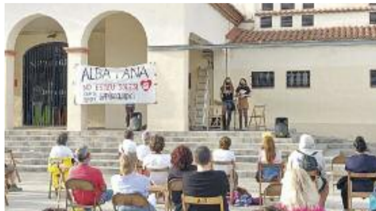
Una imatge de l'acte de dissabte passat.