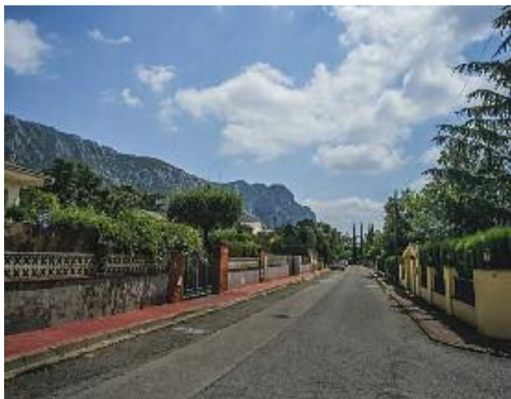
Pocs veïns van participar en la consulta del consistori.