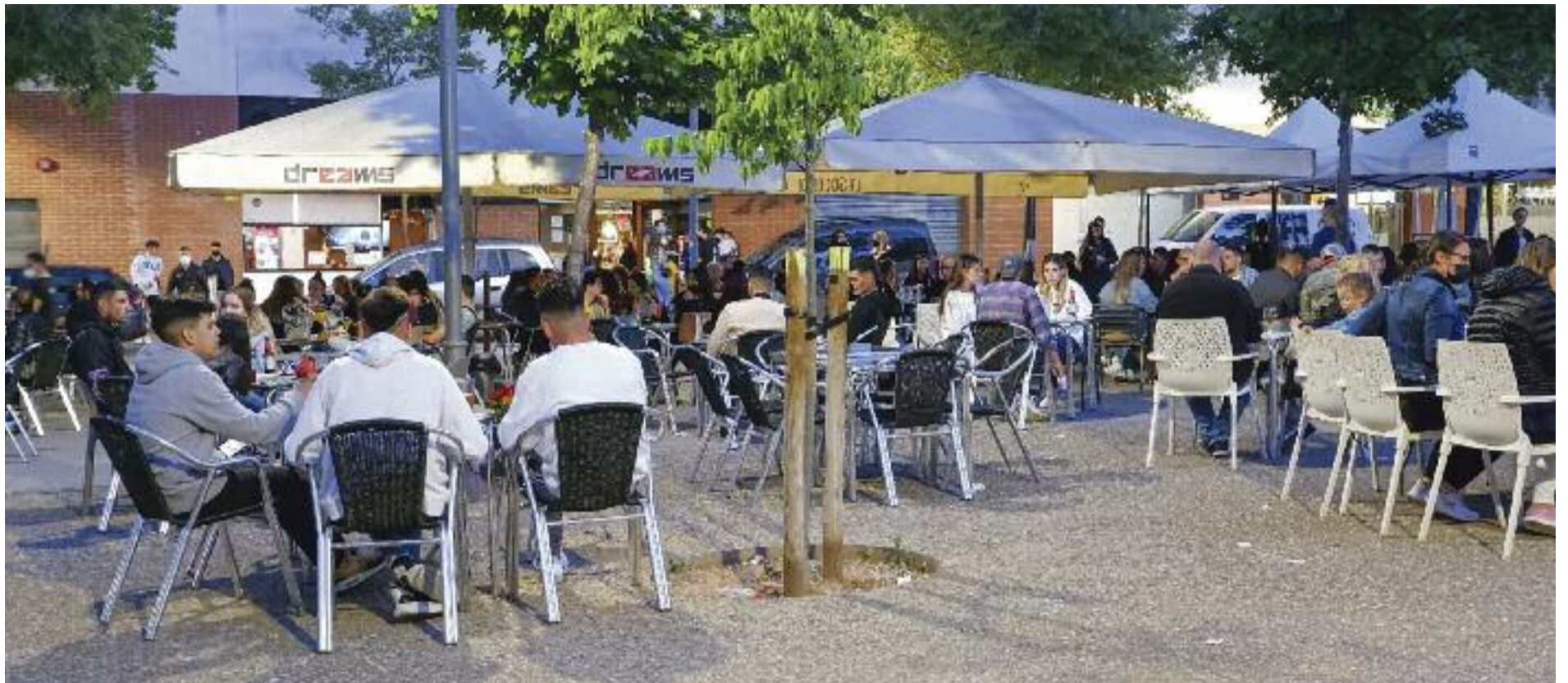
Les terrasses de bars i restaurants tornen a tenir vida als vespres.