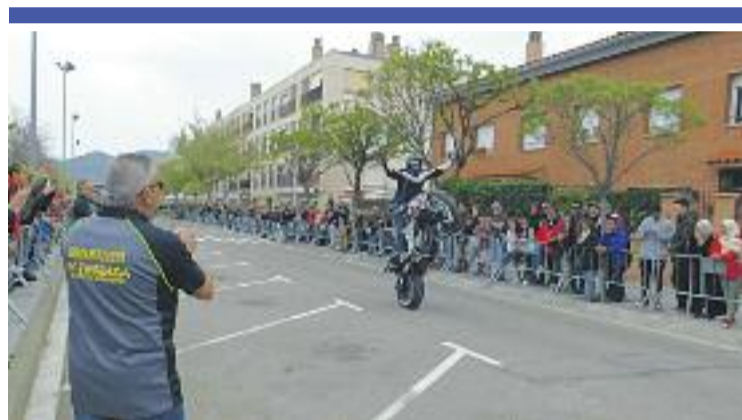
MOTOR ▶ El Parc de Can Morral va acollir a principis de mes la quarta Trobada de Motos, organitzada per Moto Club Off-Road El Suro i els Amics de les Motos d'Abrera.

Fercan va rebre el premi a la millor iniciativa empresarial promoguda per a aturats de llarga durada. Per altra banda, Eire School of English va quedar finalista en la categoria de millor empresa en creació de llocs de treball, i Esports Abrera a la d'iniciativa per a aturats de llarga durada.