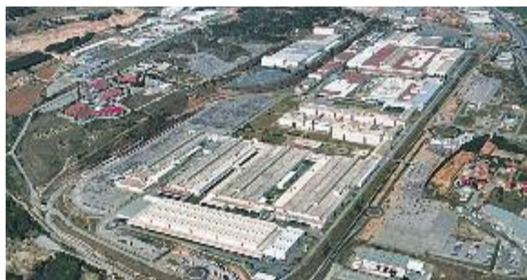
La seu del grup Seat, a Martorell.

De Meo va assegurar que, mentre el context polític no afecti la companyia directament, Seat no ha de parlar d'aquest tema. "Només hem de seguir produint cotxes", va assegurar l'italià, i va voler afegir: "Estem molt orgullosos de ser d'aquí". La resposta va arrencar els aplaudiments del públic assistent, format per personalitats del món econòmic català.