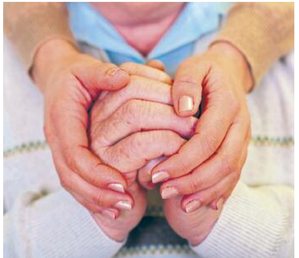
L'Alzheimer serà, segons els experts, una epidèmia en els pròxims anys.