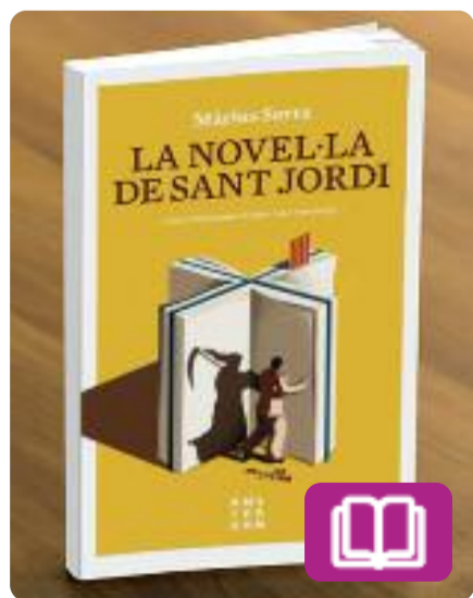
La novel·la de Sant Jordi Màrius Serra

Ambientada en el primer Sant Jordi d'una República Catalana, Serra ofereix un retrat satíric del món editorial on una sèrie de crims tenyeixen la diada en un bany de sang.