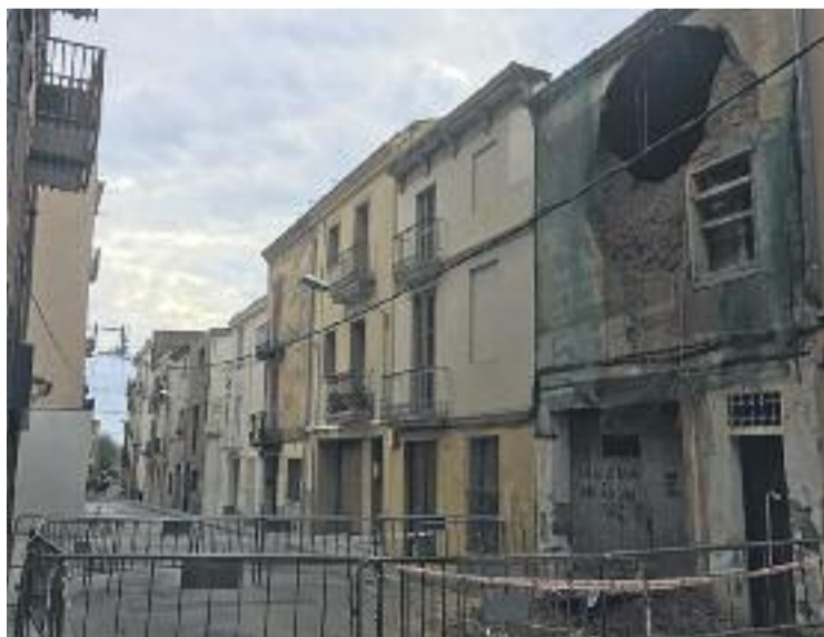
Imatge de la casa després del despreniment.

De tota manera, el consistori considera que és necessari tirar a terra l'edifici. La pluja insistent que ha caigut durant el passat mes de març i ara a l'abril és la causa immediata del despreniment, tot i que dies abans els tècnics observaven amb preocupació l'estat de la casa. De fet, asseguren fonts municipals en un comunicat, des de l'Ajunta-