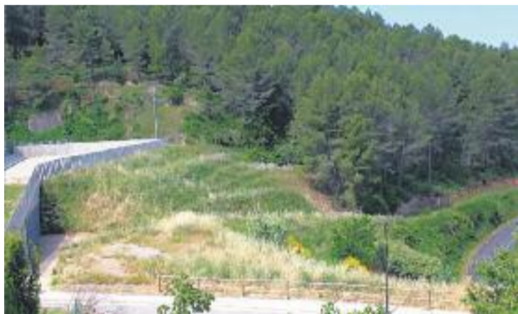
El consistori estudia tres possibilitats.

Des de l'Ajuntament expliquen que el cost de pavimentar el camí –l'opció més simple– és