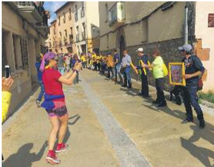
Un moment de l'escalada al Cavall Bernat.

L'acte va ser organitzat per l'Associació Catalana pels Drets Civils, formada per familiars dels presos que reclamen el seu retorn a casa. "Hem fet el cim!