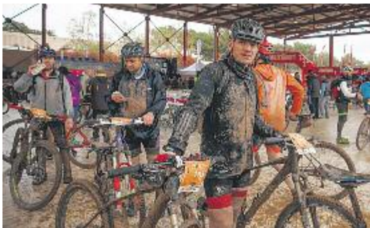
Alguns dels participants, plens de fang.

De fet, poc més de 20 minuts després de l'inici de la cursa del diumenge, la forta pluja i el vent va obligar a modificar alguns punts de viatjament, perquè alguns dels participants presentaven símptomes d'hipotèrmia, degut a la baixada de les temperatures i a les precipitacions. A més, passat el punt de Marganell, l'organització va decidir modificar lleugerament el recorregut