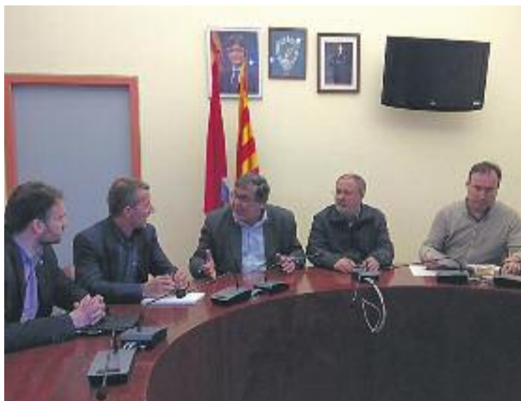
Un moment de la reunió amb Endesa.

QUEIXES PEL TRANSFORMADOR Per altra banda, el consistori va aprofitar per comentar a la reu-