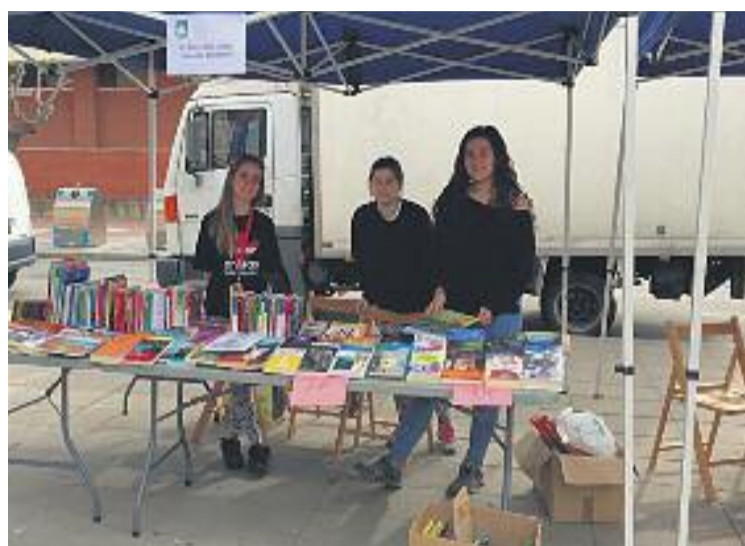
Membres d'El Bloc venent llibres de segona mà per Sant Jordi.

Per tal de fer-se conèixer entre la població i, especialment, entre el sector juvenil martorellenc, busquen participar com a entitat en diferents actes socials i culturals celebrats al municipi. La primera aparició va ser el passat 23 d'abril, per Sant Jordi, a la pla-