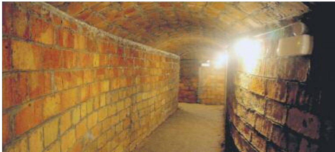
Una imatge de l'interior del refugi antiaeri de Martorell.

El tret de sortida de la Setmana del Refugi Antiaeri el va donar l'exposició 'Sota les Bombes', presentada el dia 6 d'abril. El