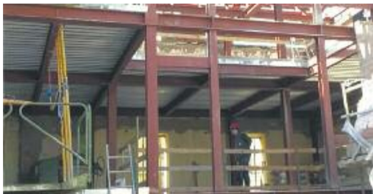
Una imatge dels treballs de reforma.

Aquest edifici allotjarà les noves dependències de les regidories de Dones i Igualtat i Serveis Socials. Fonts municipals expliquen que l'edifici tindrà espais "més amplis, lluminosos i accessibles per a persones amb mobilitat reduïda", amb un ascensor per a les tres plantes que hi haurà.