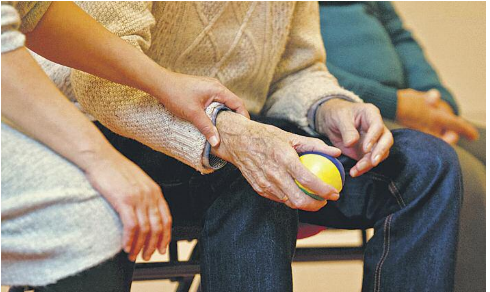
El projecte 'Bon Veïnatge' està obert a tots els veïns, comerciants o entitats que vulguin col·laborar amb la gent gran que viu sola.

» Martorell impulsa un programa veïnal per detectar situacions de vulnerabilitat en la gent gran » La xarxa 'Bon Veïnatge' vol facilitar que puguin viure a casa seva el màxim de temps possible