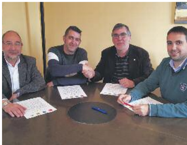
Moment de la signatura de l'acord de govern.

L'acord amb LxS es va signar a finals del febrer i és un annex del qual van signar PSC, Entesa i PDeCAT, on expressaven la seva voluntat de no excloure la possibilitat que altres grups municipals poguessin afegir-s'hi. De fet, destacaven l'interès de