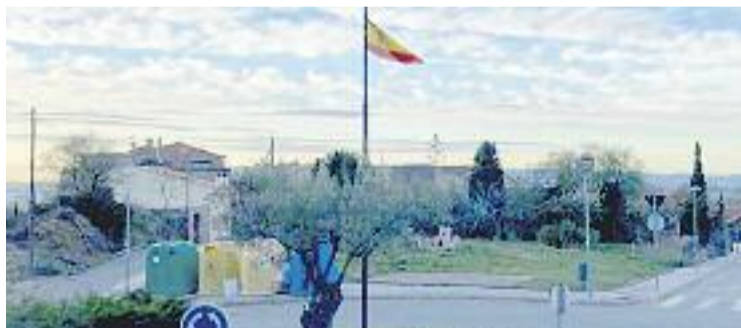
La bandera d'Espanya va ser despenjada el mateix dia 16.

Tanmateix, la bandera espanyola va ser despenjada aquell mateix migdia i l'estelada ja oneja de nou a la rotonda, tal com explica a Línia Nord l'alcalde Miquel Solà. Segui com sigui, Solà ha volgut demarcar l'Ajuntament de tot plegat. "El