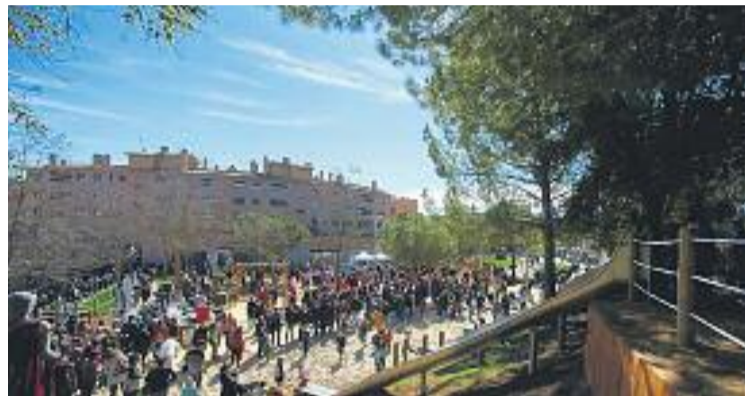
Inauguració del Parc Europa.

El Parc d'Europa, situat al barri del Camí Fondo, s'ha con-