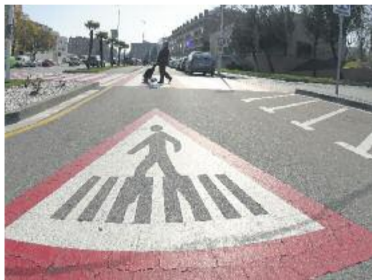
La carretera de Martorell és un vial clau en la mobilitat.

La conversió de la carretera de Martorell en un bulevard és un dels principals projectes de l'equip de govern per al mandat.