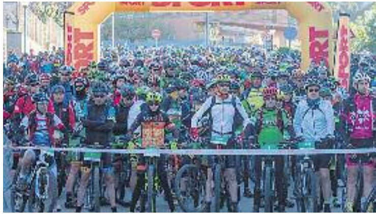
Els participants de l'edició del 2017, esperant la sortida.

Com és habitual, el primer dels dos dies de la Portals servirà per organitzar la pedalada solidària. Així, el dissabte 7 d'abril, a partir de dos quarts de vuit del matí, els participants d'aquesta modalitat arrencaran des