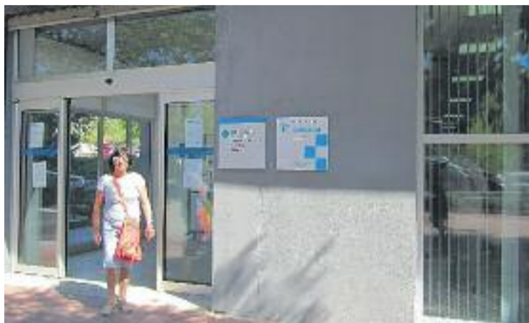
Al poble hi ha dos CAP i un consultori.