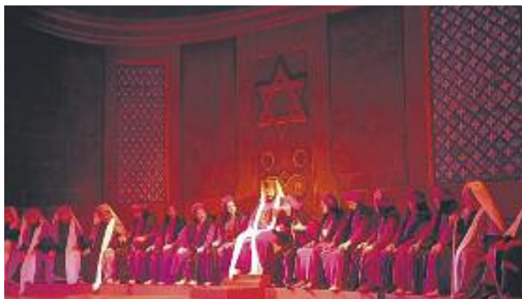
Reunió del Sanedrí de la representació.

En el terreny d'espai escènic, s'ha treballat en un nou projecte per al quadre de Jesús davant Herodes i s'ha dedicat un esforç importantíssim al món dels objectes. En el terreny del vestuari se segueix en la línia de l'any passat, amb la renovació de vestuaris dels grups més destacables