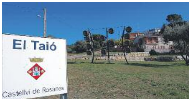
Entrada al barri del Taió.

L'alcalde Joan Carles Almirall assegura que ha quedat resolt "un problema molt gran que tenia Castellví i que feia perillar la sostenibilitat de la gestió de l'aigua municipal", però creu que encara cal fer moltes reparacions a la xarxa del barri. El total de les actuacions necessàries per renovar les instal·lacions del Taió suposarà una inversió d'un milió d'euros, aproximadament. A partir d'ara,