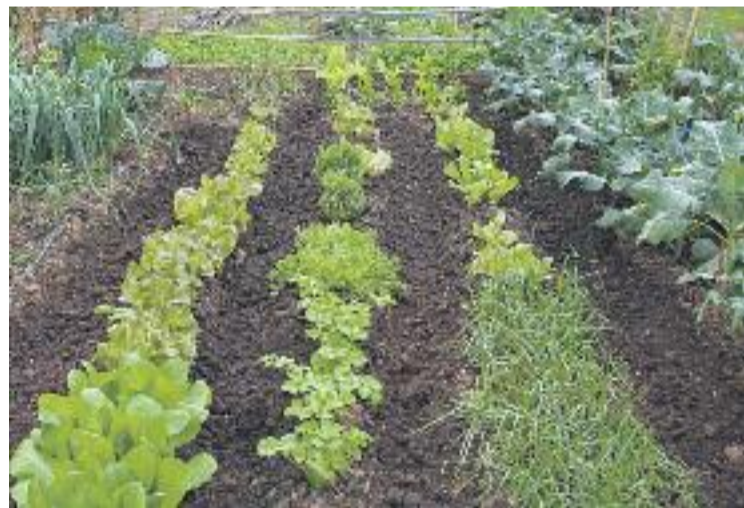
La iniciativa vol recuperar els cultius tradicionals.

SOCIETAT ▶ L'Ajuntament i la Fundació Futur han posat en marxa un projecte per promoure la creació de cooperatives agrícoles i, de retruc, fomentar l'ocupació de persones amb discapacitat. Aquestes cooperatives seran de cultiu ecològic i treballaran per recuperar alguns de tradicionals, el mètode de treball antic, el respecte pel medi ambient i la utilització d'energies renovables, entre altres.