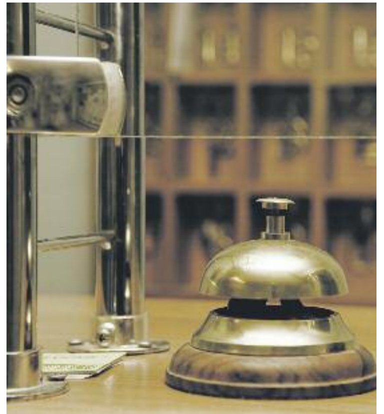
El comerç i l'hostaleria són els sectors que van registrar més contractes l'any passat.