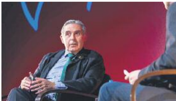
L'acte va tenir lloc al Teatre Núria Espert.

Però la conferència va abordar molts altres temes, com ara la situació política del país. En aquest sentit, Llorca va reclamar que "per mirar endavant amb