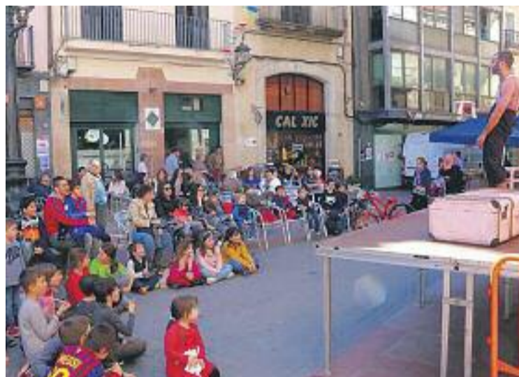
La plaça de la Vila durant el Dia de la Cooperació.

Les entitats participants van ser l'ONG Mans Mercedàries, Vedanthangal Sangam Laia Foundation, els Amics de Fundase Bolívia, l'ONG Ocularis i la Fundació Anepal. A la tarda, els responsables de totes cinc van presentar els seus projectes a El Círcol, a una taula rodona titulada "Com cooperem des de